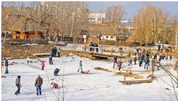
На озері дітвора й дорослі ковзали по кризі, причому останні геть забули про свій вік