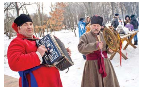
Музики весь день розважали киян своїми піснями