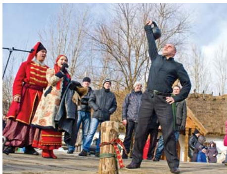
Хлопці змагаються, хто більше разів підніме гиру завважки 24 кг