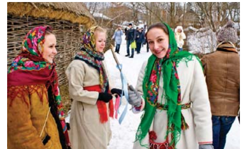
Такі палиці прив'язували неodrужним хлопцям і дівчатам, а зняти їх вони могли тільки відкупившись танцями або участю у конкурсах