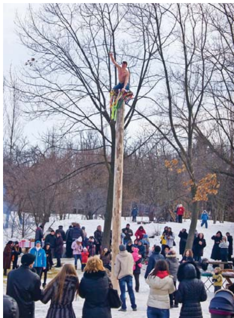
Хто вилізе на стовп і відв'яже стрічку – отримає подарунок