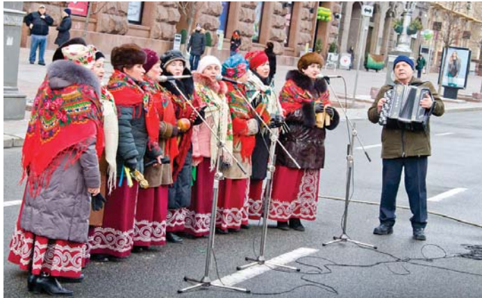
На Хрещатику та Майдані Незалежності виступали народні колективи