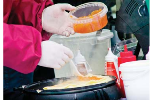
Масляна прийшла – млинців напекла

Коли люди почали святкувати Масляну, навряд чи вже хтось згадає. Але те, що млинці й вареники – неодмінний атрибут свята, знають навіть діти. Українці впродовж усього минулого тижня проводжали зиму – розпочали 11 березня, а завершили 17-го. Якщо повністю дотримуватися традицій, то щодень слід було відзначати особливо. Приміром, перший день – це зустрічний понеділок, вівторок – загравання, у середу – славновісний тещин млинці, на четвер припадає середина масляничних ігор і веселощів, у п'ятницю зяті запрошують тещ на гостину, у суботу – посиденьки у невістки. А завершилася Масляна Прощеною неділею, коли православні обмінювалися поцілунками й просили взаємного вибачення за скоєні гріхи.