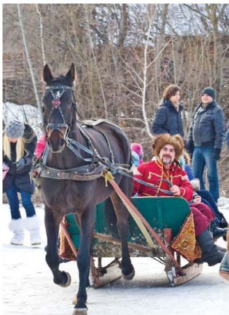
Кататися на саях, запряжених кіньми, полюбують усі