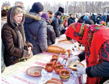
Млинці на будь-який смак