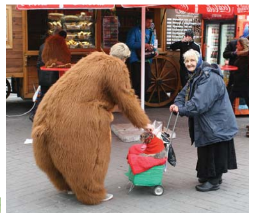
Інколи виходить так, що тварини допомагають вижити господарю, а отже, й собі...

Зазвичай у виборі тварин вирішальну роль відіграють обставини. Адже часто маленька й затісна квартира, тривалі подорожі та неможливість приділяти більше уваги улюбленцю змушують нас віддавати перевагу хом'ячку перед песиком чи котиком, не кажучи вже про екзотичних братів наших менших. До речі, батькам слід пам'ятати, що саме поява в домі будь-якого живого об'єкта опіки розвиває в дітей почуття обов'язку, потреби піклуватися про когось та й просто ніжності. Але щоб досягти найбільшого виховного ефекту, тваринку має вибрати сама дитина. А за подароване тепло та гарний настрій домашні улюбленці обов'язково віддячать нам відданістю та любов'ю.