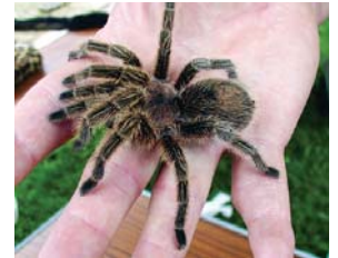
Тарантул попри поширену думку, як правило, не становить загрози для людини. Як незвичайна домашня тварина, невибагливий до їжі. Його улюблена страва – комахи