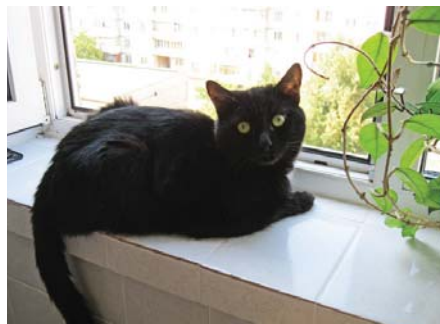
А домашнє кошеня, сидячи на підвіконні, мабуть таки мріє про прерії і савани, про вільне життя, яке мають його далекі родичі, бо ж у кожному котуку живе лев або пантера...