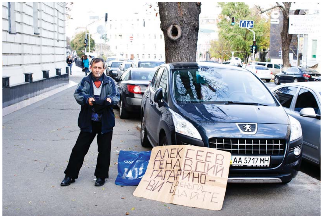
Соціальну справедливість кожен розуміє по-своєму: комусь на хліб не вистає, комусь – на бензин для іномарки...

ва за рішенням 62-ї сесії Генеральної Асамблеї ООН з 2009 року 20 лютого проголошено Всесвітнім днем соціальної справедливості, який відзначається щороку. Вже другий рік поспіль і в Україні знають і відзначають День соціальної справедливості, запроваджений Указом Президента України за ініціативи ФПУ. Аби порушити нагальні питання соціальної несправедливості, почути думки різних сторін соціального діалогу, ФПУ спільно з Міністерством соціальної політики України за підтримки Регіонального Представництва Фонду ім. Ф. Еберта в Україні та Білорусі проводять Тиждень соціальної справедливості.