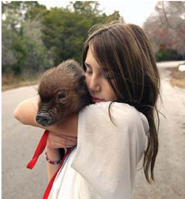
Домашні свині – милі, люблячі і доброзичливі вихованці. Популярні різновиди – в'єтнамська свиня, мініатюрна свиня і кун-кун, яких рідко утримують вдома порівняно з кішками та собаками. До речі, популярність свиней як домашніх вихованців виникла після того, як їх почали тримати вдома знаменитості