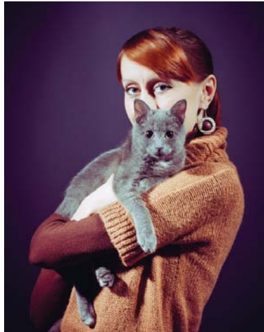
Мода модою, але тримати на руках такого милого, пухнастого котика все-таки приємніше, ніж свиню...