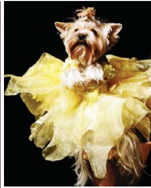
Така собі кумедна жива іграшка для дітей і дорослих. Правда, це задоволення господарю обходиться недешево...