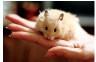
А кумедні хом'ячки, мабуть, найпопулярніші домашні тварини серед усіх представників гризунів. До того ж, невибагливі у догляді