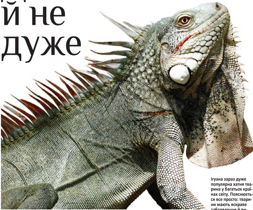
Ігуана зараз дуже популярна хатня тварина у багатьох країнах світу. Пояснюється все просто: тварини мають яскраве забарвлення й являють різну зовнішність, досить великі, до того ж харчуються рослинною їжею