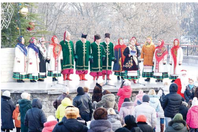
У рамках виставки організовані народні гуляння і виступи творчих колективів