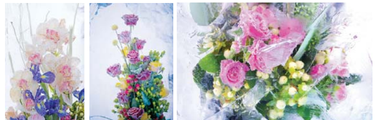
Довелося сквати крижані квіти від дощу та сонця під навіси