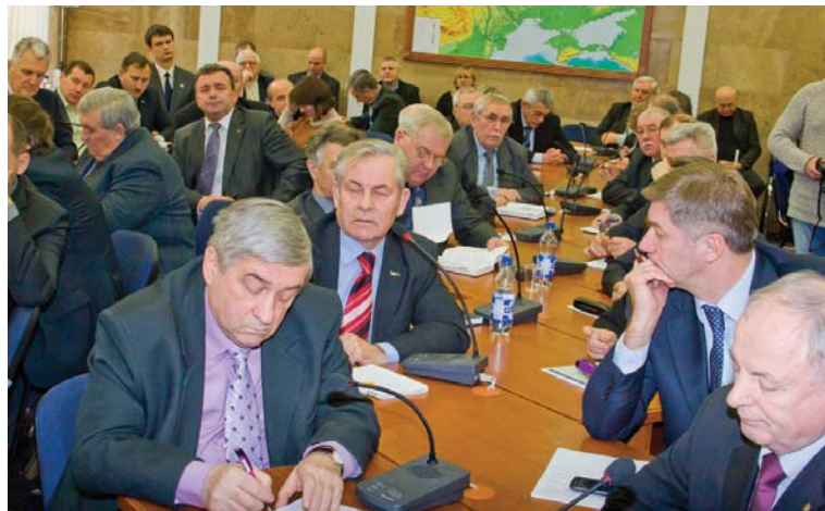
ЗУСТРІЧ | СПІВПРАЦЯ