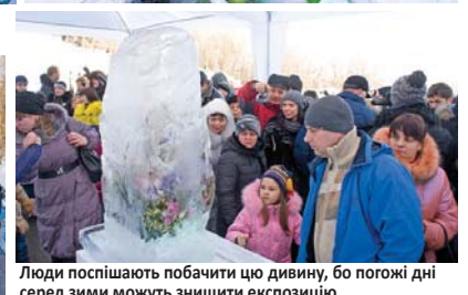
Люди поспішають побачити цю дивину, бо погожі дні серед зими можуть знищити експозицію