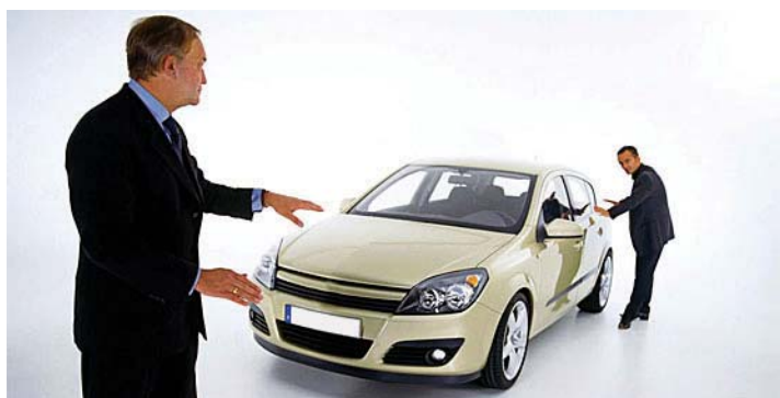
За прогнозами експертів, і продати, і купити автомобіль тепер буде набагато простіше

З перших днів нового року зміни відчують на собі автомобілісти, особливо стосовно ввезення на територію країни транспортних засобів. Відтепер забороняється ввозити в Україну автомобілі, що не відповідають нормам Євро-3. В Європі такий екологічний показник діє з 1999 року, в Росії він запроваджений дещо пізніше. Таким чином, імпорту уживаної техніки має скоротитися. Найстаріші зразки автомобілів з європейського «звалища» до країни не потраплятимуть.