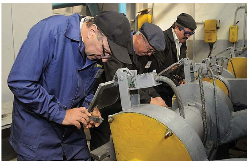
Аксакали токарної справи. На Лозиському ковальсько-механічному заводі не поспішають відправляти на пенсію ветеранів виробництва

Мінсоцполітики підготувало кілька законопроектів, які підтримані проф-