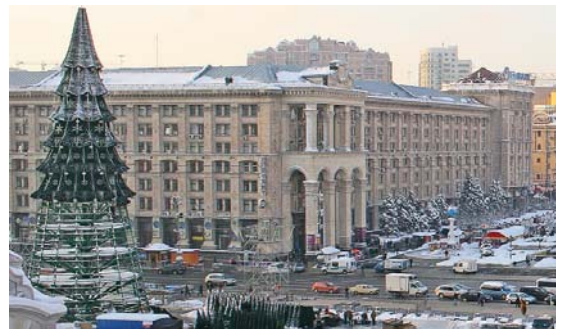
Роботи із встановлення новорічної ялинки велися майже місяць, а урочисте відкриття відбулося 19 грудня – у День Святого Миколая.