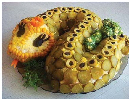
Прикрасою святкового столу може бути будь-який салат, що вам подобається, оформлений у вигляді Змійки.

Неважливо, якого роду – чоловічого чи жіночого – символ наступного, 2013, року: плазуни мудрі та примхливі вночі. Як зустріти рік, аби догодити Змії з перших хвилин Нового року? Фахівці стверджують, що Чорній Водяній Змії до вподоби, коли її зустрічають у гамірній, веселій компанії. А ще – великою кількістю страв на святковому столі. Треба зважати на те, що Змія – хижак із неабиякими кулінарними вподобаннями. На столі має бути купа усялякої смакоти, як-от м'ясо, приготоване різноманітними