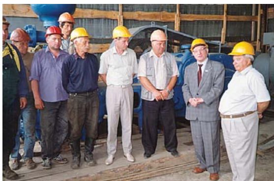
На буровій Миргородській нафтогазової експедиції, 2005 рік