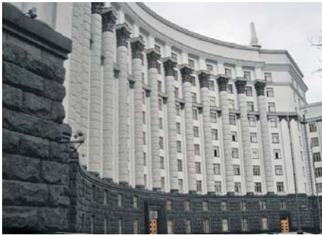
Шановний Петре Олексійовичу!

Федерація професійних спілок України, розглянувши чергову редакцію проекту Закону України «Про правовий режим майна загальносоюзних громадських об'єднань (організацій) колишнього Союзу РСР», який 7 листопада 2012 року було розміщено для громадського обговорення на офіційному сайті Міністерства економічного розвитку і торгівлі, вважає вказаний законопроект неприйнятним у зв'язку з тим, що він суперечить законодавству з огляду на наступне.