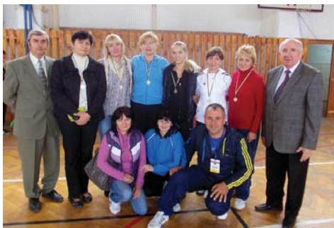
Команда м. Ужгорода – переможець змагань з волейболу

Ювілейна спартакіада освітян Закарпаття засвідчила, що в області активно займаються фізкультурою і спортом: загалом у спартакіадних стартах усіх рівнів – від первинної ланки до фінальних змагань Х обласної галузевої спартакіади – взяла участь понад 3 тис. працівників закладів та установ освіти нашого краю.