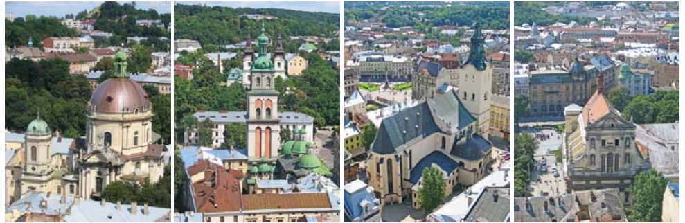
Тетяна МОЛОДИКА