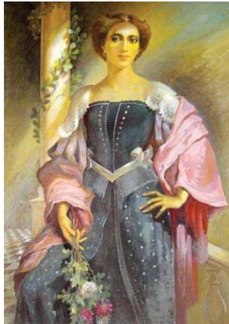
Портрет Соломії Крушельницької пензля Богдана Сойки

І все ж пальма першості у вітчизняному солемізнавстві належить видатному музикознавцю й дослідникові, заслуженому діячеві мистецтв України Михайлу Головащенку. Фактично саме його невтомна багаторічна праця, особисті знайомства із сучасниками співачки, поїздки, широке листування з десятиліттями й сотнями митців, офіційних осіб, із театрами, музеями, муніципалітетами, бібліотеками тощо в десятках країн дали той неопізнаний фонд-скарб спогадів, документів, світлин, листування, що склали його заслугу перед Україною, зокрема й у цьому контексті, згадувалися й нагадувалися частіше. Якщо говорити про згада-