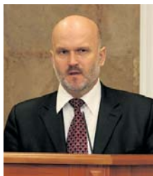
Заступник Голови ФПУ Сергій Українець висловив серйозне занепокоєння зростанням смертельного травматизму в низькоризикових галузях

Сергій Українець також наголосив, що профспілки завжди виступали за те, що для підприємств та їх власників має бути запроваджено систему економічних стимулів щодо зниження рівня травматизму. Не тільки керівників підприємств необхідно карати за те, що вони належним чином не організували систему охорони праці, санкції мають застосовуватися до підприємства, тобто оплачуватися за рахунок власника – як штрафні, так і