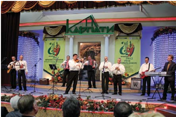
Справжнє мистецьке свято, наповнене світлом, гармонією і радістю, пройшло в атмосфері дружньої підтримки конкурсантів