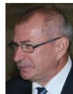
Юрій Кулик, Голова Федерації профспілок України

Розглядалися питання подальшої співпраці з органами державної влади та роботодавцями в сфері молодіжної політики. Зокрема, йшлося про необхідність домагатися від органів законодавчої та виконавчої влади всіх рівнів пріоритетного вирішення питань, пов'язаних із залученням представників профспілкових та громадських організацій до роботи в дорадчих органах із питань молоді, наданням державної підтримки