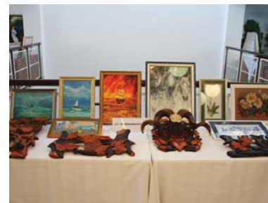
База відпочинку «Карпати» перетворилася на справжній музей