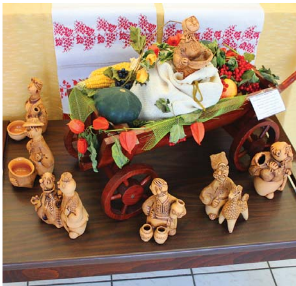
Експонат-учасник конкурсу в номінації «Різьблення по дереву»

З 2 по 5 жовтня на базі відпочинку «Карпати» у м. Яремче Івано-Франківської області пройшов III фестиваль-конкурс художньої самодіяльності творчості працівників нафтової і газової промисловості України, присвячений 35-річчю створення профспілки. Організаторами заходу вкотре стали НАК «Нафтогаз України» і Центральна рада профспілки працівників нафтової і газової промисловості України.