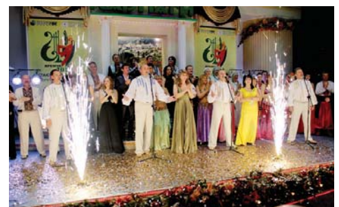
Урочистості завершилися святковим гала-концертом