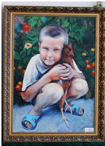
Творча робота у номінації «Малюнок»