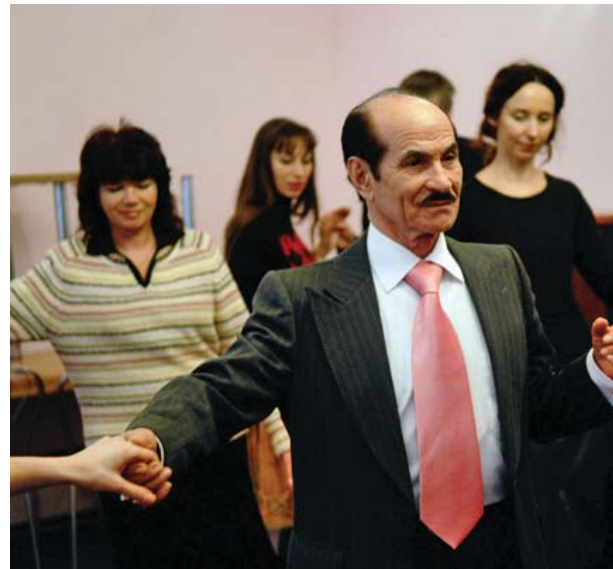
Учасники акції «Стоп інсульт-2012» мали нагоду взяти участь у безкоштовному майстер-класі від