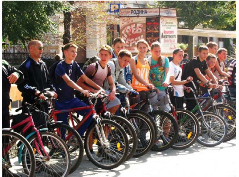
«Що таке красиво жити? Це, на мій погляд, означає рухатися. Не хочете танцювати – бігайте, стрибайте. Зробіть щось зі своїм тілом, не лежіть на дивані!» (Г. Чапкіс)

Експерти наполягають: запобігти цій страшній хворобі набагато легше й вигідніше, аніж займатися її лікуванням. Навіть один напад інсульту може обернутися у кращому випадку інвалідністю. Тож організатори акції розраховують «достукатися» до кожного, хто перебуває у групі ризику. Принцип дуже простий: якщо людина знає, що у неї хронічна гіпертензія, а малорухливий спосіб життя та шкідливі звички через рік-два можуть обернутися повним або частковим паралічем, вона серйозно замислиться над своїм здоров'ям. Зайнятися спортом, кинути палити й вести здоровий спосіб життя під силу кожному. Адже ліки, навіть найвищої якості, додають 2–3 роки життя, тоді як здоровий спосіб життя – 10–15 років. Головне, стверджують ініціатори всеукраїнської акції «Стоп інсульт», проінформувати максимальну кількість людей про заходи, які допоможуть уберегти людину від інсульту, а отже, – уникнути катастрофи. Медики запевняють, що запобігти інсульту досить просто – треба стежити за артеріальним тиском, обмежити вживання жирної їжі та більше рухатися.