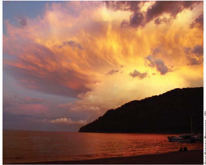
Захід сонця на узбережжі Чорного моря