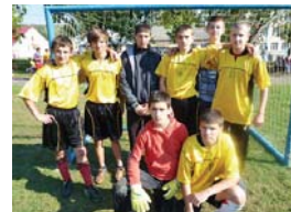
Футболісти Нижніх Воріт – чемпіони спартакіади

Майже чверть століття з року в рік у Закарпатті проводиться спартакіада шкіл-інтернатів. Цьогоріч за доброю традицією захід відбувся на спортивній базі Перечинської школи-інтернату, а її організаторами виступили управління освіти і науки та у справах молоді та спорту облдержадміністрації, а також обласна рада ФСТ «Україна».