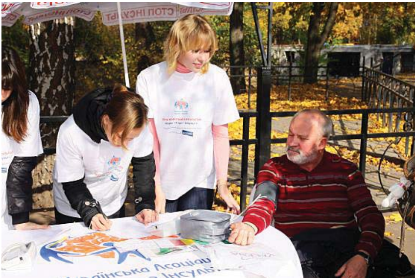
Понад 11 мільйонів співвітчизників страждають від підвищеного артеріального тиску