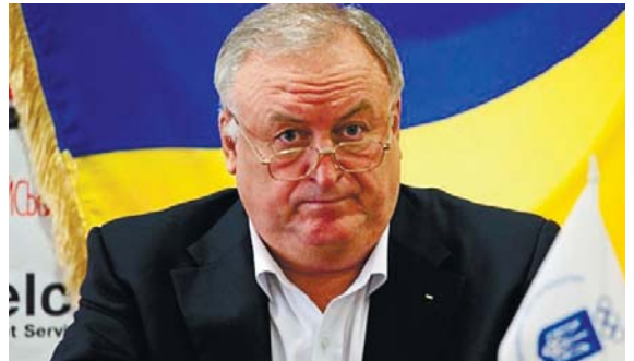
Валерій Борзов спростує усі звинувачення на свою адресу

Як уже інформували «ПВ», у Держмолодспорті триває робота комісії з перевірки фактів порушень, вчинених посадовими особами штатних збірних команд України під час проведення навчально-тренувальних зборів і змагань з легкої атлетики.