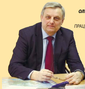
ОЛЕКСІЙ РОМАНЮК, ГОЛОВА ЦК ПРОФСПІЛКИ ПРАЦІВНИКІВ ЖИТЛОВО- КОМУНАЛЬНОГО ГОСПОДАРСТВА, МІСЦЕВОЇ ПРОМИСЛОВОСТІ, ПОБУТОВОГО ОБСЛУГОВУВАННЯ НАСЕЛЕННЯ УКРАЇНИ

І не треба нервувати... Не ведіть себе, як «жмот», Бо підуть чулки в колективі, Що «накинули» п'ятьсот!