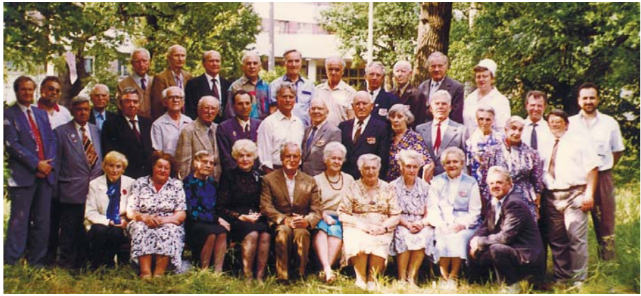
Санаторій «Жовтень». Зустріч ветеранів