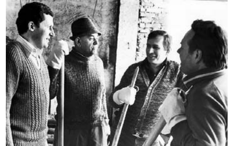
Суботник. Санаторій «Жовтень». 1984 рік

– Ще б пак! Узагалі Чорнобиль – це особливий період, профспілки – у перших лавах! Хоча потім нас і розпинали на хресті деякі