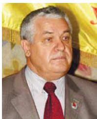
ПЕТРО СТЕПАНОВИЧ ЦИБЕНКО, ГОЛОВА РАДИ ОРГАНІЗАЦІЇ ВETERAНИВ УКРАЇНИ

Старі кадри... Стара гвардія... Ці поняття існують давно. І несуть в собі позитивний сенс. Так зазвичай характеризують професіоналів високого класу, за плечима яких величезна школа життя. Саме до їх числа належать наші герої – сильні люди, які багато років віддали профспілковій ниві. Люди, які навіть на пенсії не втомлюються перебувати в гушці подій, що відбуваються в державі, воювати з несправедливістю і беззаконням, відгукуватися на все неординарне, не зраджуючи собі у власних судженнях і вчинках.