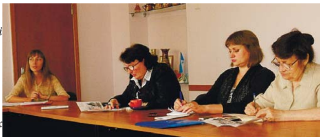
Чергове заняття громадського Університету правових знань на Миколаївщині

Традиційними стали заняття, вперше організовані ще у 2008 році Миколаївською обласною радою профспілок та відділенням Національної служби посередництва і примирення в Миколаївській області, громадського Університету правових знань. Так, 13 вересня відбулося дев'ятнадцяте заняття на тему: «Зелений офіс» як антикризовий захід: вивода для бізнесу з турботою про довкілля та без утиску працівників». На занятті обговорювалася концепція «зеленої економіки» та її складова – ідея «зеленого офісу», що поступово стає міжнародним трендом і все більш актуальною для України.