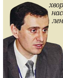
ВІКТОР ЛЯШКО, НАЧАЛЬНИК ВІДДІЛУ ОРГАНІЗАЦІЇ ДЕРЖАВНОЇ СЕС УКРАЇНИ

« Стихійна торгівля загрожує епідемічному благополуччю населення. Осередки стихійної торгівлі функціонують майже в усіх місцях, де є великий потік людей. Така торгівля розрахована на тих, хто повертається з роботи і хоче купити щось перекусити або просто зараз придбати якісь продукти і швиденько вдома приготувати. Продукція зі стихійних ринків не проходить санітарно-епідеміологічну експертизу, відтак СЕС не несе відповідальності за наслідки вживання таких продуктів. Уживаючи їх, людина наражається на ризик виникнення гострих інфекційних кишкових хвороб, як-от дизентерія, сальмонельоз, гепатит А. Щодо статистики захворювань у 2011 році, то на гострі кишкові інфекції зі встановленими збудниками переохворіло майже 64 тисячі населення, із невстановленими – іще 32 тисячі.