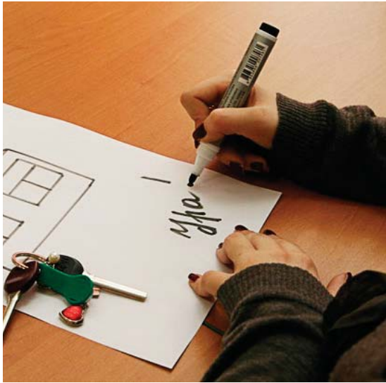
Якщо півтори сотні угод на отримання пільгових іпотечних кредитів на будівництво житла