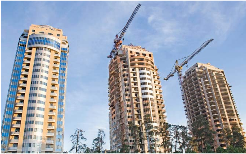
І хоча будинки ростуть, як гриби після дощу, черга на отримання житла не стає меншою