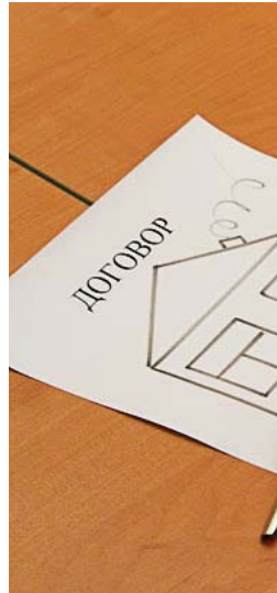
Укладено вже близ

Щоб стати учасником державної програми «Доступне житло» і претендувати на дешеву позику, потрібно підготувати необхідні документи, серед яких, зокрема, копія паспорта та реєстраційного номера облікової картки платника податків; довідка про склад сім'ї; копія свідоцтва про шлюб; копія свідоцтва про народження дітей (за наявності); документи, які об'єктивно підтверджують, що позичальник потребує поліпшення житлових умов. Інакше кажучи, довідку про перебування на квартирному обліку. І головне – довідки про доходи як самого позичальника, так і членів його родини впродовж останніх шести місяців. Банк розглядатиме тільки повний пакет документів.