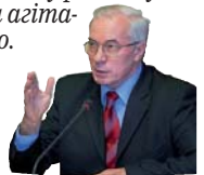
Микола Азаров, Прем'єр-міністр України

Нині квартири, що підпадають під параметри програми, становлять у багатопверхівці від 10 до 25%. Якщо не продано решту, то де гарантії, що будинок буде введено в експлуатацію, що люди отримають квартиру в строки, визначені угодою? Такі гарантії слід забезпечити. Треба передумовно працювати з кожним забудовником, на кожному об'єкті. Тисячі вчасно отриманих за програмою квартир замінять будь-яку рекламу та агітацію.