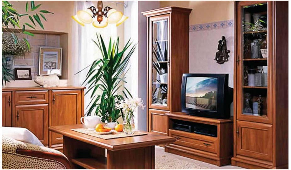
Сім'я з двох осіб може отримати квартиру площею не більш як 76 кв. м