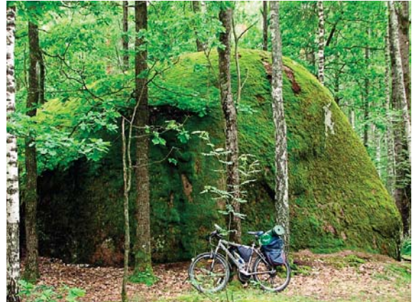
Ідеться про урочище Кам'яне Село – дивовижну природну пам'ятку, геологічний заказник державного значення. Лише віднедавна урочищем зацікавилися туристи й представники засобів масової інформації.

Ця місцина, що загубилася серед лісів Житомирщини неподалік Олевська, справді є загадковою. Передусім досі не розкрито таємницю її походження, а також здатність ставати ніби невидимою для топографа й легко з'являтися знову – на радість місцевим та приїжджим шанувальникам усього природного, але незрозумілого. А також на радість тим, хто фіксує чуда української землі.