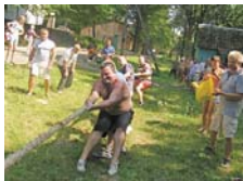
Визначається переможець у перетягуванні каната

Одна з них – обласна спартакіада державних службовців, засновником якої разом із Закарпатською обласною державною адміністрацією та обласною радою є галузевої обком профспілки. За підсумками цьогорічної спартакіади, яка проводилася у два етапи, переможці – держслужбовці Міжгірського району отримали матеріальну винагороду обкому профспілки працівників держустанов.