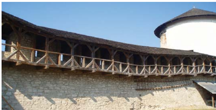
Фрагмент галереї, яка слугувала для переміщення воїнів

Для відвідувачів проводяться цікаві екскурсії, під час яких можна дізнатися про легенди замку, почути різноманітні історії, пов'язані з його власниками та мешканцями. Аби відчутти дух стародавніх часів, гості мають змогу поїздити на конях, узяти участь у змаганнях на кращого лучника, стрільючи, звісно що, зі справжнього лука чи арбалета. В музеї працюють гончарі, майстри-кушніри, які для всіх охочих проводять майстер-класи. А на згадку про Стару фортецю кожен може власноруч викарбувати пам'ятну монету чи придбати різноманітні сувеніри.