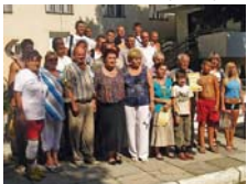
Переможці спартакіади – спортсмени Хустського райкому профспілки