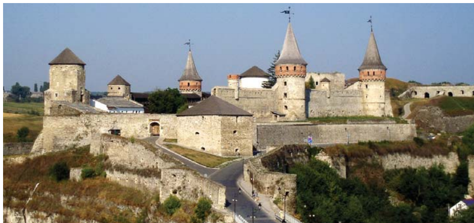
Стара фортеця – пам'ятка архітектури XII–XVIII століть

Неповторним ансамблем архітектури, над створенням якого трудилися митці-зодчі й військові інженери, зачаровує численних відвідувачів Кам'янець-Подільський. Тут поєдналися східний і західний стилі, а дзвіниці православних та католицьких храмів, мінарети стоять поруч. Ліва притока Дністра – річка Смотрич, що протікає у глибокому 40-метровому яру, оперізує скелясте плато, на якому розкинулося давнє місто з його головним форпостом – Старою фортецею.