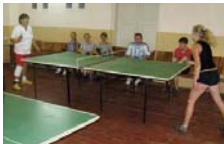
За тенісним столом грали краці

У Закарпатському обкомі профспілки працівників держустанов залучення спілчан до масових занять фізичною культурою і спортом вважають одним із головних пріоритетів у своїй роботі. А щоб теорію, так би мовити, втілити на практиці, у галузі впродовж року двічі проводять спартакіади.