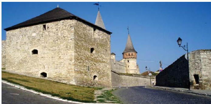
Чорна башта бачила чимало битв, її не раз реставрували

Як свідчать літописи, у XIV–XVII століттях повз місто пролягав шлях татар, які кочували в причорноморських степах. Тож аби посилити оборону міст, зводилися нові замки й фортеці. І Старе місто будували так, щоб підступи до нього захищали природні перешкоди.