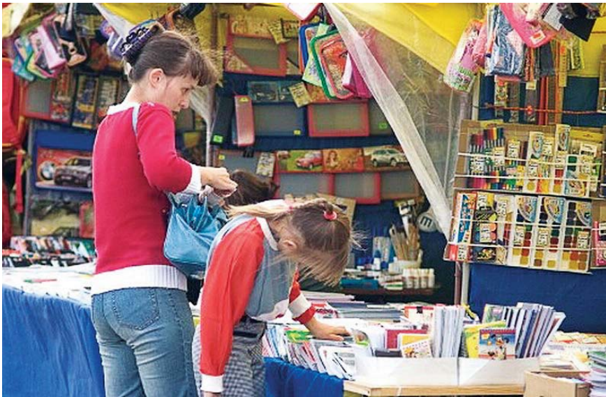
Порівняно з минулорічними витратами, нинішнього серпня доведеться викласти за спорядження школяра на 20 відсотків більше