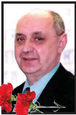
ФЕДЕРАЦІЯ ПРОФСПІЛОК УКРАЇНИ

Світла пам'ять про нього назавжди залишиться у наших серцях.