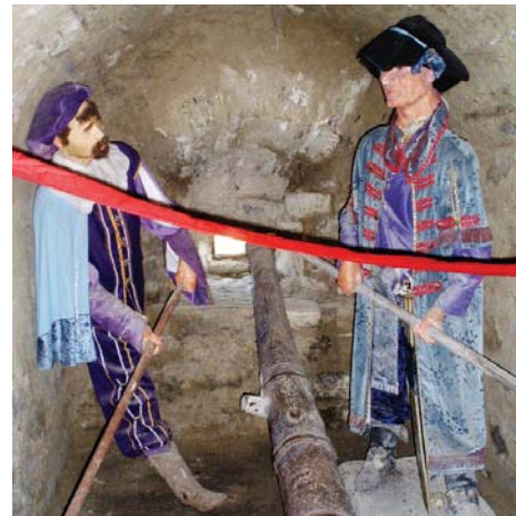
Експозиція з макетами воїнів зображує героїчне минуле фортеці

перекриті склепіннями. У центрі споруди був великий двір, до якого примикали приміщення військового призначення (казарми, склади). Зі Старим Новим замком з'єднувався підйомним мостом.