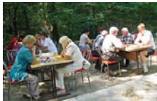
Змагання з шашок