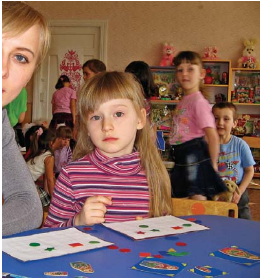
Готуватися до школи, звісно, краще у спеціальних клубах чи центрах розвитку дитини