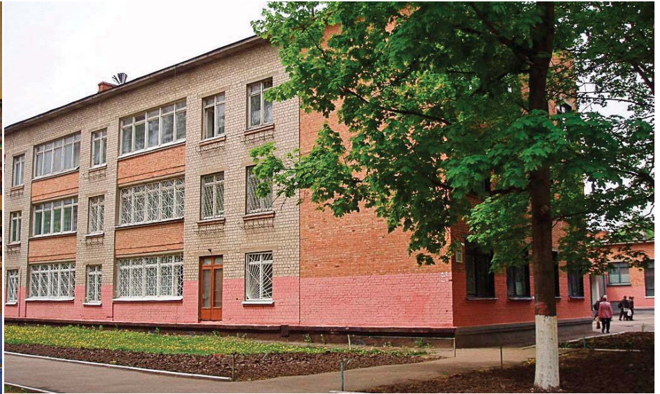
Міністр освіти, молоді та спорту запевнив, що загалом українські школи до 1 вересня готові