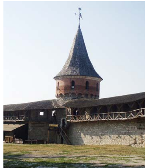
Башта Тенчинська належить до найдавніших споруд Старого замку

У XVI столітті було збудовано комплекс оборонних споруд, які дістали назву Новий замок. Укріплення включало рови, вали й підземні кам'яні приміщення,