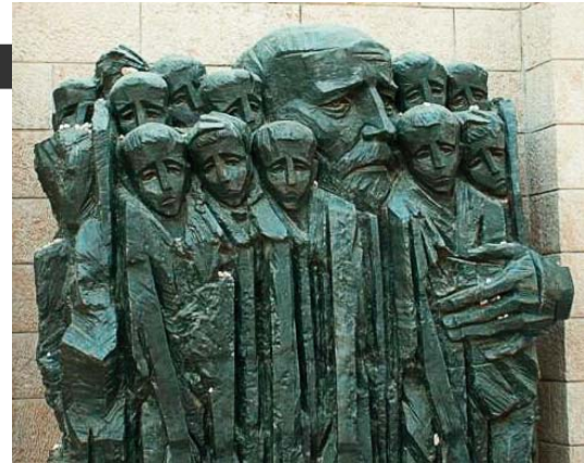
Пам'ятник Янушу Корчаку з дітьми в Єрусалимі

Сімдесят років тому, 5 серпня 1942 року, у газовій камері концтабору Треблінка загинули двісті сиріт, а разом із ними – Старий Лікар, непересічний психолог і письменник-педагог Януш Корчак (Генрік Гольдшміт). Людина, яка не лише своїми книгами, а й власними життям та смертю начисто довела, що означає любити й розуміти дітей НАСПРАВДІ.