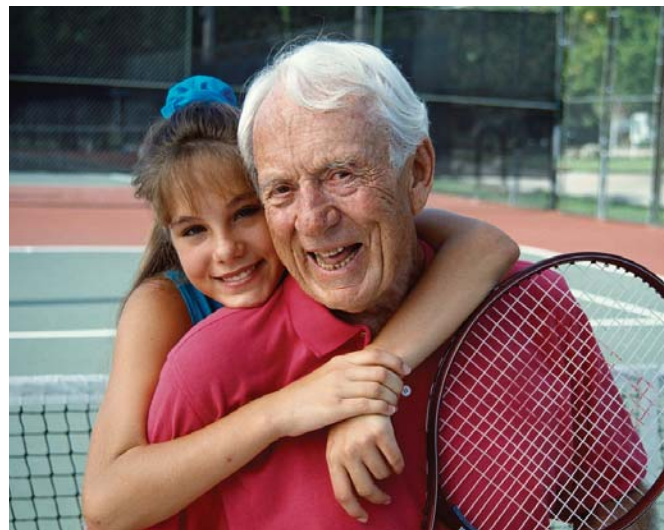
Важко переоцінити позитивний вплив від спілкування з онуками