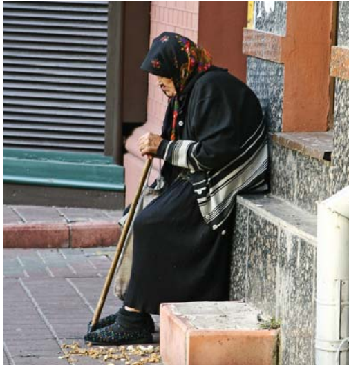
Непоодинокі випадки, коли стареньких просто виганяють на вулицю