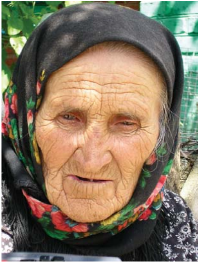
Усі мріють жити довго, але ніхто не хоче бути старим...