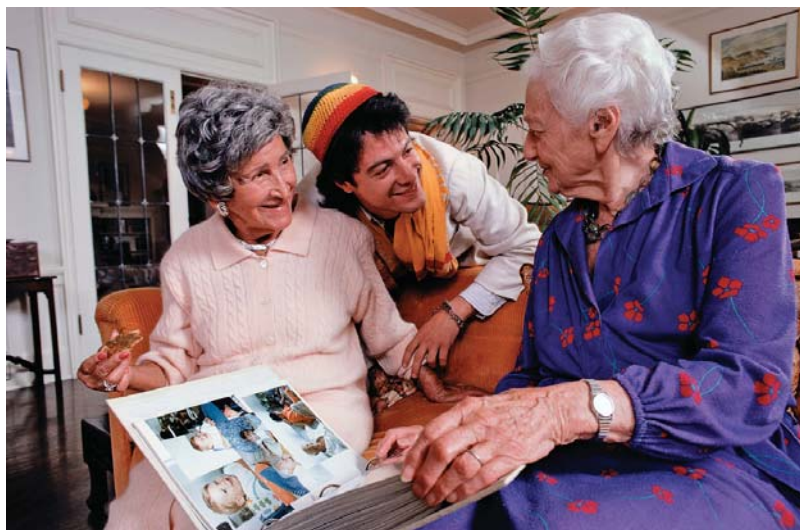
У Європі поширена система домашньої опіки над літніми людьми: моральний чинник превалює над економічним