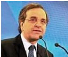
Прем'єр-міністр Греції Антоні Самарс заявив про наміри уряду запровадити програму

примусового звільнення «до резерву» державних службовців, які досягли передпенсійного віку. У свою чергу, профспілка державних службовців Греції попередила, що у такому разі держслужбовці проведуть низку загальнонаціональних страйків, аби захистити своє право на працю, гарантоване конституцією.