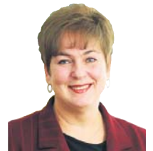
Елла Лібанова, директор Інституту демографії та соціальних досліджень імені М. Птухи НАН України

Безпритульних не так багато, як здається. Часто люди отинаються на вулиці не з власної вини. В нашій країні дуже низький рівень правової культури. Може бути так, що людину обдурили, забравши в неї житло, тоді вона прагне одного: знайти роботу і житло. Всупереч стереотипам, безпритульні – це не лише маргінали й алкоголіки.