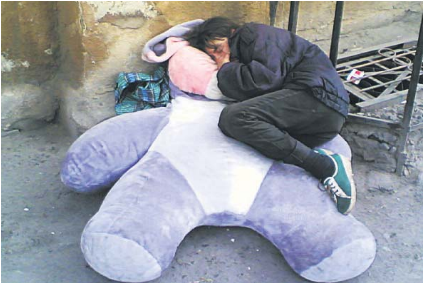
Цій дівчині просто поталанило знайти на смітнику таке розкішне місце для сну!