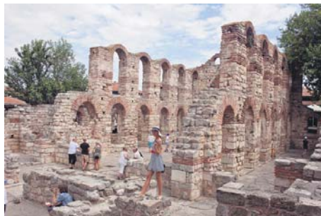
Руїни церкви св. Софії (кінець V – початок VI ст.)

фотографуються на тлі стародавньої споруди – церкви св. Софії (стара метрополія), що зовні нагадує колізей. Під час прогулянки містом милують око церкви св. Стефана, св. Іоанна Хрестителя, св. Архангелів Михаїла та Гавриїла, Христа Пантократора, св. Параскеви. А загалом у Несебрі налічується близько 42 церков. І хоч не всі вони збереглися донині, та навіть їхні руїни вражають нашу уяву.