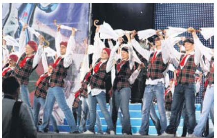
Артисти вітають спортсменів

ПІДГОТУВАВ ВОЛОДИМИР ПОЛЕТАЄВ, СПЕЦІАЛЬНО ДЛЯ «ПВ»