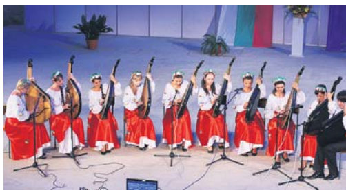
Виступ українських бандуристок на дитячому міжнародному фестивалі у Созополі