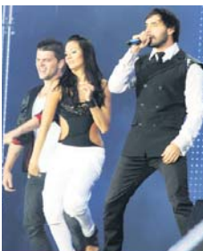
Співає Віталій Козловський