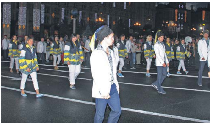
Урочиста хода української збірної вечірнім Хрещатиком