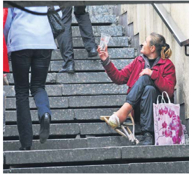
Поспішаючи у своїх справах, мало хто звертає увагу на таких людей. А вже щоб підійти і погов...