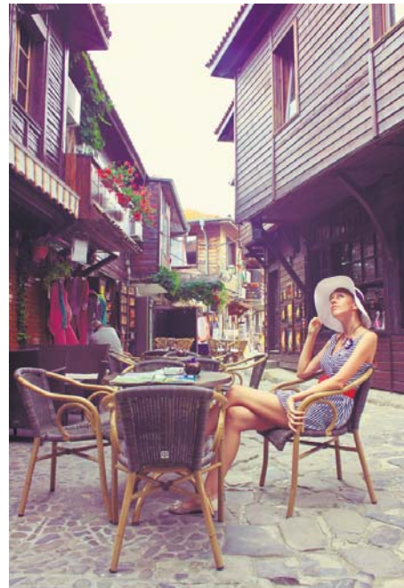
Затишна кав'ярня на старовинній вулиці

Одне з найцікавіших і найбільш відвідуваних міст Болгарії – невелике місто Несебр. Стара його частина розташована на скелястому півострові, що з'єднується із сушею вузьким перешийком завдовжки близько 400 м. Несебр вважається одним із найстаріших міст Європи, адже його було засновано понад три тисячі років тому. У 1956 році він дістав статус міста-музея, а 1983-го Несебр було включено до списку об'єктів світової спадщини ЮНЕСКО. Місто є побратимом центрального району м. Сочі, що у Росії, та іспанського міста Віго.