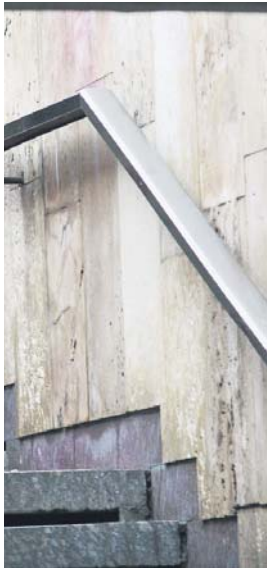
ворити, а може, й допомогти – то вже за!