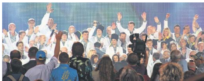
«В добру путь, олімпійці! Повертайтеся з медалями!»