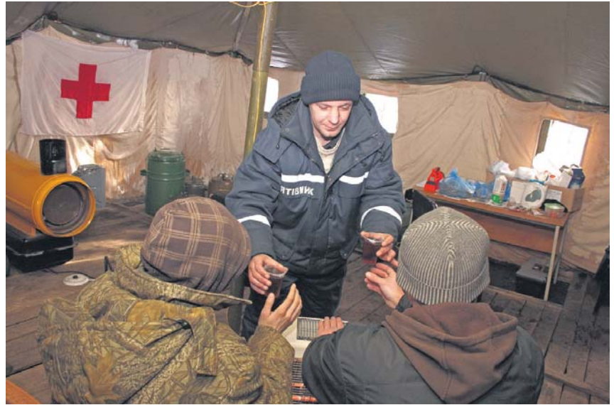
Нинішньої суворі зими МНС організувало пункти обігріву безпритульних. Мабуть, багатьох це врятувало від загибелі

Чим займаються безхатченки вдень? На життя більшість їх заробляє, збираючи вторинну сировину (52%). Серед інших джерел заробітку респонденти називають будівництво та вантажні роботи – 27%, жебракування – 10,5%, пенсійні кошти – 11%. Практично 70% безпритульних постійно шукають поживи в баках для сміття, 12% зважуються на крадіжки їжі в перехожих.