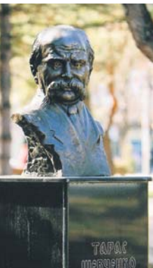
«Кобзар у Македонії». Пам'ятник поету і художнику, академіку Тарасу Шевченку (м. Скоп'є, Республіка Македонія)

Із благословення Предстоятеля Української православної церкви Блаженнішого Митрополита Київського і всієї України Володимира відомий журналіст-мандрівник Микола Хрієнко здійснив три етапи проекту «Українці за Уралом» та успішно презентував його як фотовиставку в балканських країнах.