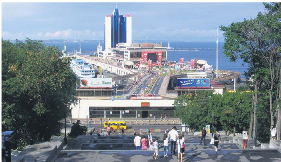
Потьомкінські сходи ведуть до Морського вокзалу та відкривають чудову панораму морських просторів

Гуляючи містом, не можна оминати славнозвісні Потьомкінські сходи, що налічують 192 сходинки (відкрию невеличку таємницю: вниз усі спускаються сходами, одначе повертаються фунікулером). Їх збудував граф Воронцов, генерал-губернатор Ново-