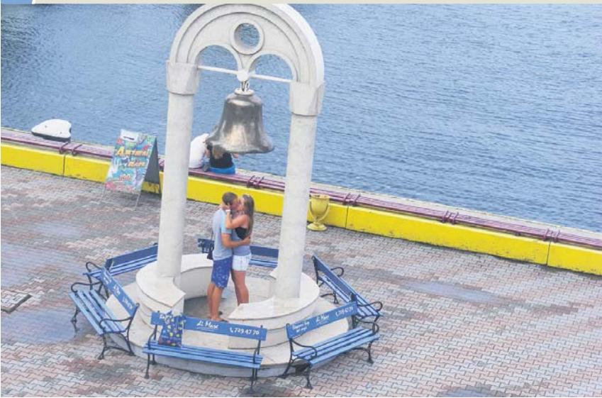
ДЗВІН КОХАННЯ. ОДЕСА