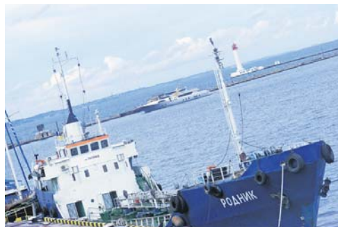
«Море – це вічний рух і любов, вічне життя...» (Жюль Верн)