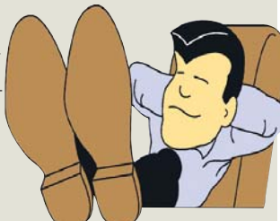
«Яке законодавство, які там профспілки? Я сам собі і право, і закон!»

ДЕПАРТАМЕНТ ВИРОБНИЧОЇ ПОЛІТИКИ ТА КОЛЕКТИВНО-ДОГОВІРНОГО РЕГУЛЮВАННЯ ФПУ