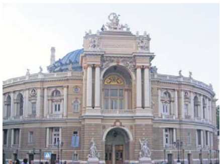
Візитівка міста – оперний театр