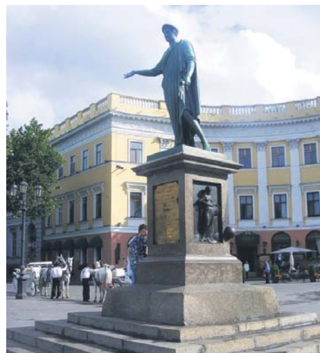
Пам'ятник Дюку де Рішельє на Французькому бульварі

Море, жарти, відпочинок, витончена архітектура – такою на перший погляд постає перед туристами та відпочивальниками Одеса. Однак, аби реїнятися справжнім її духом, достатньо трохи віддалитися від центра міста – прогулятися старими вулицями, зазирнути у напівзруйновані дворики (в них живуть люди!) із завішаними випраною білизною проходами, почути сварки типової одеської єврейки Рози, що чуються з вікон, побачити чоловіків, що грають у доміно просто посеред тротуару, насолодитися звуками акордеона, що лунають із підземного переходу, тощо. Такою є справжня Одеса – місто, що простяглося уздовж берега Чорного моря, місто-порт, місто гумору, місто Соньки Золотої Ручки... Одеський колорит важко передати словами, його треба відчутти!