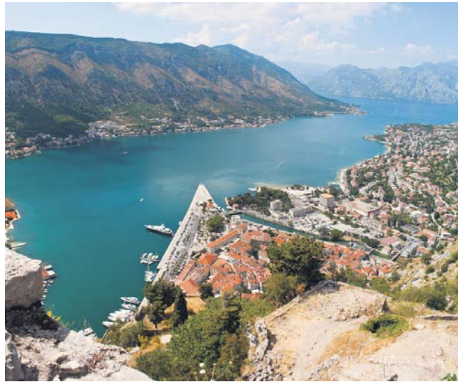
Панорама міста Котор з фортеці, Чорногорія