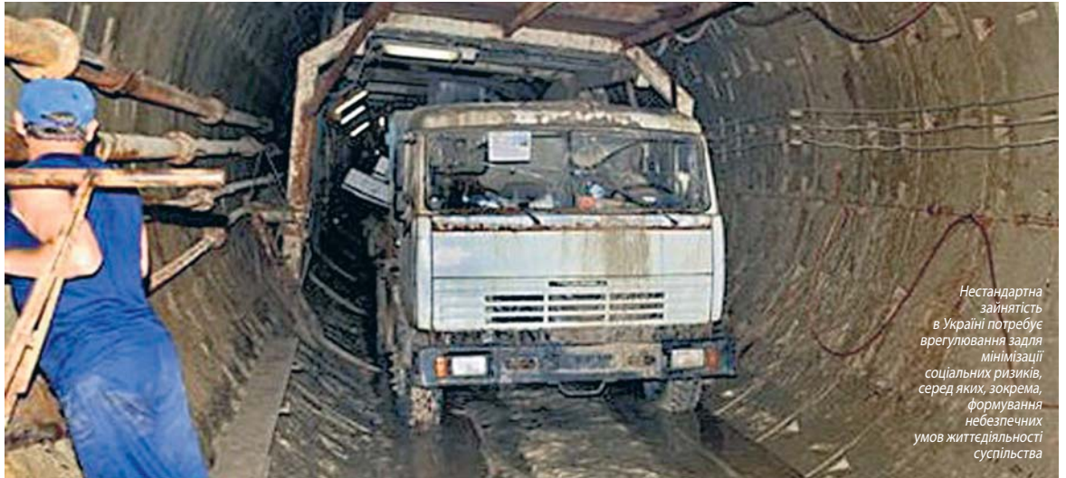
Нестандартна зайнятість в Україні потребує врегулювання задля мінімізації соціальних ризиків, серед яких, зокрема, формування небезпечних умов життєдіяльності суспільства

Найпоширенішою формою прихованих трудових відносин в Україні є підміна трудових відносин цивільними. Також для маскування трудових відносин роботодавці часто використовують