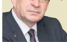
(ІЗ ВИСТУПУ ГОЛОВИ ФПУ ЮРІЯ КУЛИКА НА ЗАСІДАННІ 101-І СЕСІЇ МІЖНАРОДНОЇ КОНФЕРЕНЦІЇ ПРАЦІ 8 ЧЕРВНЯ Ц. Р.)

“ Ми розраховуємо на розуміння необхідності просування вперед шляхом розвитку соціального діалогу в сфері зайнятості населення безпосередньо через забезпечення права кожного на вільно обрану зайнятість. Профспілки мають право очікувати від політики підтримки своєї позиції щодо заборони запозиченої праці та деяких інших крайніх форм нетипової зайнятості, які можуть звести нанівець усі соціальні досягнення.