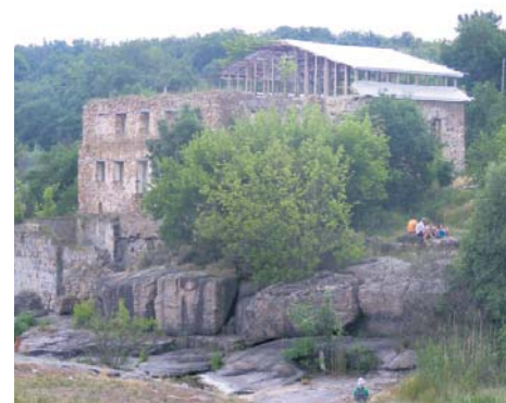
Буцький каньйон – улюблене місце відпочинку не лише місцевих жителів, а й українців із різних куточків нашої країни