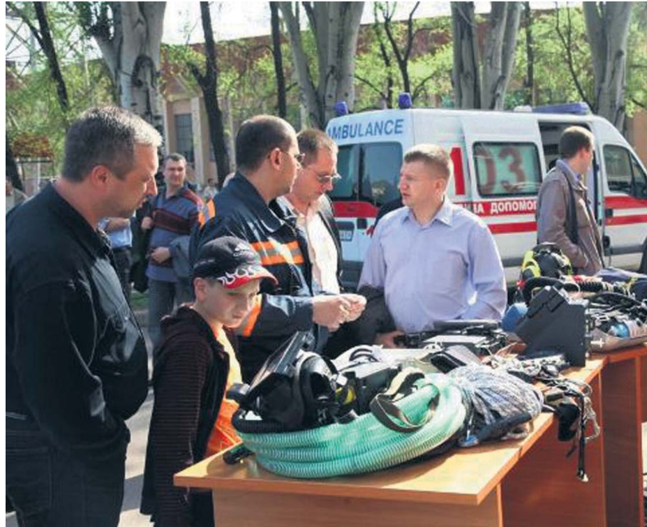
Усі повинні вміти користуватися