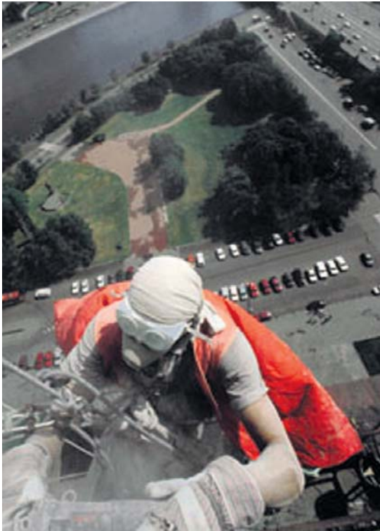
Насамперед – безпека