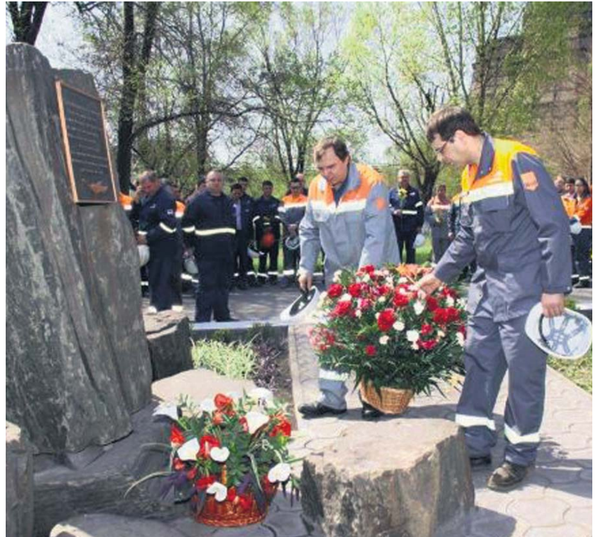
Ушанування загиблих на виробництві

За даними Держгірпромнагляду України, в 2011 році загальна кількість нещасних випадків, пов'язаних із виробництвом, порівняно з минулим роком зменшилася на 1041 випадок, або на 9% (на підприємствах України 2011-го травмовано 10 657 осіб, у 2010-му – 11 698 осіб), а кількість смертельних травм, пов'язаних із виробництвом, збільшилася на 41 випадок, або на 6% (на підприємствах України в 2011 році смертельно травмовано 685 осіб, у 2010-му – 644 особи). Такий стан справ потребує посилення уваги державних органів та об'єднань роботодавців до проблеми охорони праці, проведення громадського контролю професійних спілок за дотриманням законодавства щодо цього питання. Нагадаємо, Федерація профспілок України, її членські організації, первинки на підприємствах постійно домагаються виконання законодавчих гарантій безпечної праці, вимог щодо належної охорони праці на робочих місцях. Зокрема, технічна інспекція праці завжди захищає законні права працівників. Тож це питання для профспілок – один з основних напрямів діяльності.