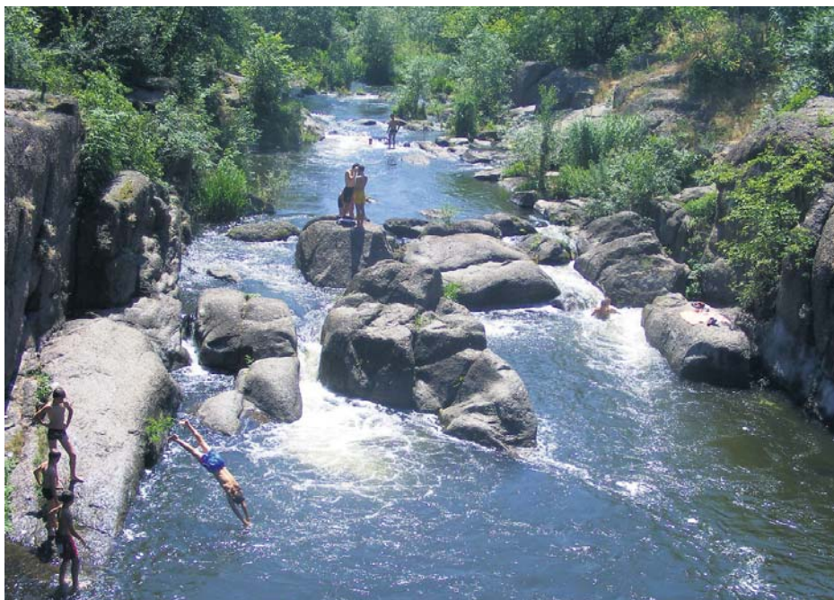
Руїни на березі ані трохи не псують тутешні краєвиди

Річка Гірський Тікич тече в протерозойських гранітах, вік яких – близько двох 2 млрд років, і утворює глибокий (до 20 м) і вузький (місцями 20–40 м) каньйон, один із виступів якого названий на честь відомого українського геолога-