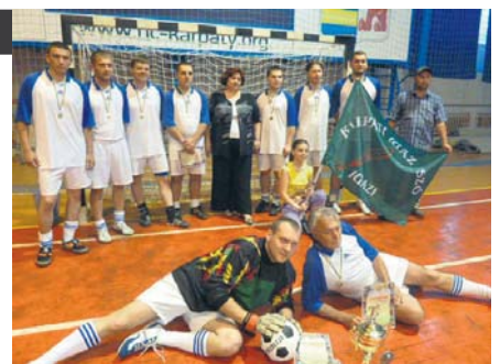
Команда газети «Карпаті і газ Со» — переможець турніру

ремогу в турнірі святкує команда газети «Карпаті і газ Со», який і дістався перехідний кубок організаторів. На другу сходинку п'єдесталу пошани зійшли футболісти спортивного видання краю, третіми виявилися представники відділення журналістики філологічного факультету Ужгородського національного університету.