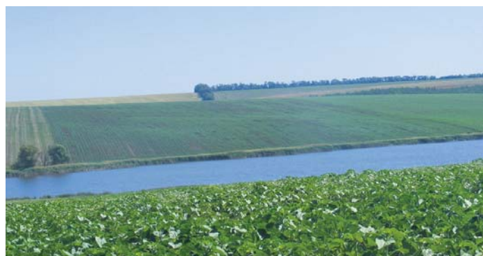
Широкі поля, ріки, блакить неба – краса України чарує...