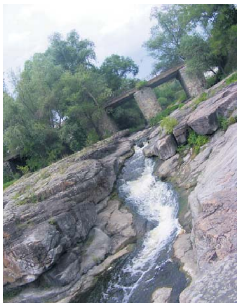
Водоспад Вир у той день був на диво спокійний. Однак, коли річка наповнюється дощовими водами – він вирує з неймовірною силою

С келястий каньйон на річці Гірський Тікич біля села Буки (Маньківський район Черкаської області) – одне з найкрасивіших місць на Україні. Сам каньйон невеликий, близько трьох кілометрів завдовжки. Місцеві жителі називають його Карпатами серед Черкащини, а ще – маленькою Швейцарією.