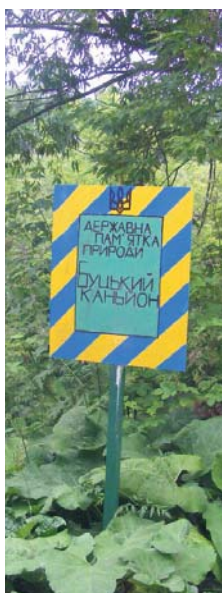
У травні 1975 року цьому об'єкту було присвоєно статус державної комплексної пам'ятки природи місцевого значення