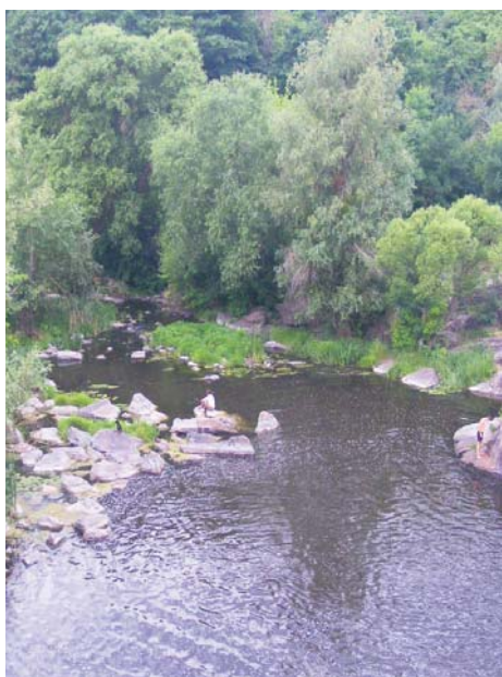
Річка Гірський Тікич у поєднанні з навколишньою природою – чудове місце для релаксу