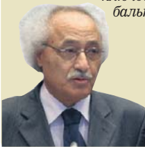
МОХАМЕД БАБЕС, ПРЕЗИДЕНТ МІЖНАРОДНОЇ АСОЦІАЦІЇ СОЦІАЛЬНО-ЕКОНОМІЧНИХ РАД І ПОДІБНИХ ІНСТИТУЦІЙ

“ Асамблея відбувається у дуже важливий період, адже приймаються рішення, що визначатимуть шлях розвитку людства у найближчі десятиліття. МАСЕРПІ як важливий інструмент вираження поглядів глобального громадянського суспільства не повинна стояти осторонь цих процесів, а навпаки, стати їх суб'єктом і робити внесок у прийняття рішень багатосторонніми установами, які займаються ключовими питаннями глобального розвитку.