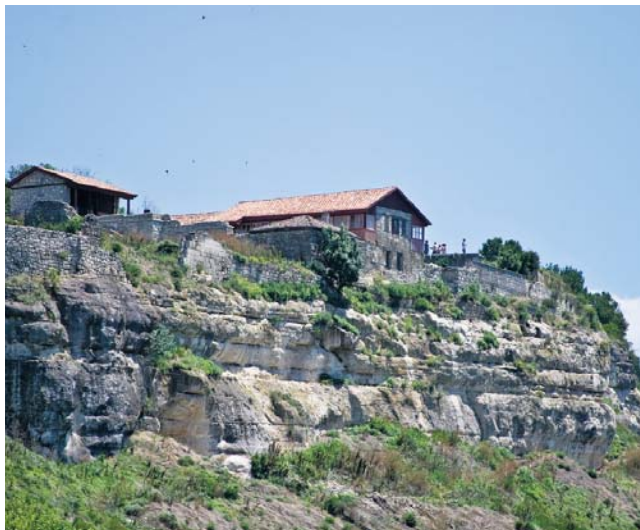
Крим. Форос.