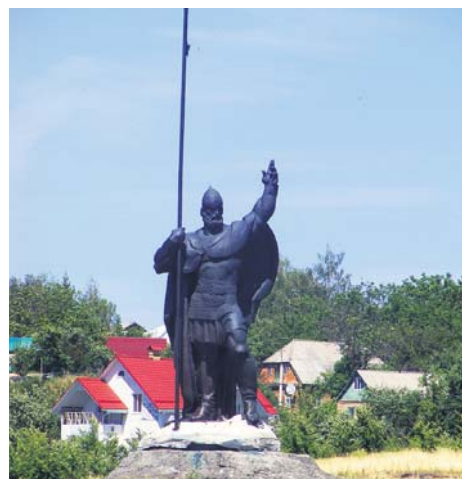
На березі Росі гостей міста зустрічає воїн