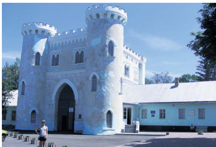
В'їзна брама в стилі середньовічних замків