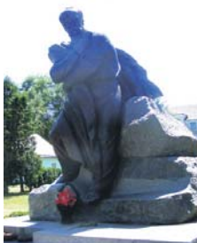
Т. Г. Шевченко любив гуляти парком і перебував у одній із тутешніх будівель під час свого приїзду