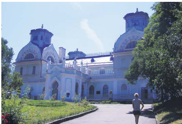
Таким зберігся палац Лопухіних