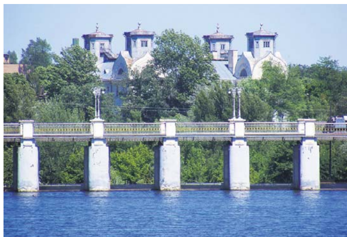
Палац Лопухіних видно ще при в'їзді до міста