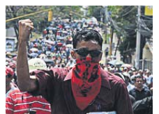
бітну плату впродовж кількох місяців.

взявши участь у масових акціях протесту. За словами організаторів акції, уряд країни не виконав зобов'язання перед учителями і не виплатив усі належні їм гроші. Тим часом близько 9500 педагогів не отримували заро-