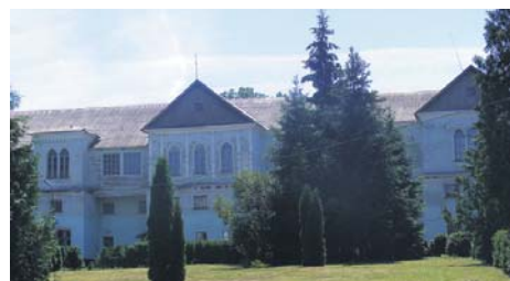
Одна із споруд палацового ансамблю