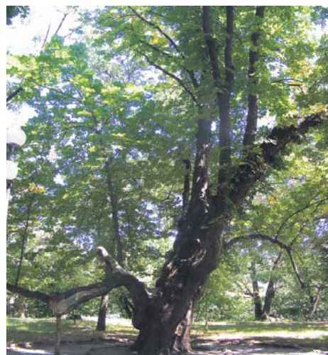
За легендою, саме під цим каштаном, подорожуючи Україною у 1859 році, полюбував малювати і писати вірші Т. Г. Шевченко