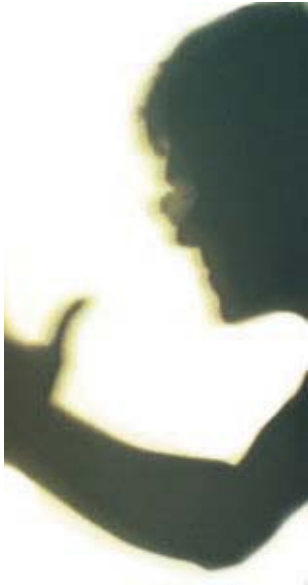
Якими можуть бути наслідки такого «виховання»