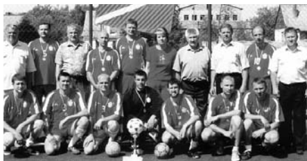
Організатори змагань разом із переможцем турніру командою «Медик» (Дубно)