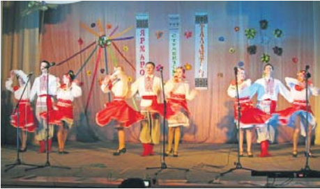
На сцені – ансамбль танцю Рівненського базового медичного коледжу

Фестиваль аматорського мистецтва «Студентська весна-2012» серед колективів медичних навчальних закладів Рівненської області, що відбувся 17 травня в Костопільському районному будинку культури, проводився з метою виявлення та популяризації кращих виконавців у різних жанрах мистецтва серед студентської молоді, активізації їх творчого потенціалу, підтримки талановитих.