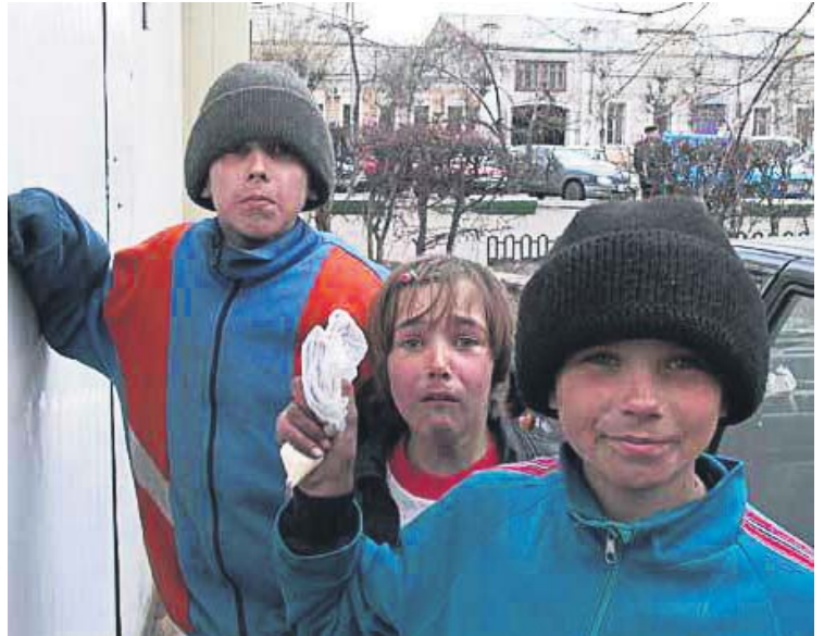
Діти, втіваючи від насильства з боку батьків, місяцями, а то й роками живуть просто на вулиці

Однак проблем вистачає. Найголовніша й найбільочіша – в Україні багато дітей-злидарів. Серед неврегульованих державою питань – недостатній обсяг ресурсів на підтримку соціально вразливих родин та дітей. ЮНІСЕФ непокоїть той факт, що за межею бідності перебуває кожна четверта сім'я з однією дитиною, 40% родин з двома дітьми і три чверті багатодітних сімей. За оцінками ЮНІСЕФ, в Україні близько 100 тис. дітей живуть або значну частину часу проводять на вулиці. Вживання ін'єкційних наркотиків та комерційний секс – не рідкість серед вуличної молоді, що наражає їх на такі хвороби, як сифіліс, гепатит, ВІЛ/СНІД та ін.