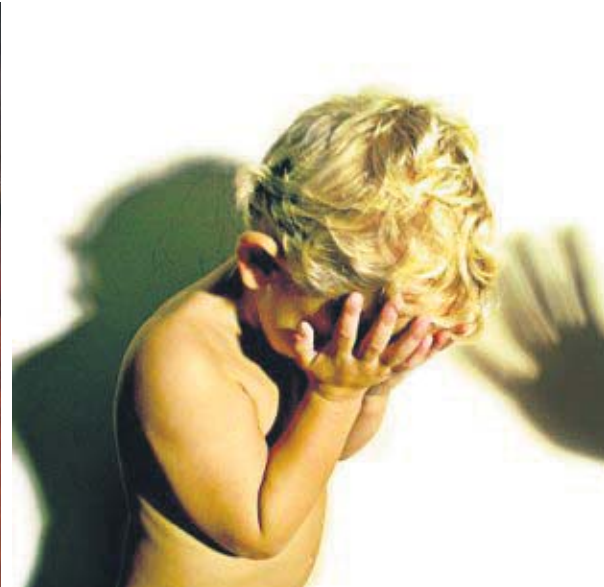
Коли розлючений батько кричить на свою дитину, він навіть не усвідомлює.