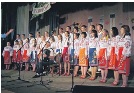
Виступає хоровий колектив Рокитнівського медичного училища