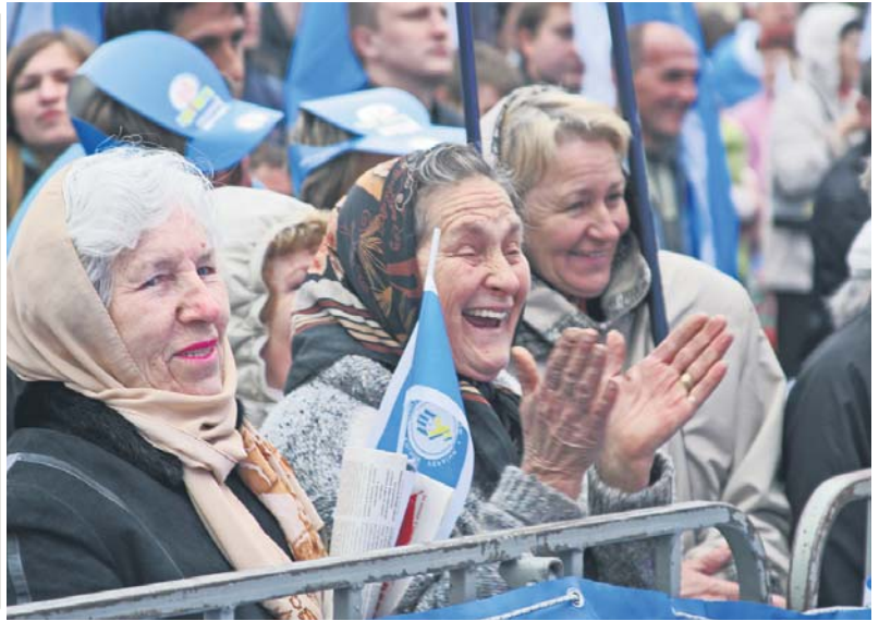
Старе нове свято: згадаймо молодість!

1 травня як національне свято праці відзначають багато країн. Це, зокрема, Австрія, Аргентина, Вірменія, Аруба, Бангладеш, Білорусь, Бельгія, Болгарія, Болівія, Боснія і Герцеговина, Бразилія, Угорщина, Венесуела, В'єтнам, Гватемала, Німеччина, Греція, Гондурас, Гонконг, Домініканська Республіка, Єгипет, Замбія, Зімбабве, Індія, Йорданія, Ірак, Ісландія, Іспанія, Італія, Камерун, Кенія, Китай, Колумбія, Коста-Ріка, Кот-д'Івуар, Куба, Латвія, Ліван, Литва, Люксембург, Маврикій, Малайзія, Мальта, Марокко, Мексика, Молдова, М'янма, Непал, Нігерія, Норвегія, Пакистан, Панама, Парагвай, Перу, Польща, Португалія, Республіка Гаїті, Республіка Кіпр, Республіка Македонія, Російська Федерація, Румунія, Сальвадор, Північна Корея, Сербія, Сінгапур, Сирія, Словаччина, Словенія, Таджикистан, Таїланд, Туреччина, Україна, Уругвай, Філіппіни, Фінляндія, Франція, Хорватія, Чилі, Чехія, Швеція, Шрі-Ланка, Еквадор, Естонія, ПАР, Південна Корея.