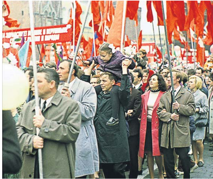
В епоху розвинутого соціалізму в СРСР першотравневі демонстрації перетворилися