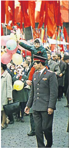
на формальні та обов'язкові заходи