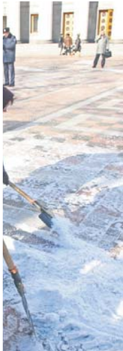
називати сильною статтю?