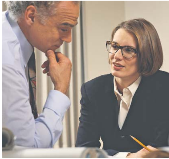
Жінки працюють на тих самих умовах, що й чоловіки, однак заробляють при цьому на третину менше