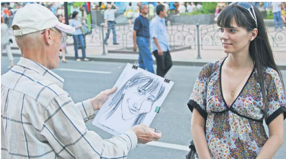
КРАСУ НІЧИМ НЕ ЗІПСУВАТИ!