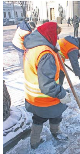
Кого ж ми маємо