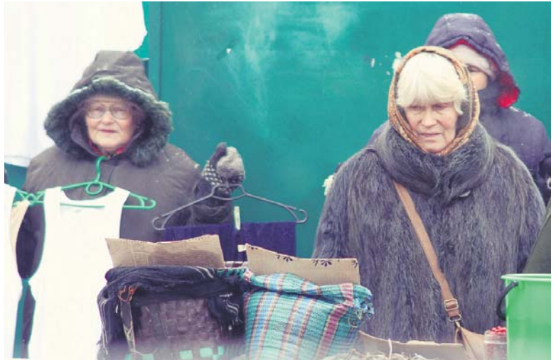
З економічної скрутою жінки вирішили боротися самотужки

Гендерні квоти – узаконений рівень представництва жінок і чоловіків в органах влади. Така практика поширена у багатьох розвинених країнах. Завдання квот полягає в тому, щоб жінки займали бодай критичну меншість у парламентах країни. У демократичних країнах цей показник становить від 30 до 40% місць. Така критична маса здатна суттєво впливати на політичні процеси та політичну культуру в цілому. Серед депутатського загалу нинішнього складу парламенту панує досить упереджене ставлення до гендерних квот. Жінки кажуть, що квоти мають затверджуватися на законодавчому рівні, хоча й не вірять, що вони не будуть порушуватися. Більшість депутатів-чоловіків вважає затвердження квот недоречним. Мовляв, розумні, яскраві особистості пройнуть до парламенту без будь-яких формальностей. Європейський і світовий досвід чоловіки не хочуть брати до уваги. А, між тим, 40 держав визначили й законодавчо закріпили норму – вносити жінок до виборчих списків. 50 держав залишили таке рішення за партіями, зобов'язавши їх дотримуватися паритету обох статей у числі кандидатів. Для України подібний крок – щось на зразок недосяжного.