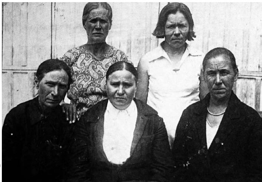
Члени місцевого комітету профспілки комунальниць

Несамовита більшовичка активно взаємодіяла й із катеринославськими профспілками, про що свідчать архівні документи. (При цьому їй, як, утім, й іншим відомим пропагандисткам фемінізму від нової влади – О. Коллонтай, І. Арманд, ніщо людське не було чужим: після загибелі під час теракту її чоловіка в 1918 році, на той час секретаря Московського міськкому партії В. Загорського, вона пов'язала своє життя з давнім прихильником – широким відомим молодим поетом-футуристом Василіском Гнедовим, творчим соратником В. Ма-