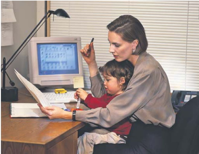
Часто «слабка» жінка є головною годувальницею родини. При цьому ризикую народжувати дітей і виховувати їх без підтримки з боку «сильної» статі