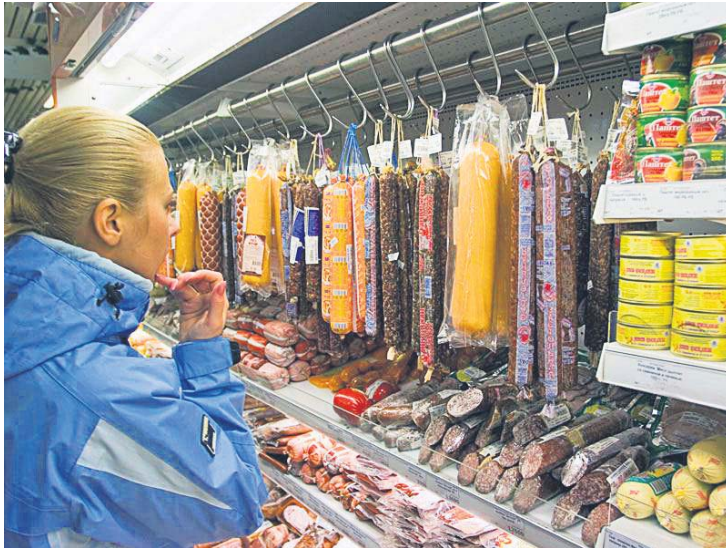
Яка ж тут ковбаса із м'яса?