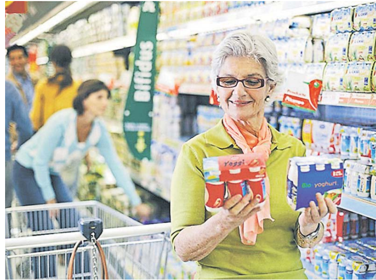
Купуючи продукти, слід уважно читати етикетки, особливо те, що написано дрібним шрифтом