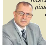
ЮРІЙ КУЛИК, ГОЛОВА ФЕДЕРАЦІЇ ПРОФЕСІЙНИХ СПІЛОК УКРАЇНИ

« Нам вдалося зупинити протистояння з органами державної влади та силовими структурами і перейти від конфронтації до партнерських стосунків та конструктивного діалогу. Це відкрило можливості для спільного напрацювання рішень, реалізації яких чекають від нас члени профспілок.