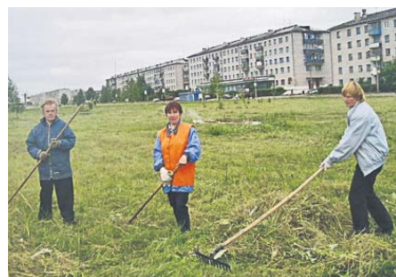
СТРОНКУ ПІДГОТУВАЛА ТЕТЯНА РУБАН, «ПВ»

від форми власності. Види оплачуваних громадських робіт визначаються виходячи з потреб територіальної громади, регіону і мають сприяти їх соціальному розвитку. Пріоритетними видами оплачуваних громадських робіт є упорядження меморіалів, пам'ятників, братських могил та інших місць поховання загиблих захисників Вітчизни, а також утримання в належному стані цвинтарів, особливо в сільській місцевості.