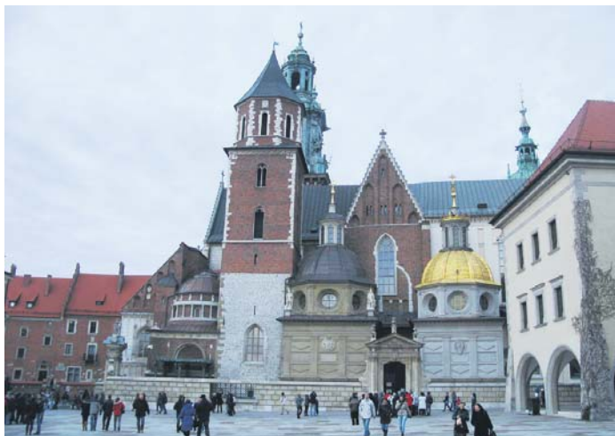
Коштул Станіслава та Вацлава на Вавельському пагорбі

РЕПОРТАЖ ПІДГОТУВАЛИ ВІКТОРІЯ ІВАНОВА ТА НАТАЛІЯ СТОРОЖИК КІІВ – КРАКІВ – КІІВ