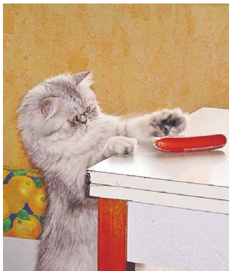
«Кота не обдурите: це не сосиска, це якийсь поліетилен фарширований!»