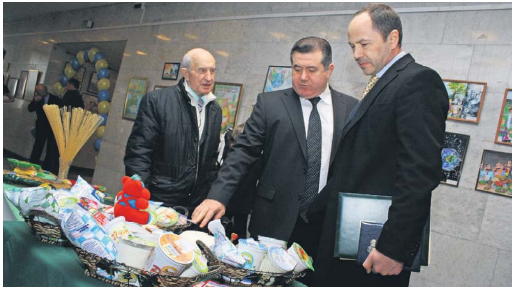
У рамках святкування було представлено зразки харчової продукції вітчизняних виробників, які взяли участь у патріотичній акції «З турботою про українське», тим самим засвідчивши прозорість своєї роботи та якість виробленої продукції

15 березня традиційно відзначається Всесвітній день прав споживача, який є святом солідарності споживачів та споживчих організацій в усьому світі. Цьогоріч до урочистостей з нагоди свята приєдналися, зокрема, віце-прем'єр-міністр України Сергій Тігіпко, заступник керівника Апарату Верховної Ради України Володимир Ялович, заступник міністра економічного розвитку і торгівлі України – керівник апарату Володимир Павленко, голова Держспоживінспекції України Сергій Орехов, голова Громадської ради при Держспоживінспекції України Анатолій Кубраченко та ін.