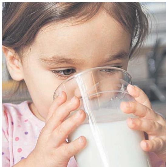
Пийте, діти, «молоко», а чи будете здорові?

Науковці кажуть, що на українському ринку течуть уже не струмочки, а річки фальсифікованого молока. У молочних продуктах, як правило, виявляють силу-силенну жирів рослинного походження. Фахівці обурюються, що екзотичні олії – пальмову, кокосову – знаходять навіть у вершковому морозиві, згущеному молоці, вершках. Окремі зразки такої продукції практично повністю складаються з такої сировини. Вміст олії, невідомо звідки завезеної, сягає 95 відсотків. Автори такої продукції намагаються запевнити споживачів, що ці добавки надають оригінального смаку традиційним продуктам. І не хочуть чесно зізнатися, що про смаки та вподобання покупців ніхто насправді не дбає. Бо лише одна банка згущеного молока приносить фальсифікаторам 1,5–2 гривні прихованого прибутку.