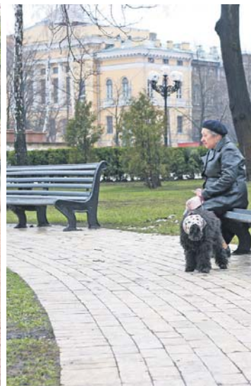
Демографічну ситуацію в Україні науковці харак