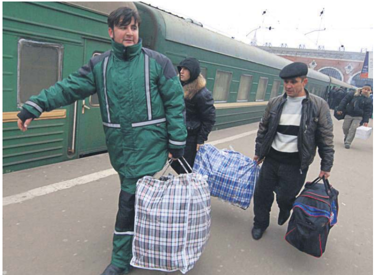
Україна продовжує втрачати кваліфіковану робочу силу, яка знаходить тимчасовий, а згодом і постійний прихисток за кордоном

Україна серед усіх європейських країн утримує найнижчий сумарний рівень народжуваності. На зламі століть він досяг безпрецедентного рівня, якого не було в жодній країні світу – менше 1 дитини на сім'ю. Це найнижчий за весь період післявоєнної історії України рівень. Нині ситуація дещо покращилась. Показник становить 1,1 дитини на сім'ю, що порівняно з 1990 роком удвічі менше. Через низьку народжуваність та високий рівень смертності Україна за роки незалежності втратила майже 6 млн людей. Зниження рівня народжуваності призвело до того, що нині третина населення досягнула пенсійного віку. На 14 млн пенсіонерів припадає 18 млн працюючого населення, з яких тільки 7 млн трудяться в матеріальній сфері виробництва. Сьогодні Україна за часткою населення віком понад 60 років входить до тридцятки найстаріших держав, посідаючи 25/26-те місце (яке вона поділяє з Норвегією) в світовому рейтингу за цим показником. А ось показник довголіття (частка осіб віком 80 років і старше в складі літнього населення) в Україні нині в середньому на 5–6 відсоткових пунктів нижчий, ніж у таких країнах Європи, як Швеція, Франція, Іспанія.