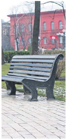
теризують як катастрофічну, а самій нації визначають статус такої, що вимирає