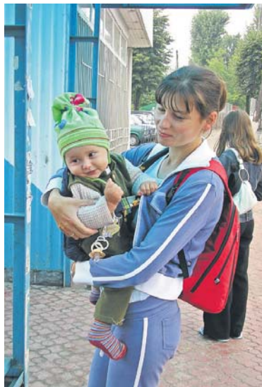
В Україні кожна п'ята сім'я з дитиною – неповна