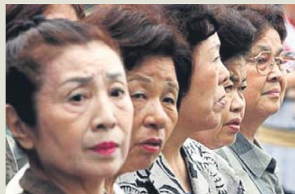
Середня тривалість життя японок – 86 років

Наприкінці 2010 року наша країна мала рівень тривалості життя, який на 15 років нижчий, ніж у Японії, на 14,5 року нижчий, ніж у Швейцарії, на 14 – ніж в Італії. За середньою тривалістю життя населення України посідає 57-е місце у світі серед чоловіків і 45-е – серед жінок.