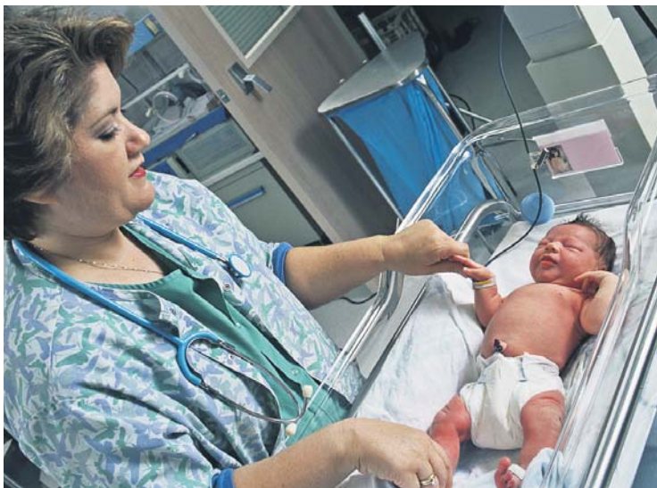
Сплеск народжуваності, про який зараз говорять експерти, є тимчасовим явищем