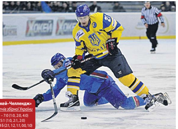
Етап «Єврохокей–Челленджер» Результати матчів збірної України Україна – Румунія – 7:0 (1:0, 2:0, 4:0) Україна – Литва – 5:1 (1:0, 2:1, 2:0) Італія – Україна – 5:4 (2:1, 1:2, 1:0, 0:1, 0:0)

39 по 11 лютого у Києві проходив Міжнародний хокейний турнір «Єврохокей–Челленджер», у якому взяла участь національна збірні команди України, Італії, Литви та Румунії. Поступившись італійцям у серії післяматчевих булітів, українці разом із перемогою у матчі віддали суперникам і перемогу на турнірі загалом.