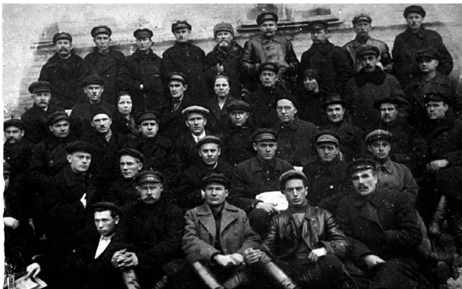
Делегати 3-го всеукраїнського з'їзду профспілки металістів від Дніпропетровщини (1926 р.)

профспілки стали реальною силою, на яку зважали і влада, і нова буржуазія.