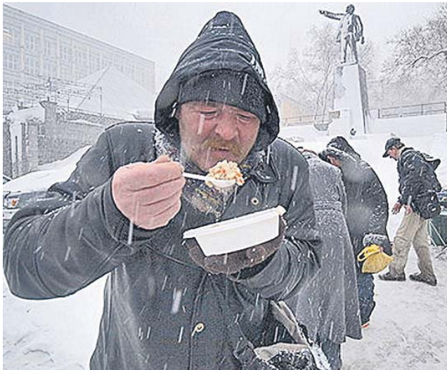
Цієї зими особливо актуальним було піклування про безхатченків