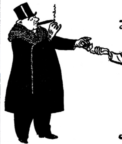
Маячня! Як там класи? Класи вигадані Марксом!