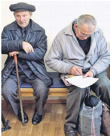
У черзі за соцісправедливістю