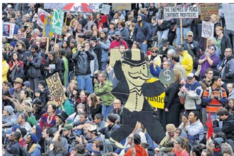
Мітинг проти соціальної несправедливості в Нью-Йорку

У 2007 році на 62-й сесії Генеральної Асамблеї ООН було ухвалено Резолюцію, що передбачає, починаючи з 2009 року, щорічне відзначення 20 лютого Всесвітнього дня соціальної справедливості. Це стало важливим кроком на шляху розроблення сучасних підходів до ліквідації злиднів і бідності, забезпечення повної зайнятості, гідної праці, рівності чоловіків і жінок, соціального добробуту та соціальної справедливості для всіх.