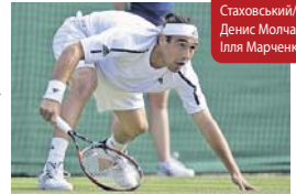
Чи вдасться українцям у наступному раунді Кубка Девіса поставити на коліна Маркоса Багдатіса?

Збірна України з тенісу здобула впевнену перемогу над представниками князівства Монако у другій світовій групі розіграшу Кубка Девіса, не віддавши суперникам жодного матчу.