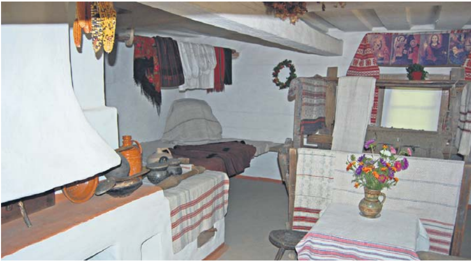
Середня Наддніпрянщина Правобережжя