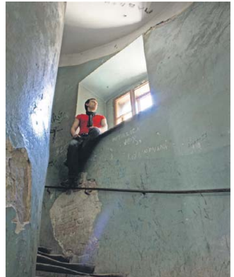
Фарбувати стіни всередині будинків повинні раз на 3–5, зовні – раз на 4–5 років. До утримання прибудинкових територій входять також профілактичні й ремонтні роботи