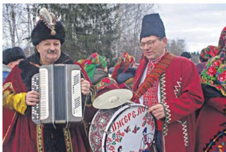
Фольклорний ансамбль «Джерело» під час святкування Масляної