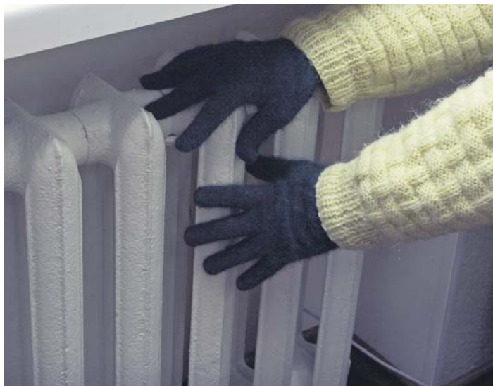
Упродовж 2011 року за житлово-комунальні послуги кожна родина додатково сплатила в середньому по 160 грн щомісяця