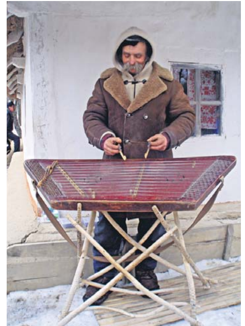
Музика є невід'ємною складовою народної творчості