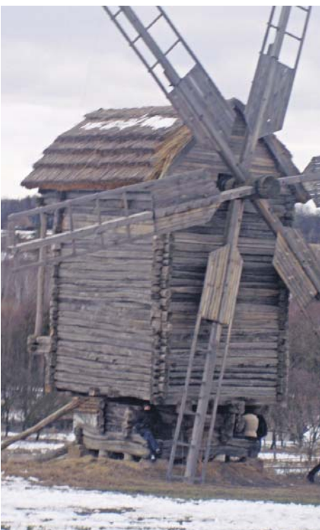
Володарі вітрів музею

Наша держава пройшла різні за значимістю історичні віхи та періоди. Проте найцікавіший, напевне, той, що найбільше хвилює уяву дивними, у розрізі сучасності, звичаями, незвичним, але яскравим вбранням, житлом, посудом, музикою чи поезією. Сьогодні, аби мандрувати століттями, не потрібна машина часу. Віки, що відійшли у небуття, нашим мріям нині – не перешкода. Адже доторкнутися до історії, відчутти колорит українського села – справжнього, без прикрас, допоможе етнографічний музей під відкритим небом у Пирогово.