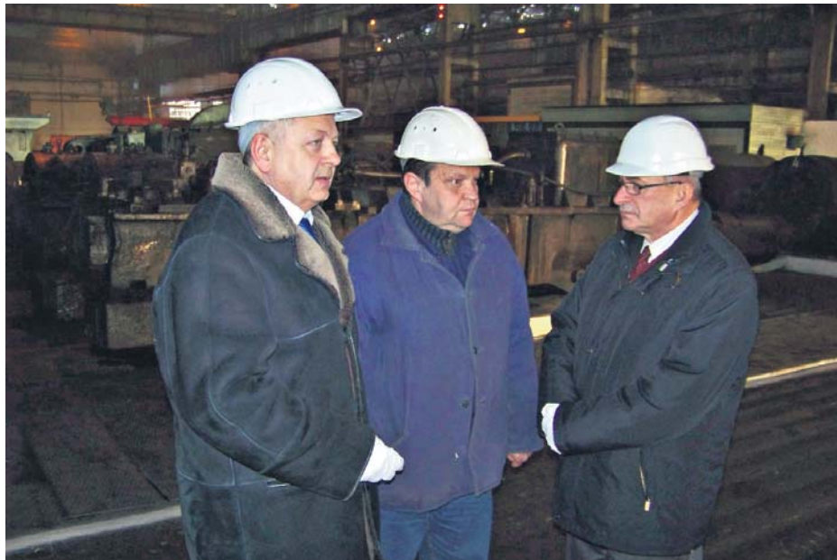
У заводському цеху

вдалося створити минулого року в рамках регіональної угоди на Дніпропетровщині.