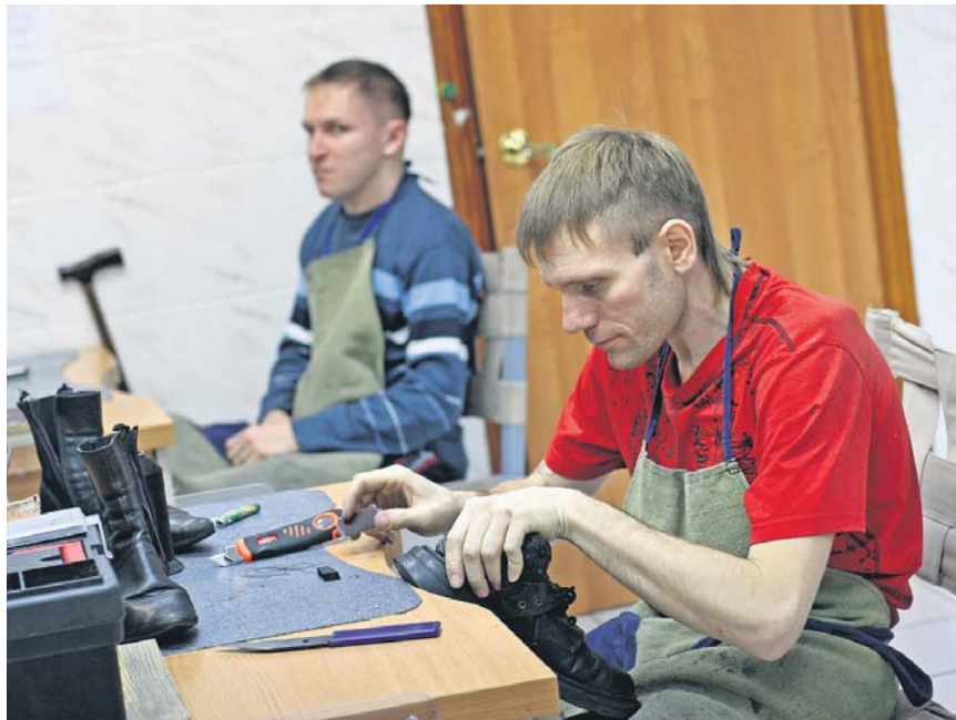
Гарний фахівець завжди цінується. Вивчившись протягом 5 місяців на майстра з ремонту взуття, слухач одержує можливість заробити не лише на кусень хліба, а ще й на масло до нього