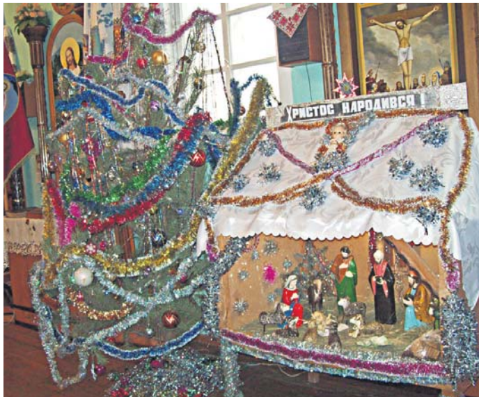
Різдвяна шопка, або «віфлемська повітка», в якій народився Ісус Христос

Відтоді святкування Різдва Христового в цих селах супроводжується урочистими церковними піснями, колядками, щедрівками та прославленнями Божого сина. Особливо 7 січня, після закінчення раннього Різдвяного богослужіння. А вже саме в цей і два наступні дні настоятелі Української греко-католицької церкви Преображення Ісуса Христа села Званівка, Греко-католицької церкви Зіслання Святого Духа в селі Роздолівка та парафії Української греко-католицької церкви Різдва Пресвятої Богородиці в селі Верхньокам'янське благословляють колядників вертепу в яскравих колоритних костюмах, що представляють епоху двотисячолітньої давнини, на відвідини кожної хати. А приносячи із собою добру звістку, ще й показувати односельцям своє унікальне дійство. А вже вертеп – це театралізоване, яскраве подання фрагментів Євангелія. Постановку дивовижної вистави здійснила керівник Будинку