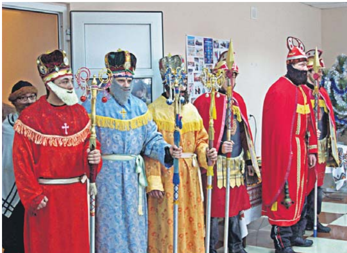
Фрагмент вистави «Різдвяний вертеп» у будинку Володимира Орищина

ВАЛЕНТИНА МОРОЗОВА, М. ДОНЕЦЬК