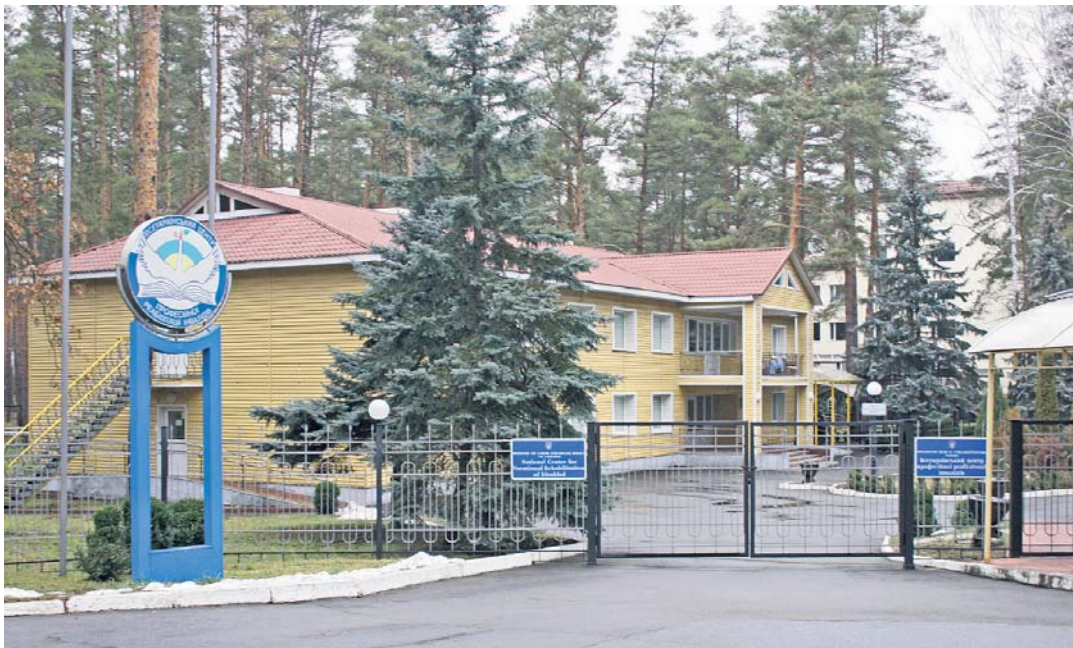
Всеукраїнський центр професійної реабілітації інвалідів радо відчинив двері для всіх охочих пройти профпідготовку. До того ж абсолютно безплатно