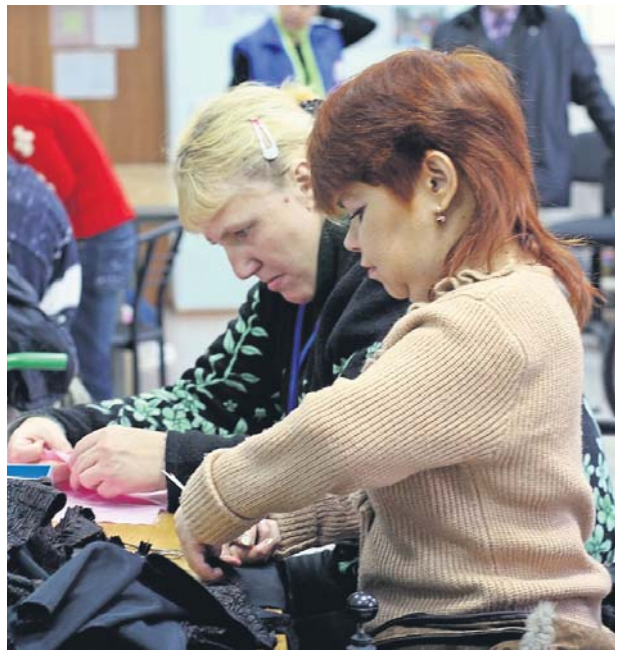
Майстрині-швачки повертаються додому з оновленим гардеробом. Їм усе під силу: і спідницю пошити, і навіть пальто