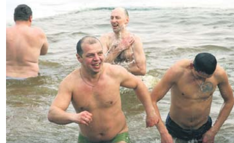
Вода хоч і крижана, але ще ніхто ніколи не застуджувався

Йорданську воду корисно вживати щодня, промовляючи молитву, а також не забувати робити добрі справи.