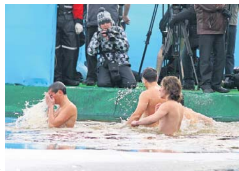
«Синку, скоріш знімай, не літо ж!..»