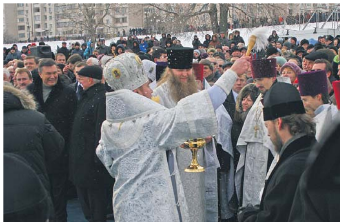
Подивитися на хрещенські купання приїхали Президент Віктор Янукович і Прем'єр-міністр Микола Азаров. Тут їх, як і решту глядачів, священники окропили свяченою водою

ТЕТЯНА РУБАН, «ПВ»