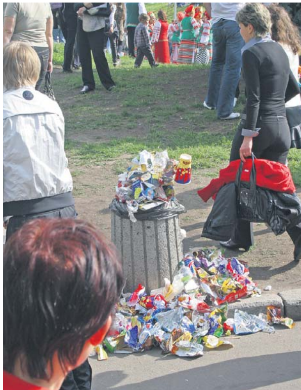
Україна – європейська країна?

Чимало депутатських ініціатив поки що залишилися нереалізованими. Йдеться, зокрема, про вільний продаж травматичної зброї цивільним особам. Іні-