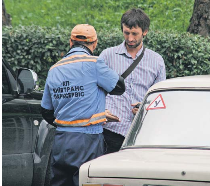
В Україні ще не скоро будуть працювати автомати там, де можна заробити «живу копійку». Наш менталітет не дозволить...

Минулоріч із 3080 майданчиків для платного паркування в Україні лише 116 було обладнано паркувальними автоматами, а 32 – терміналами для в'їзду та виїзду. Це становить 5% їх загальної кількості. Сьогодні, за даними Міністерства регіонального розвитку, будівництва та житлово-комунального господарства, для обладнання всіх паркувальних місць необхідно встановити близько 7 тис. паркоматів. Вартість таких автоматів вітчизняного виробництва становить від 10400 до 48500 грн. А от у Москві здійснюють інший експеримент – встановлення так званих GSM-паркоматів. Такі автомати обладнані GSM-модулем, що передає до центру управління інформацію про кількість та тривалість паркування. У свою чергу, із цього центру інформація може передаватися водіям. Наприклад, про зміну тарифів. Сплатити за таке паркування можна за допомогою старт-картки, попередньо поповнивши її баланс. Оскільки московські паркомати не приймають готівку, це знижує ймовірність їхнього злому. Крім того, вони не потребують регулярної інкасації.