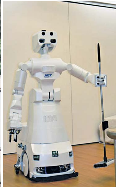
А цяй хатній робітниця не потрібні ні подарунки, ні компліменти, навіть зарплата...