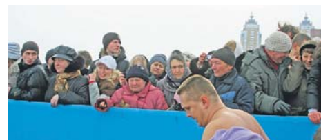
Ось тільки глядачам холодно...