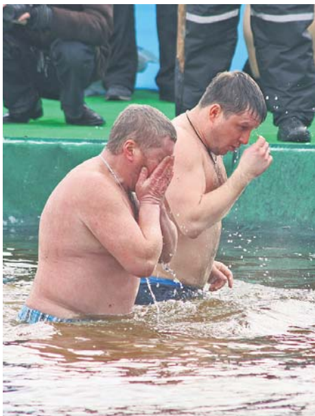
Вважається, що тим, хто пірнув у крижану воду, прощаються усі гріхи

Напередодні Водохрещя – ввечері, 18 січня (у пам'яті про те, що Спаситель своїм хрещенням освятив воду), вода вважається найсильні-