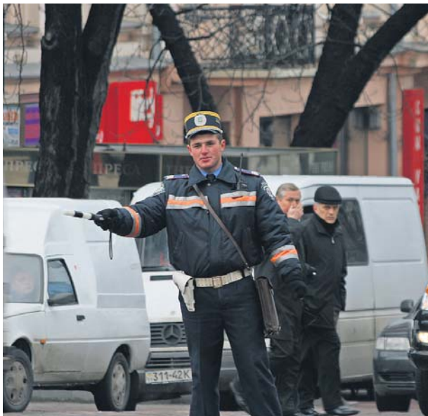
Чарівна паличка-«годувальниця» пересічного даїшника, або жезл покарання пересічного водія