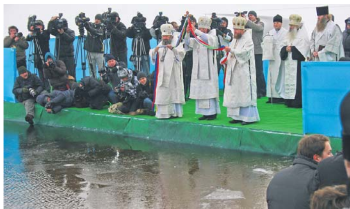
Тайство освячення води перетворилося на знімальний майданчик