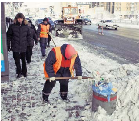
Зима нарешті вирішила перевірити готовність до негоди комунальних служб. Столицю завалило снігом, тож роботи їм суттєво додалося. Відтепер і вдень, і вночі озброєні автомобільною технікою та ручним інвентарем комунальники готові до боротьби зі стихією.