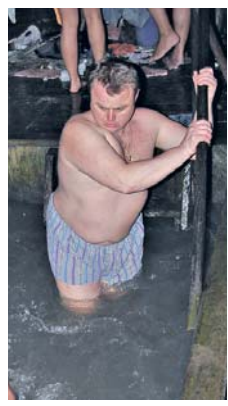
Крижаній води в купальні Феофанії віряни не бояться