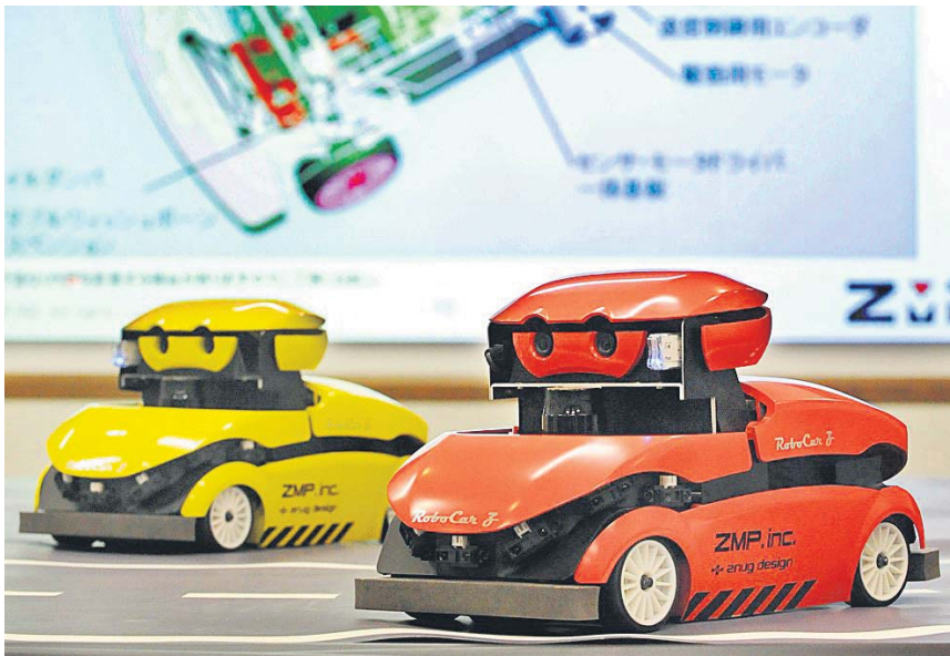
Японський «Робокar Z» – невеличкий транспортний засіб, створений для випробування безпілотних автомобілів, які управляються комп'ютером. Можливо, в майбутньому не будуть потрібні ні водійські права, ні даїшники...