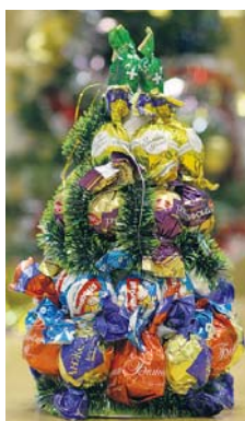
А цю ялинку точно ніхто не викине на смітник. Бо її після свят діти просто... з'їдять!

дозмінюватись і традиції, тим більше, коли вони спричинюють катастрофічні наслідки. Особливо в контексті сучасного загострення екологічної кризи кожному