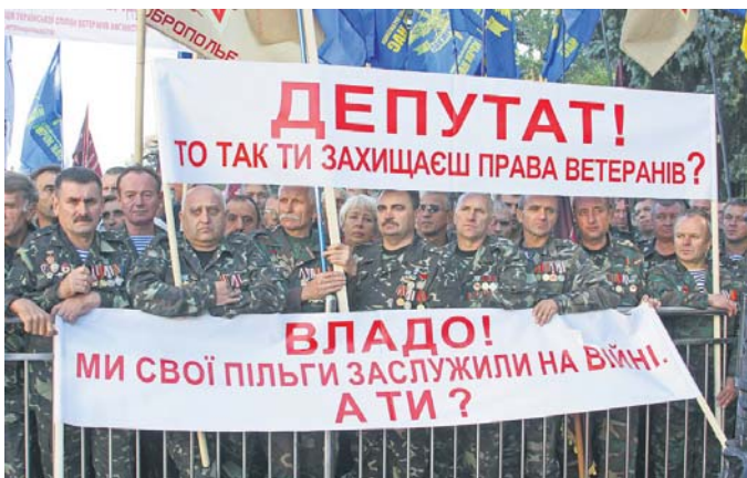
Восени відбувся неприємний для влади наступ чорнобильців і афганців. Ці хлопці не жартують...