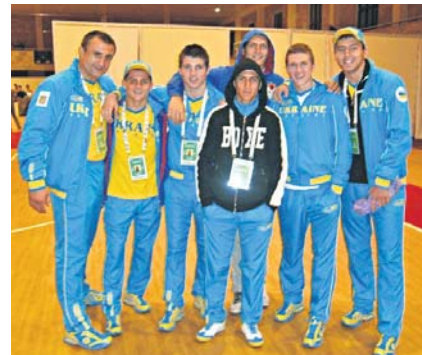
Краща команда року – збірна України з боксу, яка завоювала на чемпіонаті світу в Баку чотири золоті й одну срібну медалі, ставши при цьому найкращою на планеті в командному заліку

ського спорту, який разом з усією країною відзначав 20-річчя незалежної держави. Йдеться, насамперед, про виступи на чемпіонатах світу і Європи, етапах Кубків світу, інших великих і відповідальних міжнародних стартах українських боксерів і легкоатлетів, майстрів сучасного п'ятиборства й фехтування, дзюдоїстів і важкоатлетів, веслувальників і біатлоністів, плавців і шахістів, представників інших видів спорту. Вдалі виступи на цих змаганнях, завойовані медалі усіх ґатунків уселяють на-