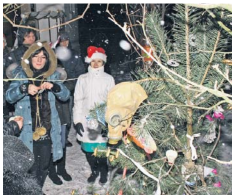
Ялинку, що росте на власному подвір'ї, можна прикрасити найнесподіванішими іграшками...

Щороку напередодні зимових свят розпочинається знищення мільйонів дерев, які покладаються на ешафот «традиції» людського egoїзму, споживацтва та комерції. Жертвою стають не тільки молоді деревця, а часто ще й величні повнолітні красуні, з яких поварарські зрізають верхівки.