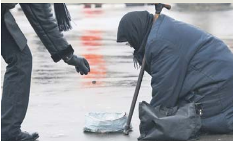
Отак ми розкошуємо на тлі «приміомів і оркестрів»

ського хліба, як було по війні, бо інакше – не проживе. Так само він мусить лікуватися придорожною травичкою, бо не в змозі оплатити належну медичну допомогу. Отак у нас під гучні фанфари фактично поважають старість, отак ми розкошуємо на тлі «приміомів і оркестрів». Певна річ, у нас є що показати і чим похизуватися перед «якимись делегаціями», але ж люди, яких зазвичай називають «прости-ми», не втомлюються запитувати один в одного на зупинках транспорту, в чергах чи поліклініках: «Навіщо було ламати все «до основи», щоб потім з уламків будувати те ж саме, тільки гірше?» Упродовж минулого року яскраві враження, звісно, були. Але яскраві не означають приємні. Згадаймо, що саме торік ми, під відповідні гасла й високі постанови, щосили намагалися подолати? Корупцію, вади місцевого самоврядування, заборгованість із зарплати, рейдерство, корумповане судочинство, безлад у житлово-комунальному господарстві з його відверто завищеними тарифами, невиконання соціальних зобов'язань, безробіття, бідність, незаконну приватизацію... Подолали? А може, наблизилися до подолання?