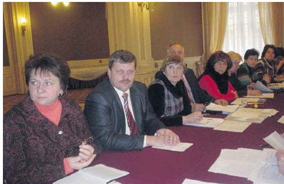
Під час розширеного засідання президії Львівської організації профспілки освіти за участі працівників та завідувачів райвідділів освіти

Грудневе засідання президії Львівської обласної організації профспілки освіти і науки присвячувалося юридичним питанням. Зокрема, про те, як дотримується трудове законодавство, юристи відділу соціально-економічного захисту обласної галузевої профорганізації дізнавалися в Золочівському та Галицькому районах.