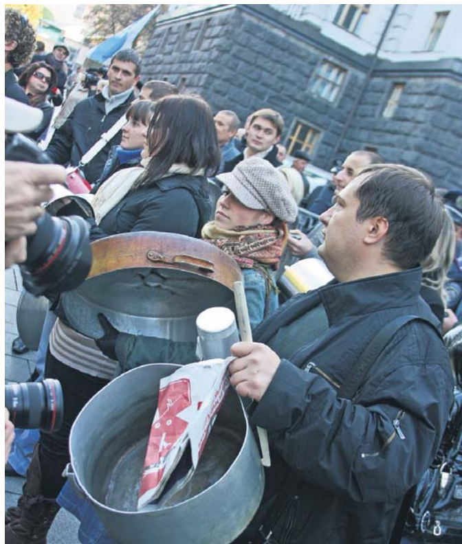
Ну, покричали біля стін Кабміну, погвалтували. І що?..

Проте соціальної політики – в її безпосередньому тлумаченні – в нас просто немає, і передусім тому, що немає того соціуму, верстви якого об'єднані конкретною ідеєю (приміром, справедливості, чи національної, чи культурницькою, чи ще якоюсь) і знають, від чого відмовитися, а за що боротися до кінця. Скажімо, та ідея справедливості, про яку постійно говорить політолог Ю. Бугдан, фактично є розумною, але «закритою релігією» певного соціального кластера, вона реально не потрібна багатьом і не вельми зрозуміла бідним. Як відомо, багаті в нас з'явилися практично одночасно з розвалом Союзу, ми тоді навіть не здогадувалися про їхню кількість і «якість». І всі роки незалежності промислово-фінансові групи фактично наживалися в дедалі деградуючій країні, номінальні керівники якої не зробили нічого, аби сформулювати й реалізувати загальнонаціональні