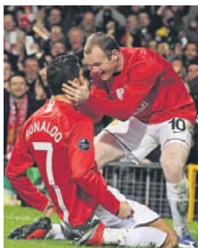
Роналду та Руні раніше захищали кольори «Манчестер Юнайтед»

До символічної збірної кращих футболістів 2011 року потрапили представники лише трьох клубів – «Барселони» (п'ять гравців), «Реала» (чотирьох) та «Манчестер Юнайтед» (один).