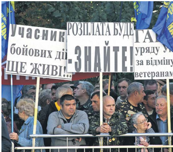
Мабуть, пора пригадати владі українське прислів'я: «Не будить лихо, поки тихо»