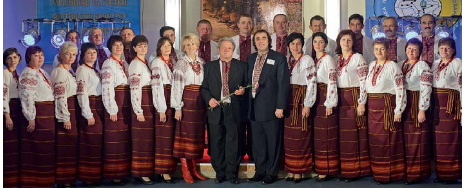
Хоровий колектив ПАТ «Тернопільгаз»

У затишному курортному містечку з поетичною назвою Яремче, що в Івано-Франківській області, на базі оздоровчого комплексу «Карпати» 1–5 листопада 2011 року проходив XIV Всеукраїнський фестиваль-конкурс самодіяльної художньої творчості. Понад 200 митців-аматорів із 14 областей України полонили глядачів запальними танцями, мелодійними піснями, яскравим художнім словом, створили барвисте свято народної творчості й таланту.