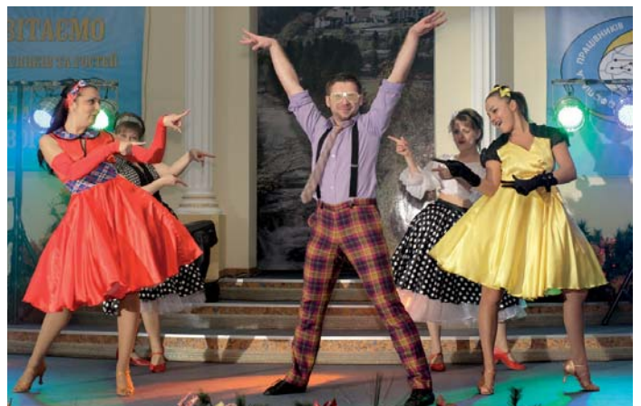
Танцювальний колектив «Карамельки» (ВАТ «Дніпрогаз»)