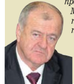
ЛЕОНІД КОЗИК, ГОЛОВА ФЕДЕРАЦІЇ ПРОФСПІЛОК БІЛОРУСІ

Я порадив би українським колегам звернутися зі скаргами до Міжнародної організації праці. Саме тут розглядаються заяви про порушення владою низки Конвенцій МОП, відповідно до яких уряд має забезпечити нормальне функціонування профспілок.