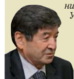
СІЯБЕК МУКАШЕВ, ГОЛОВА ФЕДЕРАЦІЇ ПРОФСПІЛОК РЕСПУБЛІКИ КАЗАХСТАН

“ Я вважаю, що втручання влади у діяльність профспілок суперечить принципам свободи об'єднань і прав трудящих вільно здійснювати свою діяльність. Ми, представники Загальної конфедерації профспілок, наполягаємо на тому, щоб уряд України наразі втрутився у ситуацію та вжив відповідних заходів для припинення протиправних дій щодо найбільшого об'єднання громадян країни – Федерації профспілок України.”