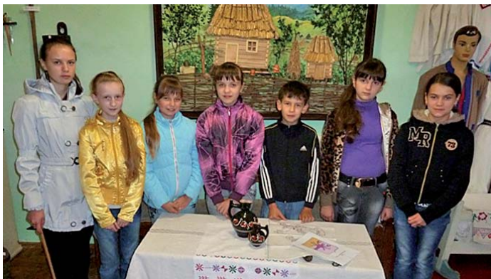
Юні екскурсоводи музею

Культура, безумовно, потребує державної підтримки,