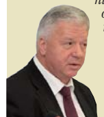
МИХАЙЛО ШМАКОВ, ПРЕЗИДЕНТ ЗАГАЛЬНОЇ КОНФЕДЕРАЦІЇ ПРОФСПІЛОК, ГОЛОВА ФЕДЕРАЦІЇ НЕЗАЛЕЖНИХ ПРОФСПІЛОК РОСІЇ

“ Ми повинні припинити втручання державних органів у діяльність профспілок. Цей процес набуває усе більшого розмаху. І подібні процеси відбуваються не тільки в Україні. Вони спостерігаються і в Росії, в Киргизстані, в Грузії та інших державах. І скрізь влада послуговується «притягнутими за вухо» аргументами, залучає правоохоронні органи для тиску на профспілки... Все це відбувається в інтересах окремих фінансових груп, олігархів, а інколи – і держави.”