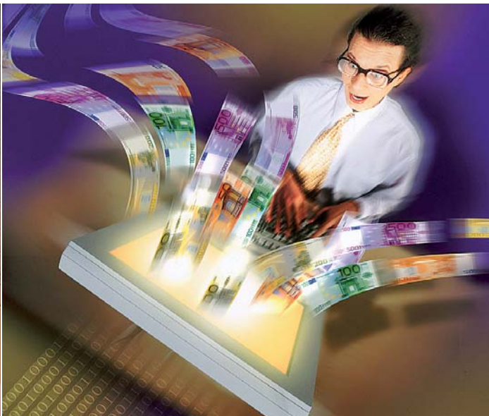
Жертвою шахрая може стати кожен. Особливо, якщо прагнути «легких», не зароблених грошей