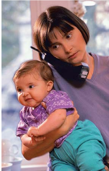
Легко потрапляють на «вудочку» шахраїв молоді мами та непрацюючі жінки

Можна стати жертвою шахрая, продаючи квартиру чи машину. З власником зустрічаються невідомі і з ентузіазмом розповідають, що готові хоч зараз купити будинок чи авто. І навіть висилають чек із сумою, яка «випадково» перевищує домовлену. Потім жертву змушують повернути різницю. А чек, як можна здогадатися, виявляється недійсним. Шахраї не залишили без уваги й соціальні мережі, які нині користуються шаленою популярністю. Злодії отримують доступ до особистих даних користувача на «Однокласниках», «Фейсбуці» чи деінде. А потім від його імені розсилають усім друзям слізного листа: мовляв, пограбували за кордоном, терміново перекажіть гроші на зворотний квиток або оплату готелю.