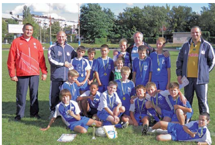
Ось вона, команда щасливих переможців!

Усіх, хто має стосунок до спорту, привітав також і Голова ФПУ Василь Хара. «Наша держава завжди славилася своїми спортивними талантами. За 20 років незалежності сформувався стійкі традиції та багата історія з розвитку понад ста видів спорту. Спортсменам України аплодують на міжнародних аренах усього світу. Проте за усіма перемогами стоїть непроста, копійка щоденна робота тренера, професіонала, ветерана спорту, які з честю вихо-