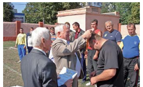
Переможців нагороджує голова ФПО Хмельниччини Г. Харківський

лейболі, настільному тенісі, міні-футболі, шахах, перетягуванні канату, гирьовому спорті. На урочистому відкритті змагань голова Федерації профспілок області Геннадій Харківський кращим інструкторам із фізкультури підприємств та установ і спортивним фахівцям товариств вручив Почесні грамоти та премії. Боротьба в усіх видах програми виявилася азартною та видовищною. Перемогу святкували атлети багатьох профспілкових організацій