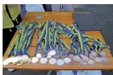
Комплект медалей чекає своїх власників