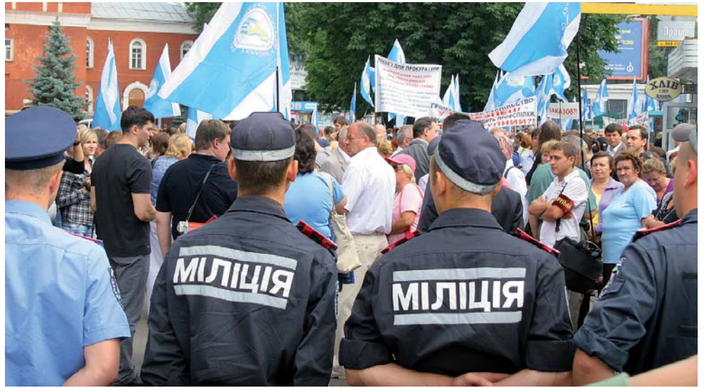
«Не віддамо останнє державі, бо тоді не матимемо нічого», – сказав український народ