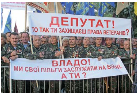
Пільговики обстоюють своє право на життя, вимагаючи від влади скасувати неконституційний закон

Сотні пікетувальників із різних регіонів України 20 вересня провели акцію протесту під стінами Верховної Ради України, вимагаючи зупинити прийняття законопроекту № 9127 «Про гарантії держави щодо виконання судових рішень», який, зокрема, ліквідує соціальні пільги для 16 категорій громадян. Законні вимоги страйкарів підтримала Федерація профспілок України.