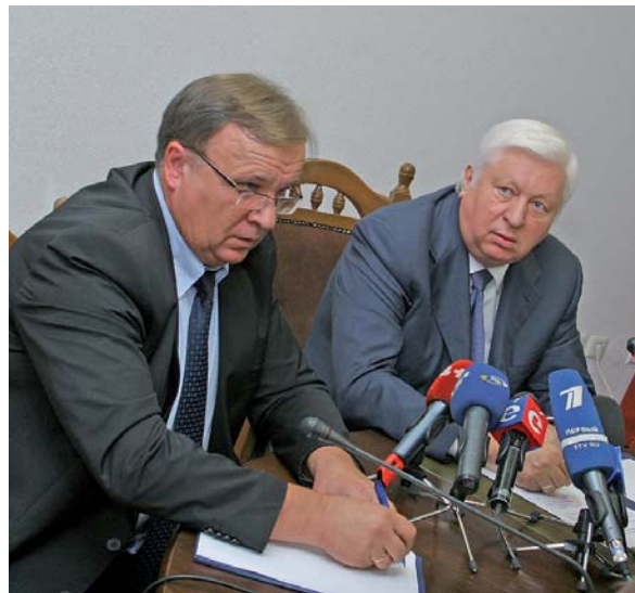
Замість того, аби займатися своїми професійними обов'язками, представники прокуратури працюють на публіку