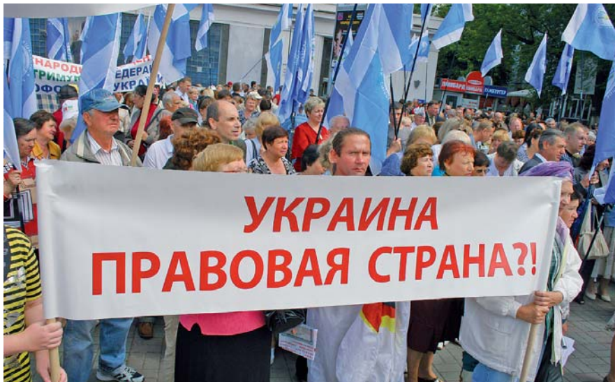
У пересічних громадян виникає риторичне запитання