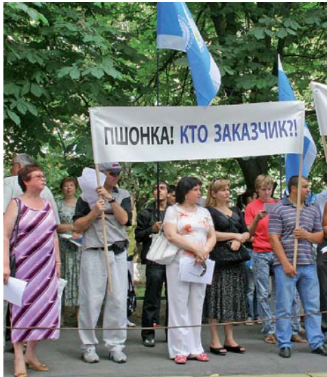
Чи відповість на це запитання пан Пшонка на черговому брифінгу?