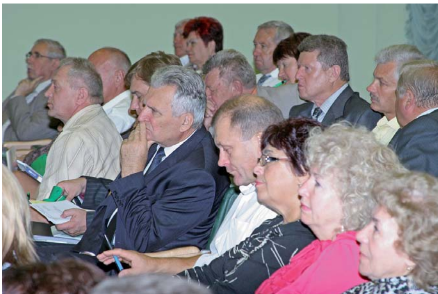
Члени Ради заслуховують звіт Голови ФПУ про виконання ним повноважень