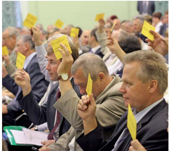
На засіданні Ради Федерація довела, що вона дійсно єдина і монолітна