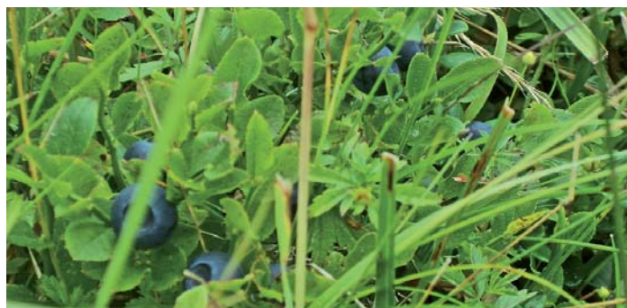
Так росте чорниця