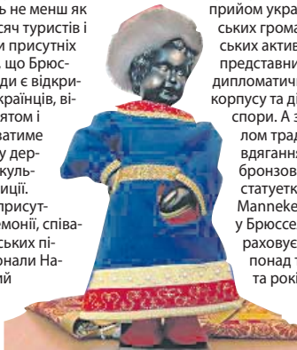
СТОРІНКУ ПІДГОТУВАЛА ТЕТЯНА МОРГУН, «ПВ»

розповсюджені інформаційні матеріали про українську історію та культуру. Після урочистої презентації «Хлопчик» пригощав мешканців та гостей Брюсселя пивом відомого українського виробника. Далі у брюссельській мерії відбувся урочистий прийом українських громадських активістів, представників дипломатичного корпусу та діаспори. А загалом традиція вдягання бронзової статуетки Manneken Pis у Брюсселі на рахунок вже понад триста років.