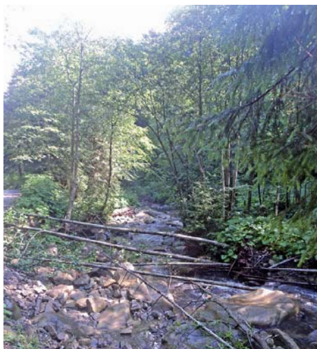
Зламані дерева – примхи природи

Женецький водоспад розташований на потоці Женець біля сіл Микуличин і Татарів, що в Івано-Франківській області на території Карпатського національного природного парку. Відстань (близько 5 км) від траси до гука можна проїхати машиною, однак ми вирушили пішки, аби вдосталь помилуватися неймовірною красою! Йшли між двома гірськими хребтами – Явірник і Хом'як-Синяк... а навкруги, окрім свіжого повітря, зеленого лісу, страшних і водночас захопливих скель, запашних, яскравих квітів, стрімких гірських річок – ще й смачніючі лісові ягоди: ожина, малина, чорниця.