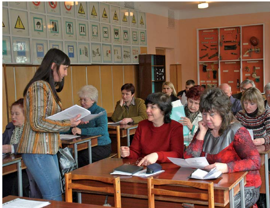
Спілчани під час заняття

Понад 2,6 млн грн виділяється на підприємстві протягом усього року на підготовку й підвищення кваліфікації кадрів.