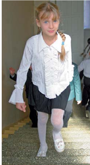
Крокуючи до знань

Тож коли на учнів чекає цікаве й сповнене відкриттів життя, то на викладачів – щоденний іспит на професійну відповідність.