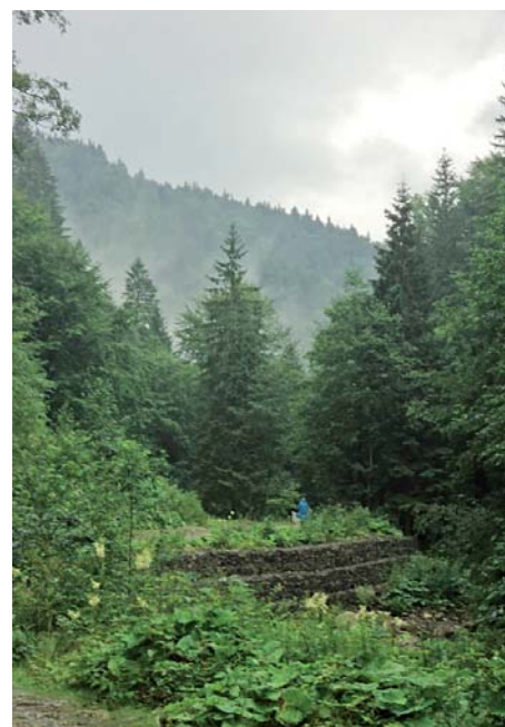
Погода в Карпатах змінюється похвилинно – то дощ, то сонце

Через постійне зволоження і бризки водоспаду, тут усе просто потопіє у буйній, розмаїтій рослинності. Звичайно, для нас, пересічних відвідувачів, уся ця різнобарвна природа – просто краса і просто квіти. Проте пані Наталя розповіла, що ми бачили незабудку болотну, смол-