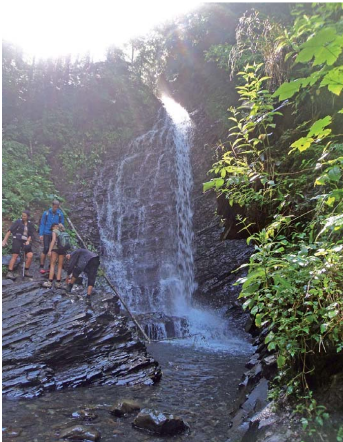
Вражаючу красу цього водоспаду складно передати через фото

У Карпатах чимало водоспадів, і більшість із них називають гуками. Чому – нам розповіла молода гуцулка пані Наталя, яка вела нашу групу до одного з таких дивовижних місць, створених природою. За її словами, гук – гучний, бо чути здалеку! Близько 5 кілометрів лісовою стежкою, минаючи ріки і невеличкі потічки, які восени розливаються і перетворюються на тутешню біду – стихійне лихо, що ми спостерігаємо з екранів телевізорів, – і ми біля однієї з таких річок. Вона спадає з 15-метрової висоти з гучним шумом, і називається цей водоспад – Женець.