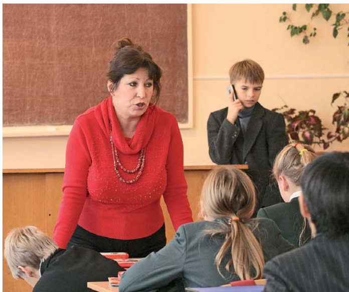
Ви собі розповідайте... а в мене свої справи!