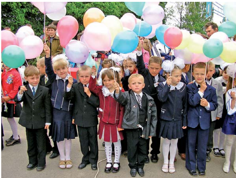
Ось і настав цей урочистий, зворушливий день для 410 тисяч першокласників України