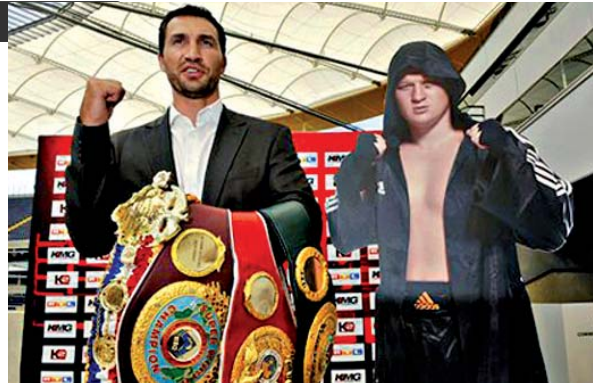
Досі Володимир Кличко зустрічався лише з картонною фігурою Поветкіна

Здобувши перемогу в німецькому Ерфурті над представником Узбекистану Русланом Чагаєвим, росіянин Олександр Поветкін виборов пояс «регулярного» чемпіона WBA, а відтак – і право на титульний поєдинок із «суперчемпіоном» Володимиром Кличком.