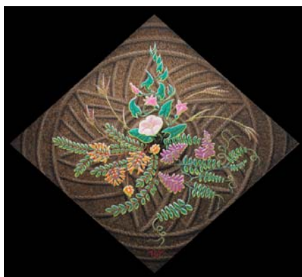
Кожен натюрморт – це букет цілющого зілля, що має символічний зміст