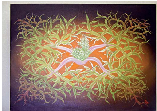
Чарівне сплетіння цілющого дикого зілля та сакральних орнаментів таємничої землі