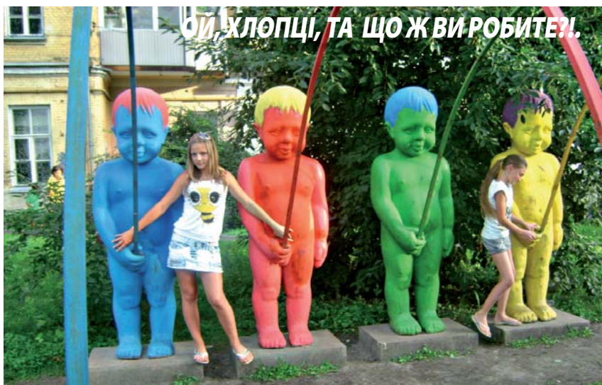
ОЙ, ХЛОПЦІ, ТА ЩО Ж ВИ РОБИТЕ?!