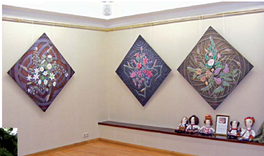
Полотна зображені в оригінальній конфігурації – у вигляді ромба