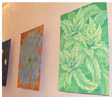
Для мешканців міста оригінальні композиції стають своєрідним відкриттям світу природи