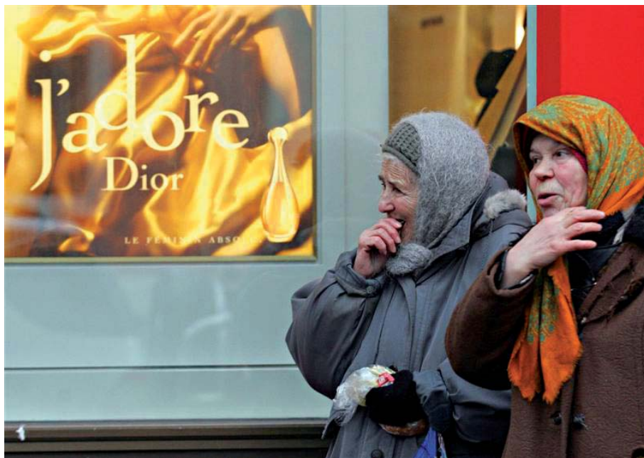
В Європі бідніші за українців лише молдавани

Усім відомо, що в Україні родючі землі та красиві і талановиті люди. На жаль, сьогодні в світі та Європі нашу країну частіше згадують у зв'язку з іншими, негативними показниками. Так, ми стабільно посідаємо перші сходинки майже всіх антирейтингів.