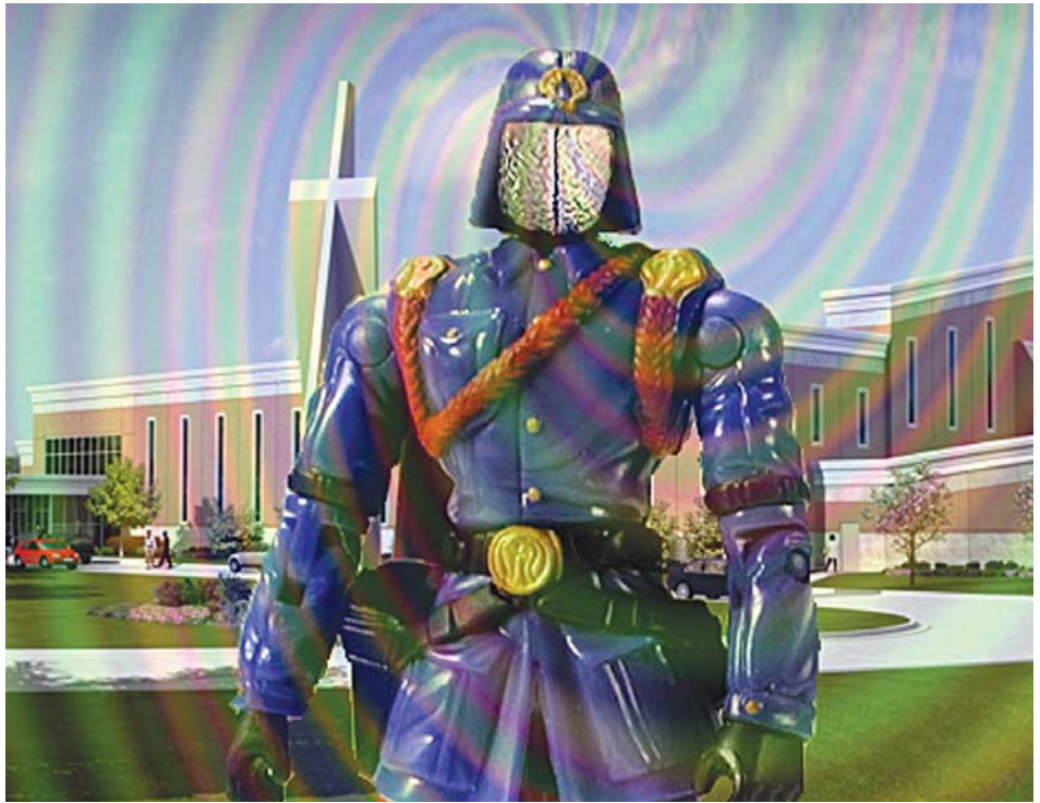
Нашою нервовою системою, свідомістю, емоціями постійно хтось намагається маніпулювати

Наприкінці червня американська неурядова організація Freedom House подала новий звіт за 2011 рік («Нації в дорозі»), в якому зазначено, що більшість пострадянських країн мають ознаки «вразливості щодо непередбачуваних криз на кшталт тих, що відбуваються на Близькому Сході та в Північній Африці. Близько 80% населення колишнього СРСР живе... в державах, які є потенційною небезпечкою для цих народів у найближчій перспективі». Учений-енциклопедист, один з найбільш досвідчених кризових явищ в історії світової культури та цивілізації, фахівець із системного аналізу трансформації соціального устрою в період кризи Сергій Кара-Мурза любить повторювати як своє наукове кредо східну мудрість: китайський ієрогліф, що означає «криза», водночас має ще два тлумачення – «небезпека» і «можливість». Політолог вважає, що нині в світі практикуються два способи управління людьми: батіг (примус, насилля) і духовний наркотик (маніпулювання свідомістю). Маніпуляція нібито не є болісною, проте вона набагато жорстокіша, бо, обмежуючи розум людини і свободу волевиявлення, підриває самі засади цивілізації.