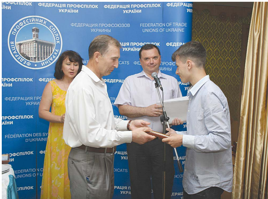
Переможець номінації електронних ЗМІ – Перший діловий телеканал (м. Київ)