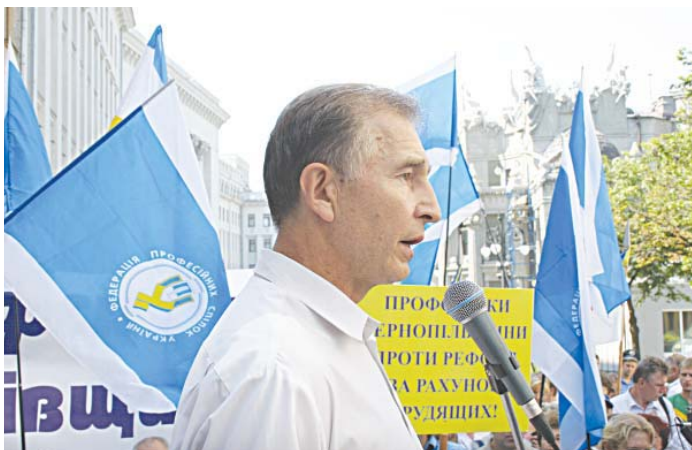
В. о. Голови ФПУ Григорій Осовий на трибуні під стінами Адміністрації Президента