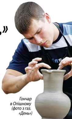
Гончар в Опішному

Так кажуть в Опішному на Полтавщині, куди щороку з'їжджаються гончарі з усієї України на своєрідні фестивалі. Цьогоріч тиждень Національного гончарного здвиження «Здвіг-2011» зібрав наприкінці червня – на початку липня українців, що понад усе цінують самотунність та неповторність народного мистецтва. Фестиваль-ярмарок «Гончарний всесвіт» запропонував усім бажаючим незрівняний вибори на будь-який смак. Відбувся й Інтерсимпозіум, що, по суті, є змаганням робіт майстрів гончарства. Гості фестивалю мали також можливість спостерігати за процесом творення речей із глини, і вправність майстрів справді дивувала! Як відомо, нині в рамках фестивалю відкрито стіну «Гончарна слава». Країці українські скульптори створили меморіальні таблички автора нашого герба Василя Кричевського, видатних майстрів та скульпторів – Сергія Васильківського, Юрія Лебіщак, Остапа Ночовника, Опанаса Сластіона, Єлизавети Трипільської. Щороку з'являтиметься кілька нових табличок. Попри участь у змаганні майстрів з Росії, Азербайджану, Грузії та Литви, призові місця дісталися українським уміль-