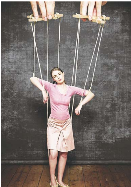
Найбільше рабство – не маючи свободи, вважати себе вільним. Й. В. Гете