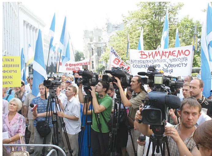
Захід набув значного резонансу в медіа-просторі

ОЛЕНА ОВЕРЧУК, «ПВ»