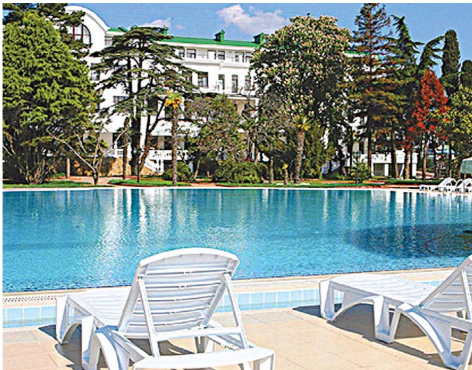
Колишній санаторій «Альбатрос», що в Алушті, виглядає нині шикарно. Але «простим смертним» сюди – зась!

Близько 300 млн грн щорічно отримують бюджетні різні рівні і соціальні фонди від діяльності профспілкових підприємств.