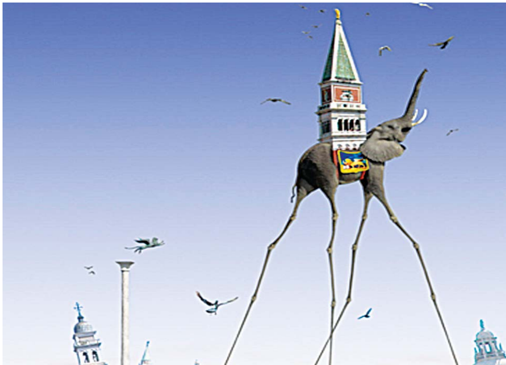
Зв'язок духовного і матеріального такий же тонкий, як слонячі ноги, зображені на картині