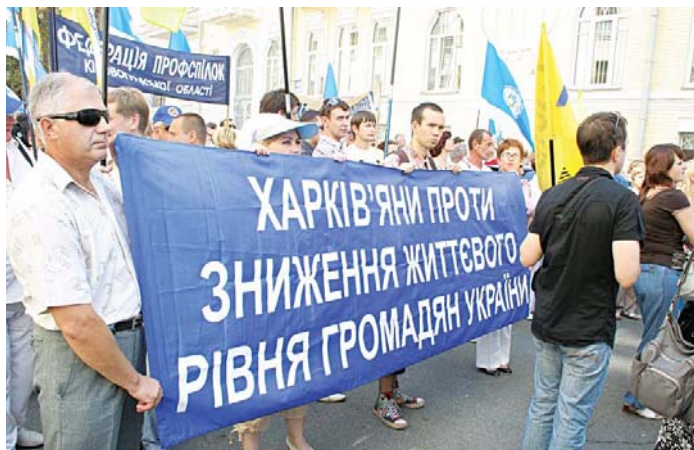
Думку харків'ян поділяють активісти з усіх куточків України

«Ні – антинародній пенсійній реформі», «Ні – звуженню прав пенсіонерів», «Вимагаємо випереджуючих заходів соціального захисту населення», «Профспілки Тернопільщини проти