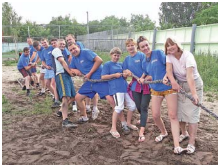
Переможці змагання з перетягування лави – команда апарату облспоживспілки

VII традиційна спартакіада кооператорів Рівненщини відбулася з ініціативи правління Рівненської облспоживспілки, обкому галузевої профспілки й обласної організації добровільного спортивного товариства «Колос». На спортивних аренах Березного помірялися силою, вправністю і спритністю понад 200 посланців колективів апарату, підприємств облспоживспілки та районних спілчанських організацій.