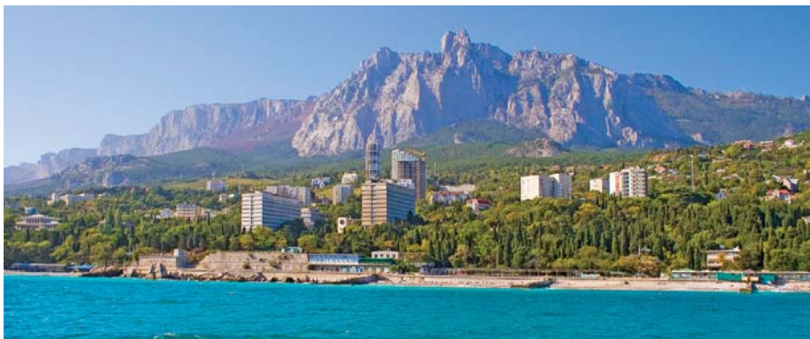
Земля на Кримському узбережжі – ласий шматок для чиновників

– Більшість із них не схвалюють таких дій. Але мене в цій історії хвилює ще один дуже важливий аспект. Увесь той негатив, який збурують прем'єр-міністр Криму і прокуратура, проєктується на Президента країни – адже наше суспільство звикло покладати відповідальність на тих, хто нагорі. Я твердо переконаний, що Віктор Федорович не знає всіх подробиць і до цього абсолютно не причетний. Я вірю, що наша перша зустріч із ним розставити все по своїх місцях. І я не приховую, що поділяю погляди Президента і є його прихильником. Біда в тому, що ініціатори цього беззаконня, нападок на профспілки не розуміють, що своїми діями викликають у суспільства недовіру до влади. А влада завжди асоціюється з Президентом. Адже їх самостійні вчинки зачіпають десятки тисяч людей! А разом із родинами, сусідами, людьми, яким це розповідають, – уже мільйони. Із чим у такому разі ми прийдемо на вибори восени 2012 року? Із тим негативом, який несуть ці люди? Що ж до нинішніх нападок на профспілку власність, то нам не звикати. Ми, як і минулого разу, обстоїмо її і збережемо для мільйонів українських громадян.