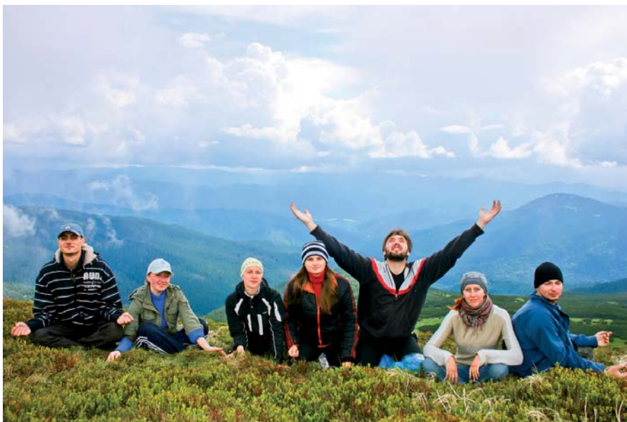
Неперевершена краса! Тут небо сходиться з землею...

Неподалік Заросляка знаходиться КПП Карпатського національного заповідника, де перепуска для туристів на Говерлу (видається на КПП) коштує 15 грн, для дітей – 5 грн. Видаючи перепустку, вас записують у книгу! Особисто для мене це незрозуміло, адже коли людина повертається, відмічатися їй не потрібно. Як в анекдоті: «Кулі пішли...», а чи дісталися вони цілі – байдуже.