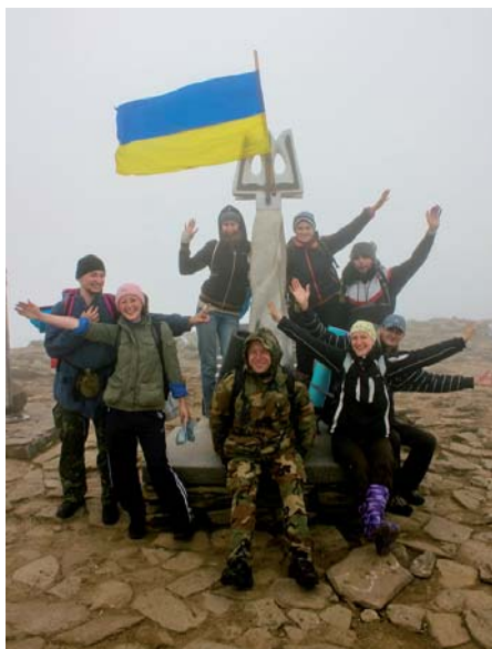
На вершині Говерли