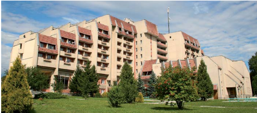
Через протистояння оздоровниці можуть опинитися у приватних руках

І таких документів десятки. Так, 7 червня вимагають надати відомості того ж дня. А ось лист, що надійшов 27 травня об 11.00, в якому мене запрошують до Генпрокуратури на 12.00 того ж таки дня. Вимагають інформацію про те, як голосували члени Президії і Ради ФПУ. Усе це схоже на давно забуті методи авторитарного режиму. Це свідчить про те, що вони в паніці, що на них чиниться тиск і вони змушені реагувати. Надсилають, наприклад, розпорядження без рішення суду про визнання недійсними документів на право власності, датованих 2000 роком. При цьому не наводять підстав для таких дій. Просто вимагають – і все! Повідомляють про порушення кримінальних справ, яких не існує. У Криму справа доходить до відкритого тиску і погроз, коли з прокуратури до керівників наших підприємств уночі з'являються десятеро осіб і вимагають надати документи. Відбувається суцільне беззаконня. До прокуратури по всій країні викликають сотні наших людей, вимагають відповіді, як вони голосували на Президії ФПУ, назвати прізвища членів виборних органів, членів рад, членів комісій і т. ін. А втручання у внутрішні справи профспілок, тим більше щодо голосування, заборонено українськими законами. У Законі «Про прокуратуру» (ст. 8) йдеться про те, що розпорядження складають «коли порушення закону мають очевидний ха-