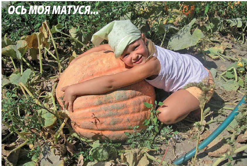
Фото Павла Макаренка, м. Київ

У вас є ком'юні фотографії? Вигадайте до них цікаві коментарі та надішіть на адресу: «Профспілкові вісті», вул. Ш. Руставелі, 39-41, м. Київ, 01033 або profvisti@ukr.net. Найкраще фото буде розміщене у газеті.