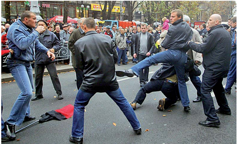
Протистояння представників КПУ і прихильників ОУН-УПА