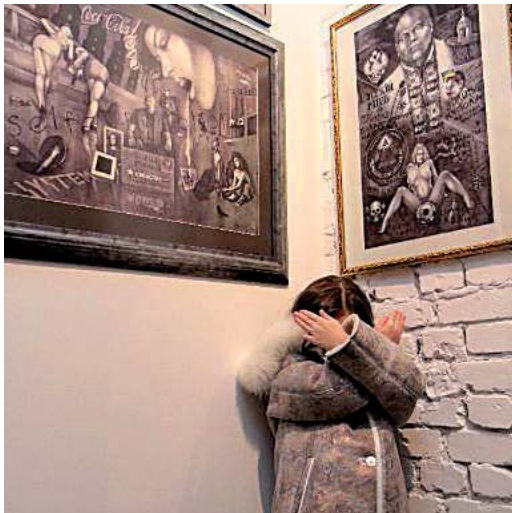
На виставці арт-анархістів