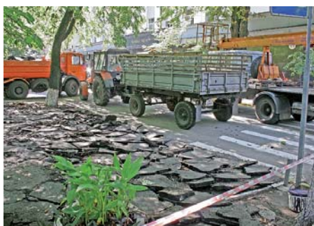
ГПУ заблокувалася від ФПУ спецтехнікою