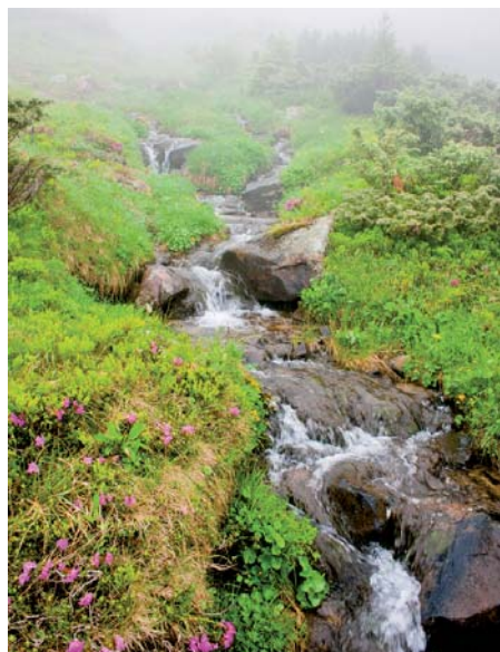
Струмок – один з багатьох, що біжать з Карпатських гір

Спустилися вниз до початку маршруту в чудовому настрої. Начебто звичайна прогулянка, проте відчуття піднесення довго не полишало нас, незважаючи на втому. Уже тут ми дізналися, що в перекладі з угорської Говерла означає «Снігова гора» (Hovar). Її вершина і насправді вкрита снігом, часто навіть посеред літа. І ще ми зрозуміли, що в Україні є справді дивовижні місця, красу яких важко передати у фотознімках. Краще побачити на власні очі.