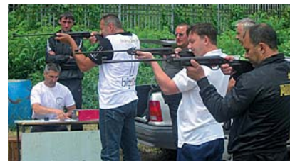
Учасники змагань на вогневому рубежі

В Ужгороді за активної допомоги обласної ради ФСТ «Україна» (голова Владислав Кушнірчук) відбулися фінальні змагання ІХ обласної спартакіади працівників закладів та установ освіти, в яких взяли участь збірні команди міст і районів Закарпаття. Їм передували змагання в колективах фізкультури, міських і районних організаціях, кушові турніри з міні-футболу, чоловічого та жіночого волейболу.