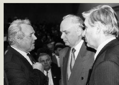
Конгрес ФПУ, 27 січня 1997 року