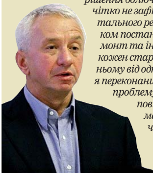
ОЛЕКСІЙ КУЧЕРЕНКО, ЕКС-МІНІСТР ЖКГ

Людям треба відверто сказати, як буде насправді. Тоді значна частина населення розраховуватиме, в тому числі, й на власні сили, а комусь допомагатиме держава. Але буде хоча б єдиний механізм. Сьогодні механізму цього немає, як і нової законотворчої бази про ОСББ, і механізму вирішення болочих питань. Найголовніше – держава чітко не зафіксувала своїх зобов'язань щодо капітального ремонту. Бо якщо перед таким будинком постане серйозне завдання – капітальний ремонт та інвестиція на рівні мільйона гривень (а кожен старий будинок сьогодні потребує в середньому від одного до трьох мільйонів), то ці ОСББ, я переконаний, уже не в змозі будуть вирішити проблему. У законодавстві не закладено відповіді на запитання: що робити, коли мешканці не цілого будинку, а тільки частини його готові вкладати гроші?