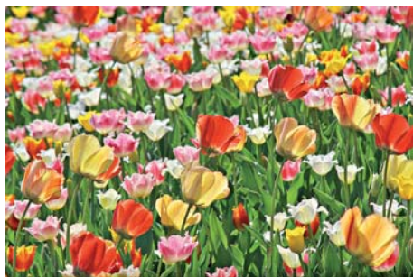
Чи Україна не Голландія?