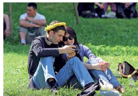
Перше весняне тепло

У програму також входив ярмарок весняних рослин, який нібито продовжив парк квітів, запропонувавши багатий вибір експозицій для власного саду. Всім охочим – як любителям, так і професіоналам у сфері садівництва, представники «Київзеленбуду» у спокійній робочій атмосфері надавали консультації та необхідну інформацію щодо