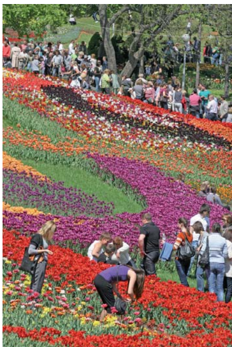
Нескінченний потік охочих упізнати в квітковому різнобарв'я