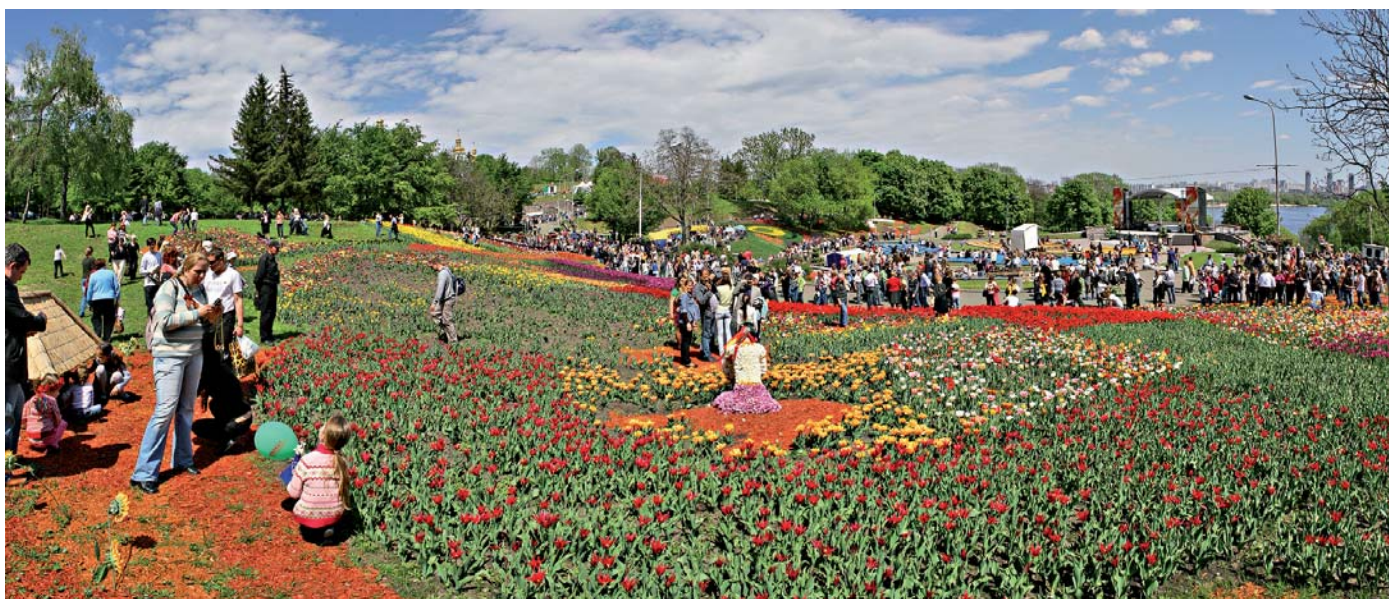
Дебютна виставка ранньовесняних квітів–2011

Більш як на два тижні – з 29 квітня по 15 травня Печерський ландшафтний парк став для мешканців та гостей столиці справжнім оазисом квітів. На території понад два гектари розстелилися різнобарвні живі «килими» – тут проходила виставка ранньовесняних квітів–2011.