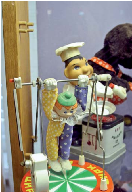
У музеї іграшок кожен згадає своє дитинство