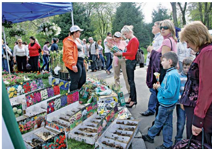
Квітами можна було не лише милуватися, а й придбати для своєї садиби

останніх тенденцій та новацій ландшафтного дизайну.