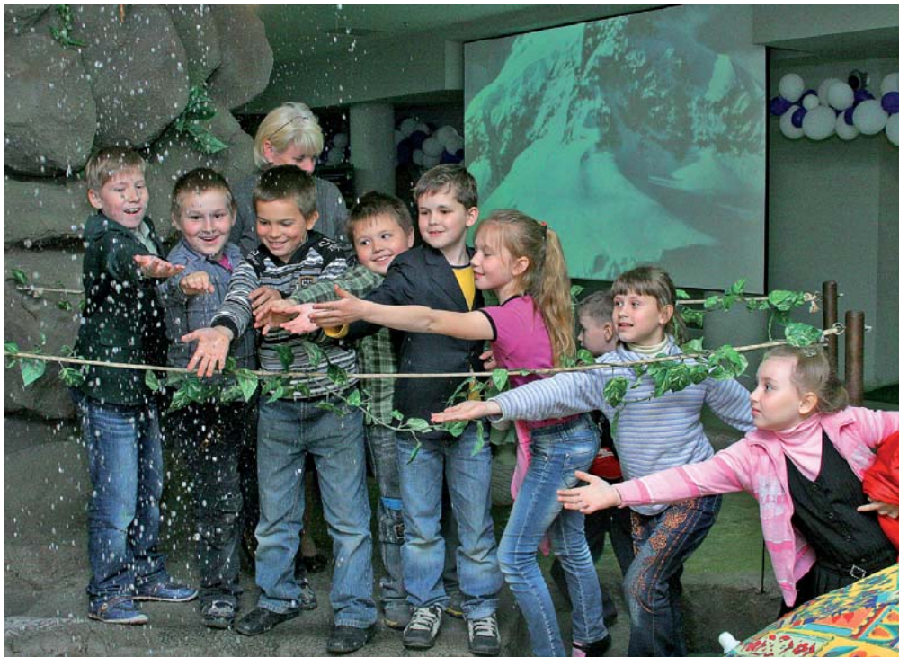
Справжній дощ із громом та блискавкою можна побачити в музеї води навіть у сонячну погоду