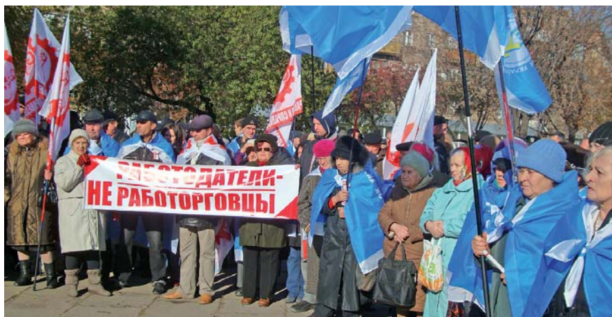
Брак колдоговірної роботи часто призводить до акцій протесту