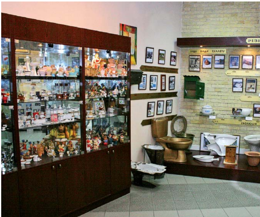
Музей історії туалету – за крок до Книги рекордів Гіннеса

Нині вже створено робочу групу, у складі якої ветерани профспілкового руху, фахівці музейної справи та науковці, які спільно працюватимуть над розробленням нової концепції музейної експозиції та виготовленням дизайн-макета проекту з внутрішнього оформлення експозиції, розміщення світла, аудіо- та відеообладнання тощо.