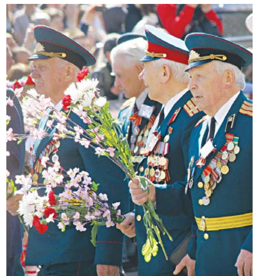
Ім, визволителям, уже надто тяжко навіть святкувати, але солдатської виправки в строю ще не втратили