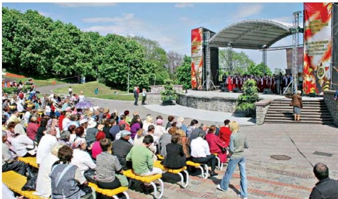
Лави «глядацького залу» Свівочому полі не лишилися порожніми