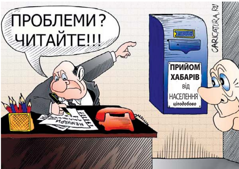
Кожен день – «приймальний»...