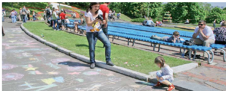
На щастя, наші діти частіше малюють мир

ОЛЕНА СУХОРУКОВА, «ПВ»