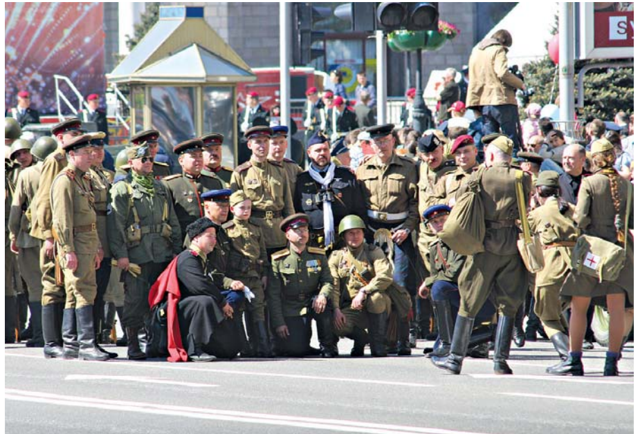
9 травня 2011 року. Фото на пам'ять. Позують учасники маршу Перемоги у формі союзницьких військ