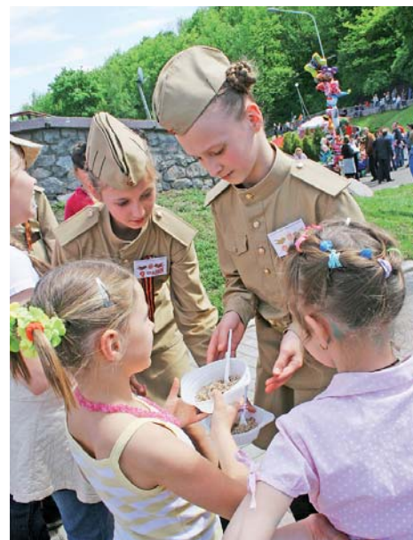
Польова каша смакувала навіть малечі

О 14-й годині розпочався конкурс дитячого малюнка «Діти – ветеранам». Маленькими рученятами дошкільнята зображали світ, який подарували їм їхні прадідусі та прабабусі. Дівчатка у формі, стилізованій під військову, роздавали польову кашу. Поруч діяла виставка робіт декоративного та прикладного мистецтва з гончарства, лозо- та бісероплетення, вишивки, флористики тощо, де можна було отримати й майстер-клас із того чи іншого напрямку народної творчості.