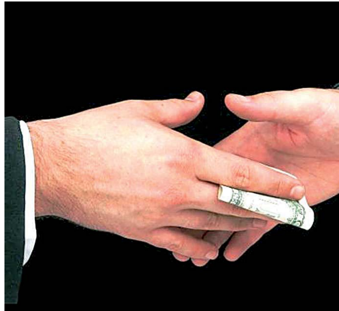
Тепер отак стискають один