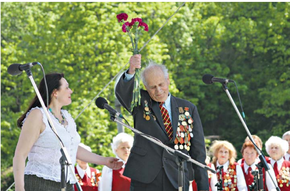
У ветеранських колективах ще й досі співають ті, хто боровив від ворога Київ

Ще не відлунали звуки парадного маршу на Хрещатику, як на Свівочому полі серед різнобарвного моря тюльпанів, якими рясніють його схили, розпочалися заходи, присвячені 66-й річниці від Дня Перемоги. Святкування організував Фонд культури ФПУ спільно із Київським міським центром народної творчості та культурологічних досліджень.