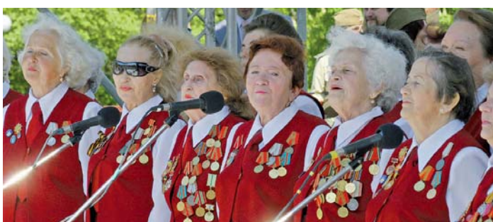
Заслужені, співчі та вічно молоді душею

Час минав, але глядачів на лавах не ставало менше. Київ показав мистецтво декламації, залучивши до концерту арт-групу «Шоу «На трубі» ДК «Укртрансгаз», яка нагадала присутнім рядки поеми Твардовського «Василь Тьоркін», а індійський театр «Накшатра» урізноманітнив концерт східними танцями. Українські пісні та пісні Великої Вітчизняної війни прозвучали у виконанні київських профспілчан: самодіяльного фольклорного ансамблю «Фармац-