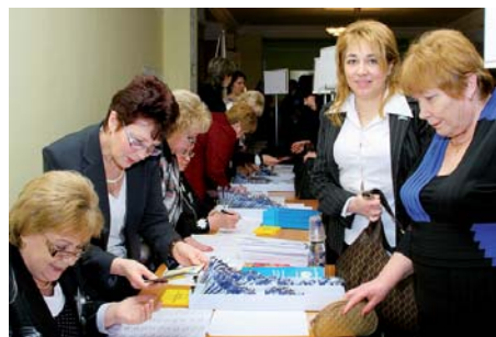
Під час реєстрації

Головне гальмо соціальних і економічних реформ – це тотальна бідність на-