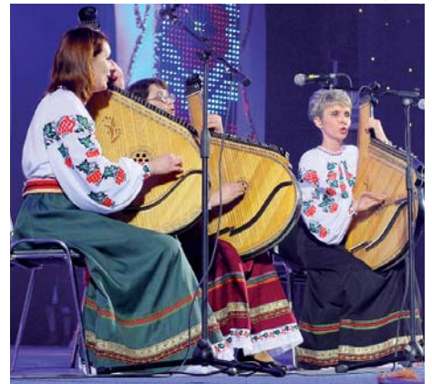
«УКРАЇНА-ДІВЧИНА». Тріо бандуристок Білоцерківського національного аграрного університету