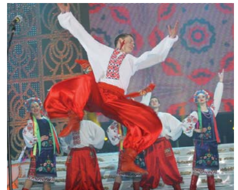
«ГОПАК». Заслужений академічний ансамбль пісні і танцю України «Донбас»