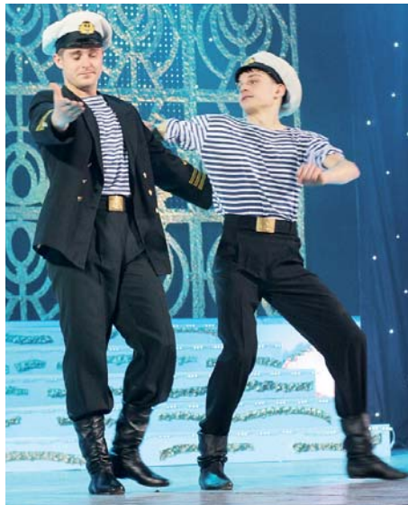
«БАЛАКЛАВСЬКІ РИБАЛКИ». Народний хореографічний ансамбль «Радість» Палацу культури ВАТ «Балаклавське рудоуправління»