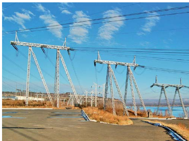
Профспілки стримують намагання влади урівняти тарифи на енергоносії для населення і підприємств

Про високий рівень проведеного заходу свідчить бодай наступний факт: на з'їзд ФПУ було акредитовано близько сотні представників мас-медіа, а інформацію про обрання Василя Хара Головою ФПУ вміть розтиражували всі провідні ЗМІ! Крім того, в роботі поважного зібрання взяло участь широке коло гостей з-за кордону – представники 29-ти держав, починаючи з Росії, США, країн ЄС і закінчуючи далекою Бразилією й навіть