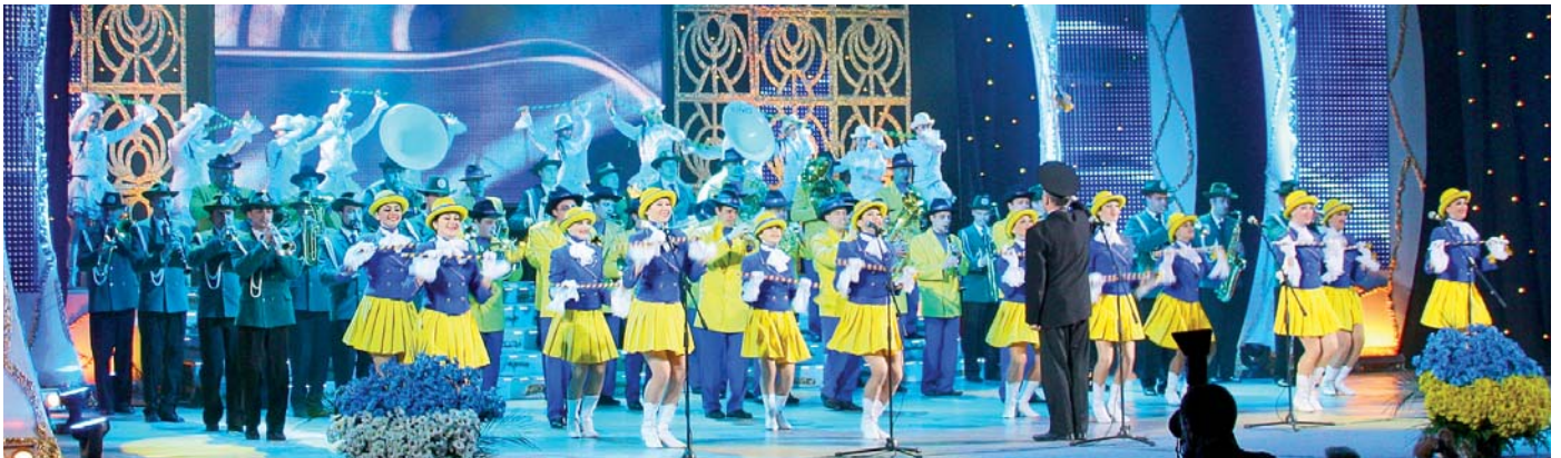
«ПАРАД ОРКЕСТРІВ». Народний оркестр духових інструментів та зразковий ансамбль танцю «Радість» Палацу культури ОП «Шахта ім. Засядька», народний естрадно-духовий оркестр Палацу культури металургів ЗАТ «Донецьк-МЗ», міський народний театр танцю «Веснянка» (м. Горлівка)

Бадьорим маршем гриміли оркестри з Донеччини, хвацько відбивали коліня хлопці з танцювального колективу «Зарево» Донецького металургійного заводу, професійно ковзали по паркету учасники клубів бального танцю із Сум (ТОВ «Фрунзесервіз») та Авдіївського коксохімічного комбінату, не було рівних козакам із Запоріжжя (ВАТ «Мотор-Січ») й Харкова (ДП «Завод ім. Малишева»). Злагоджений і милозвучний спів продемонстрували народний хор центру культури ПАТ «Укртатнафта» (м. Кременчук), тріо «Небо України» БК ПАТ «Волиньцемент», тріо «Срібна терція» з Рівного та інші. Апофеозом свята стало виконання «Молитви за Україну», яка емоційно об'єднала всіх присутніх на сцені і в залі.