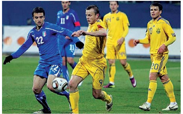
Україна – Італія – 0:2 (Росці, 28, Мампі, 81) Україна: Шовковський, Федецький, Ракицький, Тимошук, Ощипко, Гусєв, Степаненко, Ротань (Олійник, 76), Алієв (Девіч, 53), Ярмоленко, Селєзньов.

У вівторок збірна України у рамках підготовки до домашнього Євро-2012 провела черговий товариський матч зі збірною Італії. На жаль, у поєдинку команд, з яких обидві виступали без низки провідних гравців, господарям поля не вдалося віднайти гідних контраргументів експериментальному складу «Скуадри адзурри».