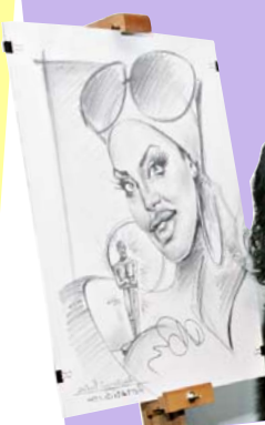
ОКСАНА БАЙРАК, РЕЖИСЕР, АКТРИСА, ТЕЛЕВЕДУЧА: