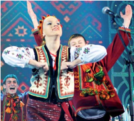
«ЦВІТИ, ПРИКАРПАТТЯ!» Народний ансамбль пісні і танцю «Смерічка» ПК СКК «Моршинкурорт»