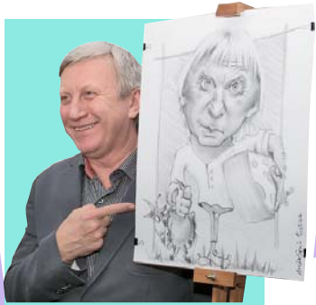
ВОЛОДИМИР ГОРЯНСЬКИЙ, АКТОР, ТЕЛЕВЕДУЧИЙ, НАРОДНИЙ АРТИСТ УКРАЇНИ:

За словами зірок, вони позитивно сприймають подібні жарти, тим паче напередодні Дня сміху. Тож серед присутніх не було жодного невдоволеного, всі посміялися як із своїх друзів, так і з себе. І все ж, як з'ясувалося, не всі представники шоу-бізнесу однаково сприймають і святкують 1 квітня.