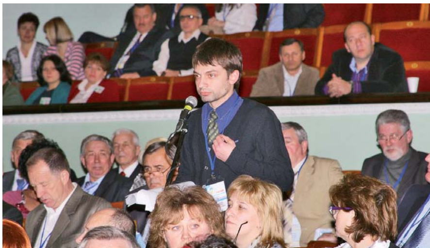
Багато пропозицій і зауважень лунало не тільки з трибуни, а й залу

використання нафтогазових покладів. Наша галузь, на жаль, нагадує не локомотив економіки, а корову, котру лише доять до останньої краплі, а їсти не дають. Усі попередні уряди успішно кришували схеми, за якими ліцензії на розроблення родовищ передавалися від державних структур приватним. Одне з таких родовищ через бюрократичну тяганину з продовженням ліцензії не діяло більш як три роки – втрачено понад 100 тис тонн нафти, 90 млн кубічних метрів газу. Хіба це не шкідництво? Повсюдно фіксується скорочення видобутку. То чому ж ті, хто відповідає за галузь, не звертали уваги на попередження профспілок про неминучість такого падіння? Мінвуглепром і Нафтогаз України не мають змоги фіксувати скорочення видобутку. То чому ж ті, хто відповідає за галузь, не змогла забезпечити гідною платнею своїх працівників! Причому людей, які працюють із ризиком для життя та здоров'я, бо устаткування на підприємствах – застаріле, ще з 60–70-х років.