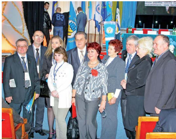
Кожна з делегацій прагнула залишити пам'ять про видатну для профспілок подію