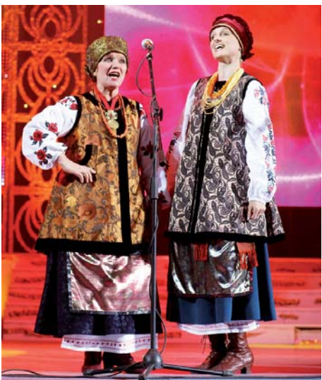
«ГЕЙ, ІВАНКО!» Народна вокальна група «Кримчанка» ЗАТ «Кримський Титан»