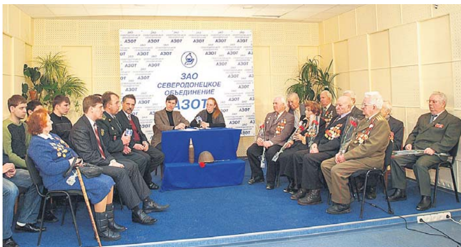
Зустріч із ветеранами у прес-клубі Северодонецького об'єднання «Азот»