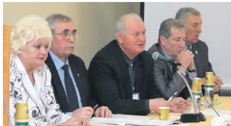
На VI з'їзді профспілки «Машметал» України

Минулий рік для більшості членських організацій ФПУ став важливим етапом діяльності – підготовки та проведення звітів і виборів профспілкових органів. Профспілкові лідери всіх рівнів, виборні працівники та активісти склали своєрідний іспит перед членами профспілок щодо захисту їхніх трудових, соціально-економічних прав та інтересів.