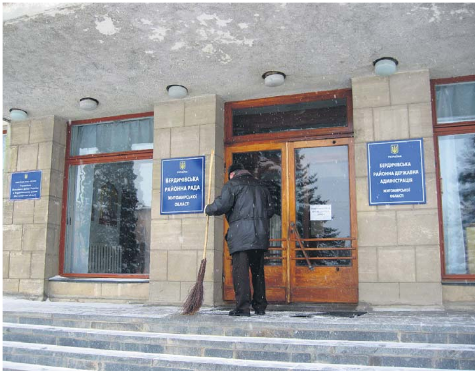
У 2007 році природоохоронна прокуратура виявила незаконні розпорядження голови РДА щодо надання у власність земельних ділянок