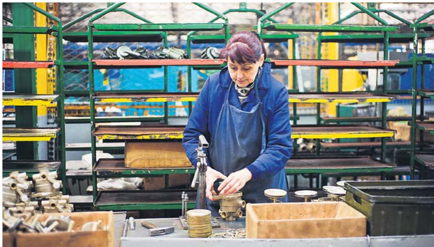
Кінцевий пункт усіх перемовин та угод – людина праці, її добробут і здоров'я

● – Кількість вирішених конфліктів. Інші – на контролі