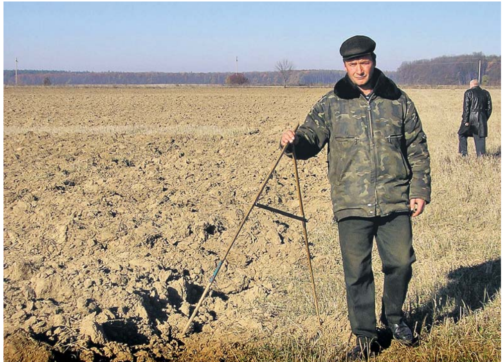
У підробленому проекті землеустрою земельні ділянки накладалися одна на одну, включали болота, луки і яри

Та сказати напевне, скільки часу доведеться чекати всім іншим ошуканим селянам, чому справа затягнулася на 4 роки і що потрібно зробити для її прискорення, не можуть навіть експерти. Ось і вір після цього в добрі наміри можновладців, в ефективність реформ і нововведень.