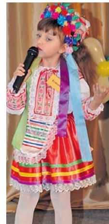
Наймолодша учасниця конкурсу

величкі зарплати, та все ж знаходять час і гроші для розвитку творчих здібностей своїх дітей. І не даремно – деякі дитячі роботи просто вражають майстерністю.