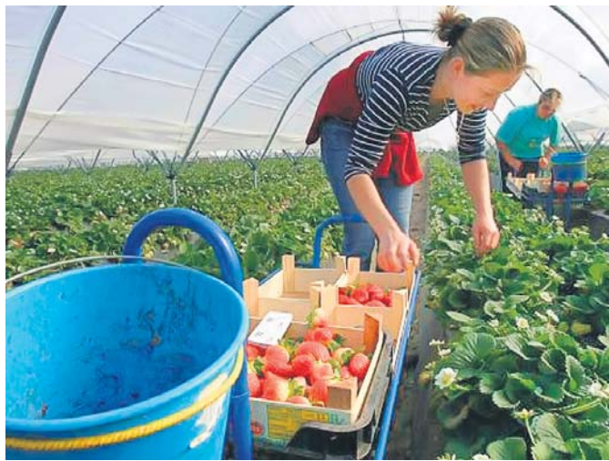
Сучасні оstarбайтери не цураються будь-якої роботи

У травні цього року офіційно відкривають свої ринки праці для поляків Німеччина та Австрія. Аналітики прогнозують, що кількість осіб, які виїдуть із Польщі на заробітки до цих країн, сягне до кінця 2012 року мільйона і що така міграція поглибить стагнацію польської економіки.