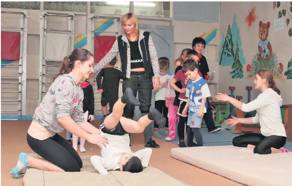
Акробатикою діти починають займатися з п'ятирічного віку