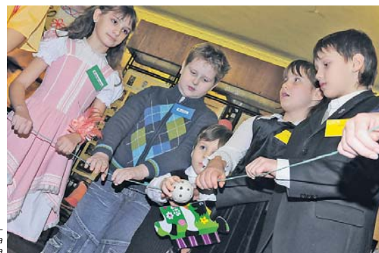
Весела гра – щаслива дитвора