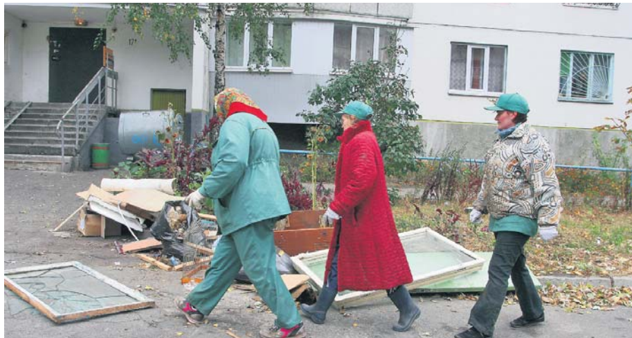
Українці наполягають: формування тарифів на послуги ЖКГ має бути прозорим