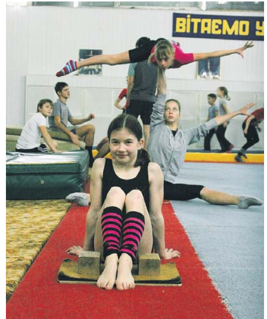
Піднесений настрій – запорука перемоги