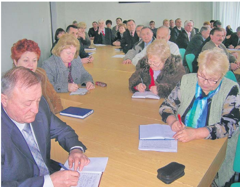
Обговорення пенсійної реформи відбулося у більшості регіонів України