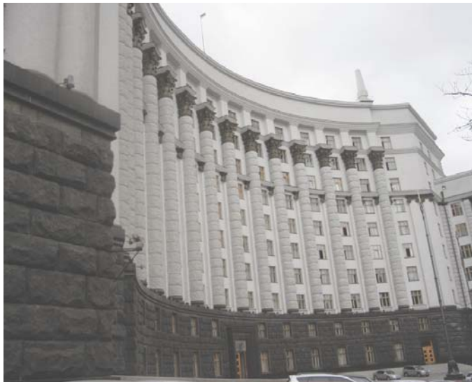
Уряд балансує між боргами та соціальною

Уряд схвалив концепцію удосконалення оплати праці «бюджетників». Здавалося б, і мета її задекларована чудова – створення умов для підвищення мотивації та ефективності роботи. Однак під час опрацювання документа в представників профспілок виникли сумніви відносно того, яким чином здійснюватимуться заходи подальшого удосконалення оплати праці та чи збережуться для цієї категорії ті державні соціальні