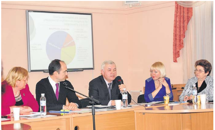
Невиплата стимулюючих надбавок «забиратиме» із кишень педагогів до 500 гривень щомісяця