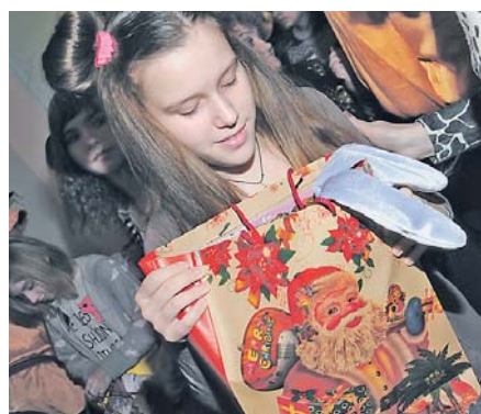
Іграшка – найкращий подарунок