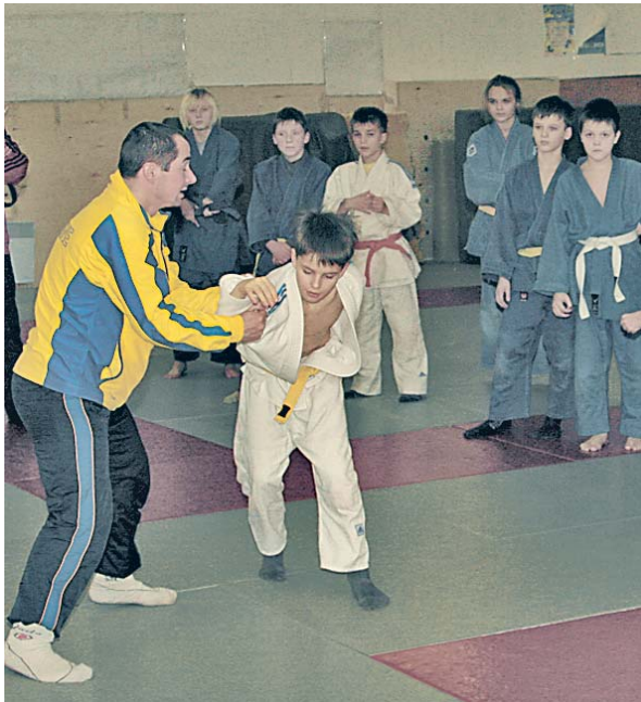
Завжди велелюдя у школі боротьби

На учбово-спортивній базі «Спартак» у складі п'яти дитячо-юнацьких спортивних шкіл займаються понад 2000 дітей. Зокрема, басейн відвідують майже 800 плавців, понад 400 юних атлетів вправляються в акробатиці, мужніх регбістів – майже 350, на татамі виходить понад 300 борців, практично стільки ж дітей і підлітків займаються легкою атлетикою. Лише минулоріч у спортшколах на базі «Спартак» підготовлено 7 майстрів спорту, 3 майстри спорту міжнародного класу, 46 кандидатів у майстри спорту, 64 «першорозрядники», ще 854 учні здобули масові розряди. 2010 року місцеві вихованці 151 раз піднімалися на п'єдестал пошани чемпіонатів України, здобули шістьох відзначених на континентальному рівні, на чемпіонатах світу і юнацьких Олімпійських іграх триумфували ще двоє «спартаківців».