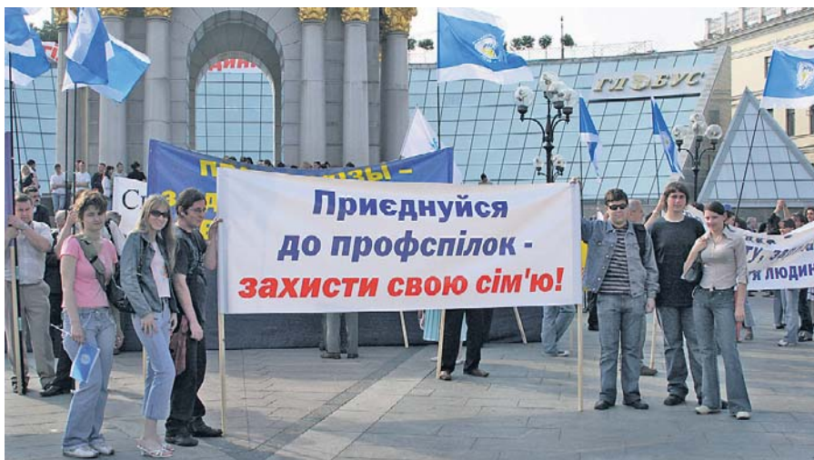
Профспілки повинні стати активними учасниками громадянського суспільства