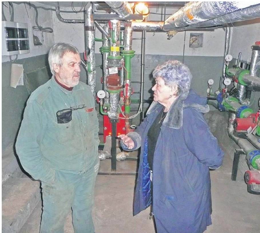
Кожного дня працівники «Кристалу-11» самостійно контролюють опалення будинку

можна зекономити завдяки встановленню індивідуальних теплових пунктів.