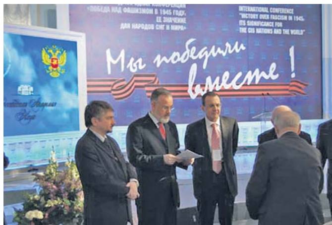
Міністр освіти і науки України Дмитро Табачник на Міжнародній конференції «Перемога над фашизмом в 1945 році: її значення для народів Схід та Заходу»

Вкотре розмірковуємо над питанням, чи так слід розвивати і зміцнювати дружбу між російським і українським народами, як це робить колишній президент, а нинішній прем'єр-міністр Російської Федерації Володимир Путін?