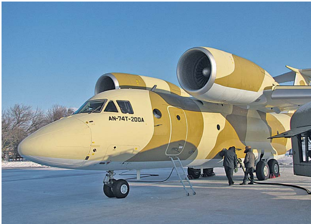
Крайній (в авіації уникають слова «останній») літак Ан-74 відлетів у листопаді 2010 року до Єгипту. За кордоном давно оцінили переваги української техніки – надійність і невибагливість в експлуатації