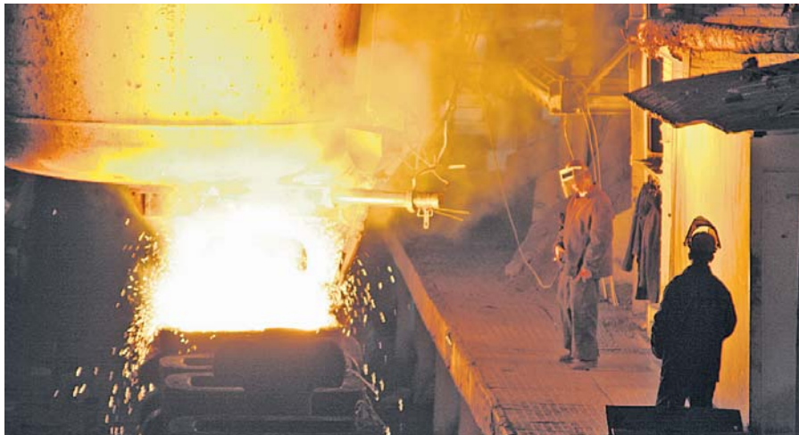
Близько 1,5 тис. тонн усіх видів брухту і відходів із вмістом дорогіших металів переробляють тут щороку