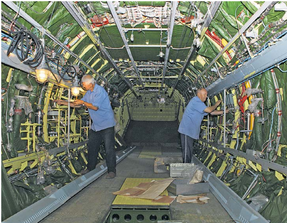
У цеху остаточного складання планер стає літаком у повному розумінні цього слова