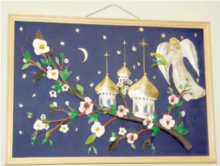
Ангел-хранитель над Донбасом