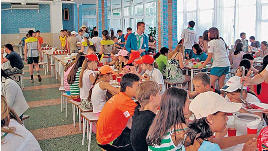
Профспілки ініціюють покращення норм харчування для закладів оздоровлення й відпочинку дітей