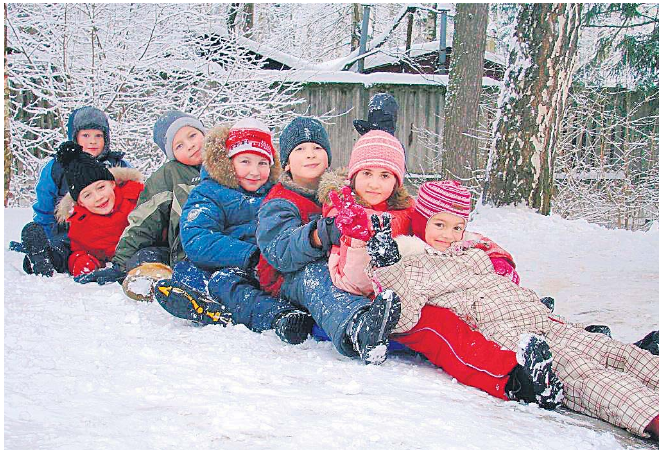
Діти з ВІЛ не становлять небезпеки навколишнім!

Лише протягом минулої осені, окрім столиці, подібні тренінги були проведені також у АР Крим, Одеській, Донецькій, Дніпропетровській, Миколаївській, Івано-Франківській, Херсонській, Хмельницькій та Черкаській областях. Навчання та бесіди проводилися не лише з членами ро-