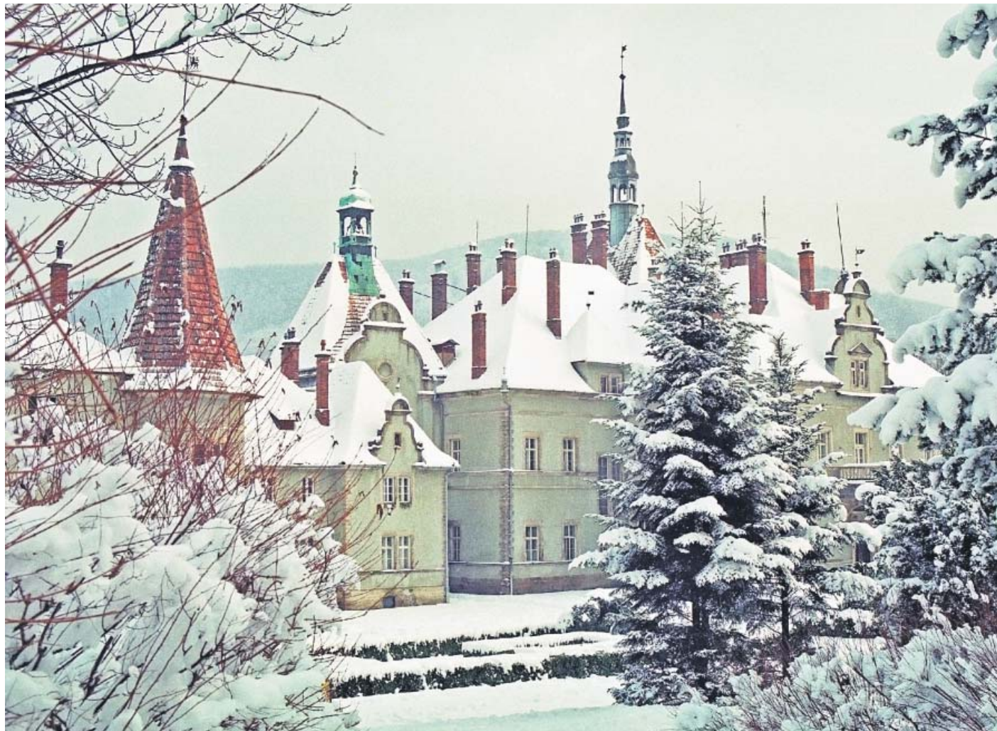
Санаторій "Карпати". Пам'ятка архітектури XIX ст. старовинний палац графа Фрідріха Шенборна