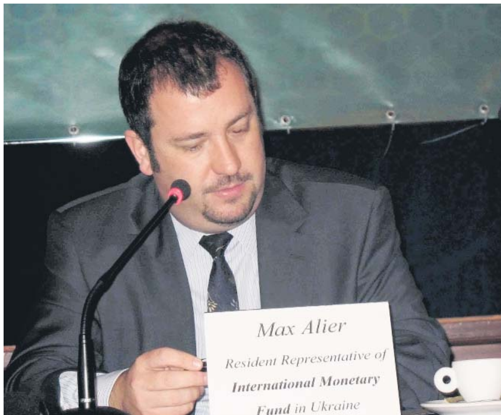
Глава представництва МВФ в Україні Макс Альєр готовий брати участь у тристоронній зустрічі профспілок, уряду й роботодавців

«Цього року МВФ уперше за всю історію українських кредитів пішов на спілкування з профспілками. Таким чином, ми близькі до можливості в майбутньому впливати на умови, які МВФ висуває до України як країни-позичальника», – поділився з «ПВ» враженнями від семінару «Відповідь профспілок на програму МВФ в Україні» заступник Голови ФПУ Сергій Українець.