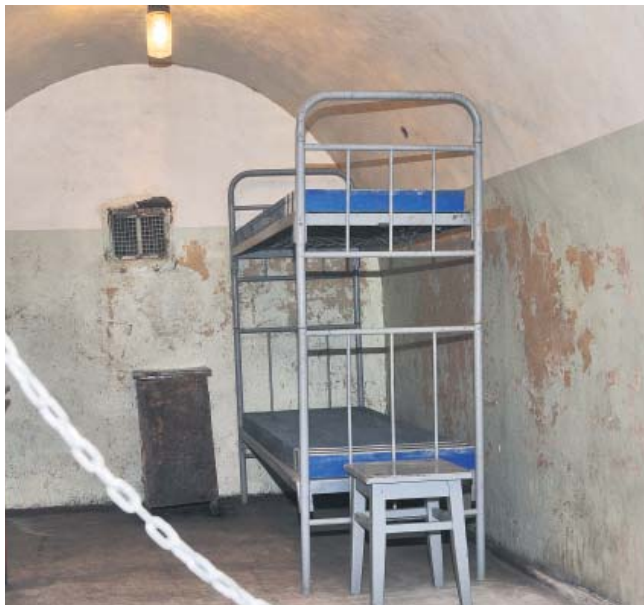
Кімната відпочинку обслуговуючого персоналу