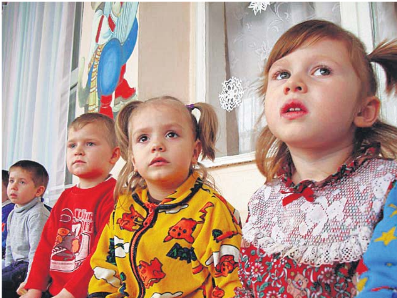
На візит Святого Миколая з нетерпінням очікує кожна дитина