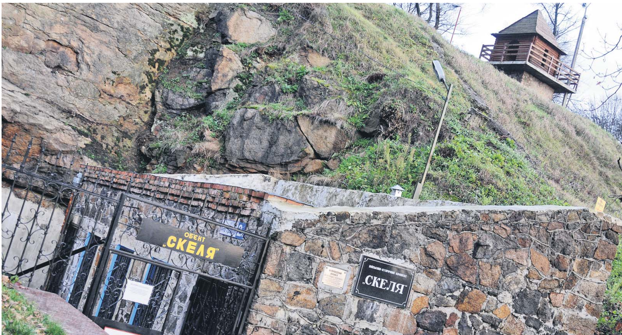
Командний пункт розташований на глибині 50 метрів

Є на Поліссі куточок, що привертає до себе увагу археологів, істориків і туристів. Це – Коростень, давня древлянська столиця, що простяглася на берегах річки Уж. Перші слов'янські племена оселились на цій території ще в V–VII століттях нашої ери. На місці одного з поселень, розташованого на високих гранітних скелях, і виникло місто, якому вже понад тисячу років. Сучасний Коростень є вдалим прикладом успішного місцевого самоврядування. Зусиллями громади, меценатів, підприємців відроджуються історичні пам'ятки, провадиться благоустрій зон відпочинку.