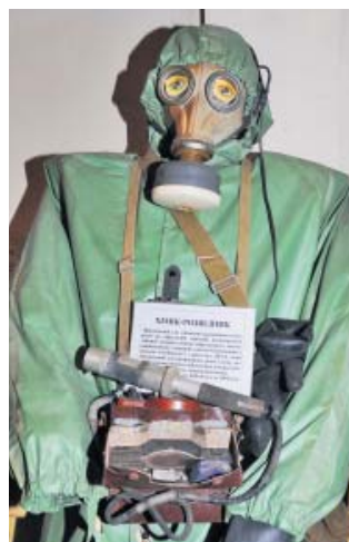
Серед представлених на експозиції протигазів є такі, конструкція яких свого часу становила військову таємницю

Потрібно дві години, щоб дістатися від Києва до Коростеня. Тутешні місця надзвичайно приваблюють тим, що дозволяють вивчати історію наочно, а не лише за книжками. Причому серед історичних місць Коростеня є не лише древлянські дохристиянські пам'ятки, а й унікальні згадки часів Великої Вітчизняної війни. Міська влада активно працює над створенням інвестиційно та туристично привабливого образу регіону. Приміром, будуються нові заводи, організуються фестивалі. Уже два роки поспіль у вересні тут проводять фестиваль дерунів, проте гостинні нащадки древлян із радістю почастиють вас цією стравою у будь-який час, коли ви завітаєте до Коростеня.