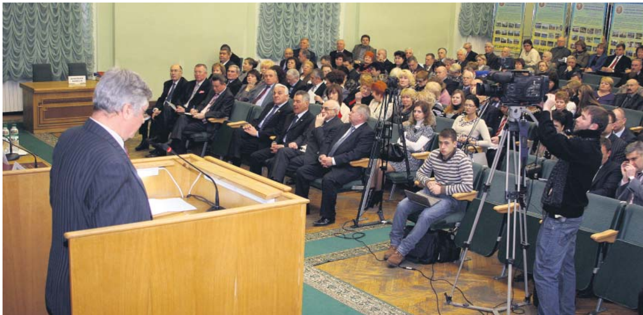
Делегати конференції представляли 4081 первинку 27-ми членських організацій Київської міськпрофради