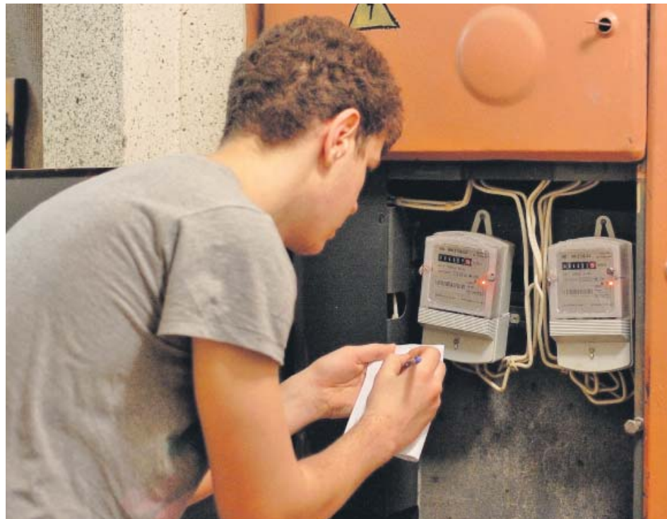
З нового року доведеться ретельно сплачувати за житлово-комунальні послуги

Понад півроку не відбуваються засідання правління Фонду соціального страхування з тимчасової втрати працездатності – на жаль, урядова сторона заблокувала і чергову спробу вирішити нагальні питання, яких накопичилося таки чимало. Нагадаю, що з 1 січня запроваджується сплата єдиного соціального внеску, а тому кожен із соціальних фондів у країні має до цього відповідно підготуватися. Зокрема, хоча б прийняти свої внутрішні нормативні акти, на основі яких і працювати в нових умовах. А крім того, треба затвердити бю-