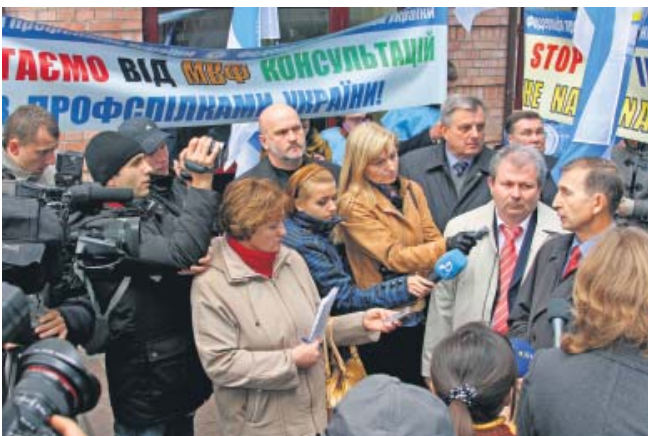
Акція протесту ФПУ під стінами представництва МВФ

З 15 умов, висунутих МВФ (дефіцит держбюджету не більш як 5,5% ВВП, низка вимог до Нацбанку, державних і комерційних банків та ін.), найбільше занепокоєння викликають у ФПУ три пункти: заморожування зарплат працівникам бюджетної сфери, підвищення тарифів на газ для населення і пенсійного віку для жінок. У Федерації вважають, що шукати резерви наповнення держбюджету потрібно не в кишнях громадян, а в промисловому виробництві.