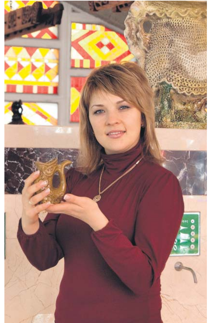
Приймання мінеральної води