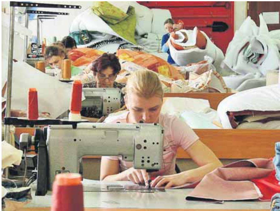
У цехах «Володарки» за швейними машинками – лише жінки, а за кордоном понад 40% – чоловіки

ГАЛИНА МАРКОВА, ЖИТОМИРСЬКА ОБЛ. ФОТО АВТОРА