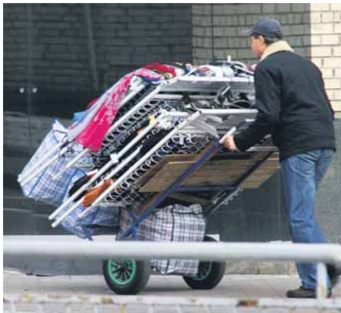
В умовах економії бюджету на соціальних виплатах українцям як і раніше доводиться розраховувати на самих себе

Під час понеділкових апаратної та селекторної наради у ФПУ аналізували відносини з міжнародними фінансовими інституціями, стан погашення заборгованості із виплати заробітної плати, судові розгляди справ за участю Федерації, низку запропонованих урядових новацій, стан справ у фондах соціального страхування. Зупинимося докладніше на головних моментах обговорення.