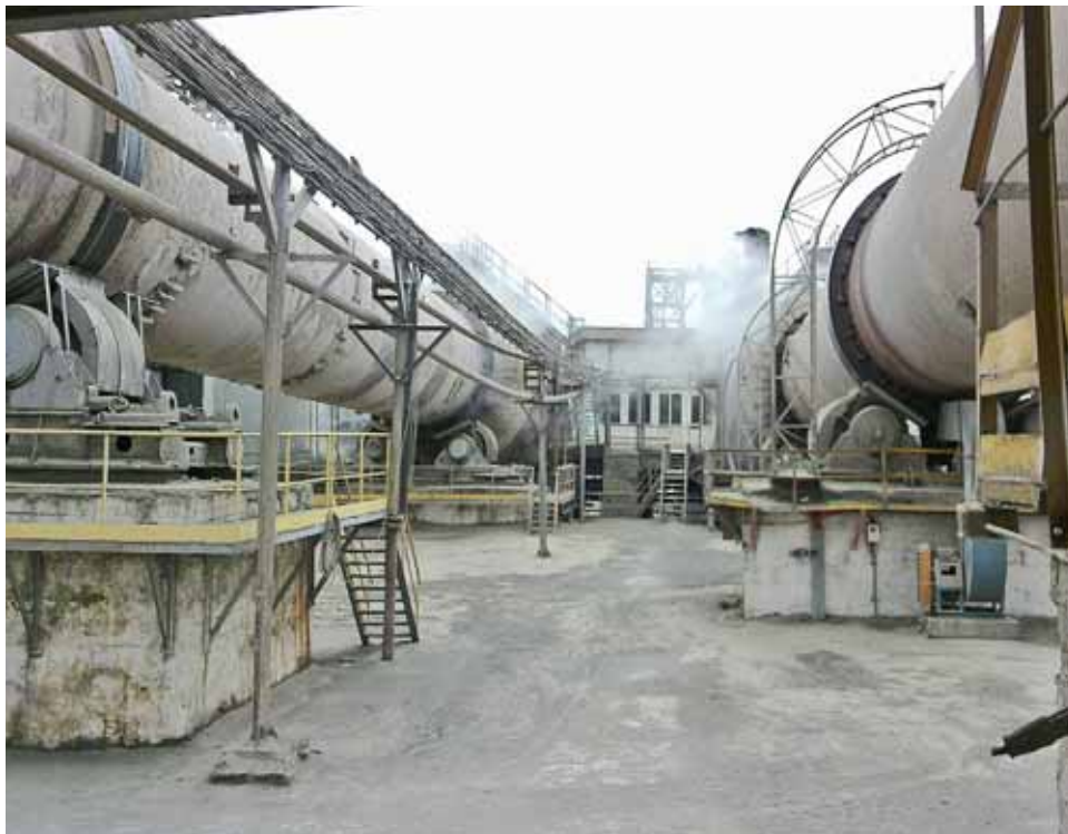
Нині на «Миколаївцементі» працює одна з п'яти обертових печей. Тому чотирьох із дев'яти машиністів ОП планують скоротити