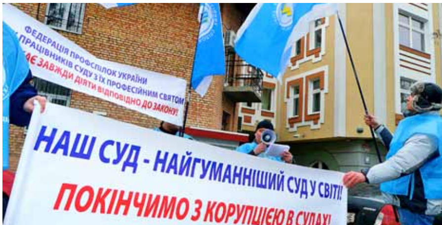
Під час пікетування судів активісти ФПУ пропонували відвідувачам послуги щодо роз'ясненя дій у разі прийняття суддями неправомірних рішень