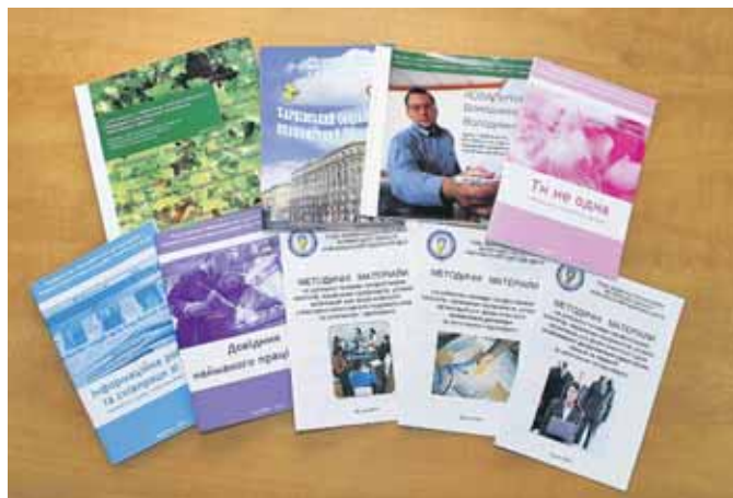
Методичні розробки кращих профспілкових навчально-методичних центрів

Наприкінці жовтня 2010 року відбулося засідання Президії ФПУ, яка, зокрема, постановила: узяти до відома інформацію про підсумки Всеукраїнського огляду-конкурсу навчальних закладів профспілок у 2010 році; продовжити проведення Всеукраїнського огляду-конкурсу навчальних закладів профспілок у наступному навчальному році.