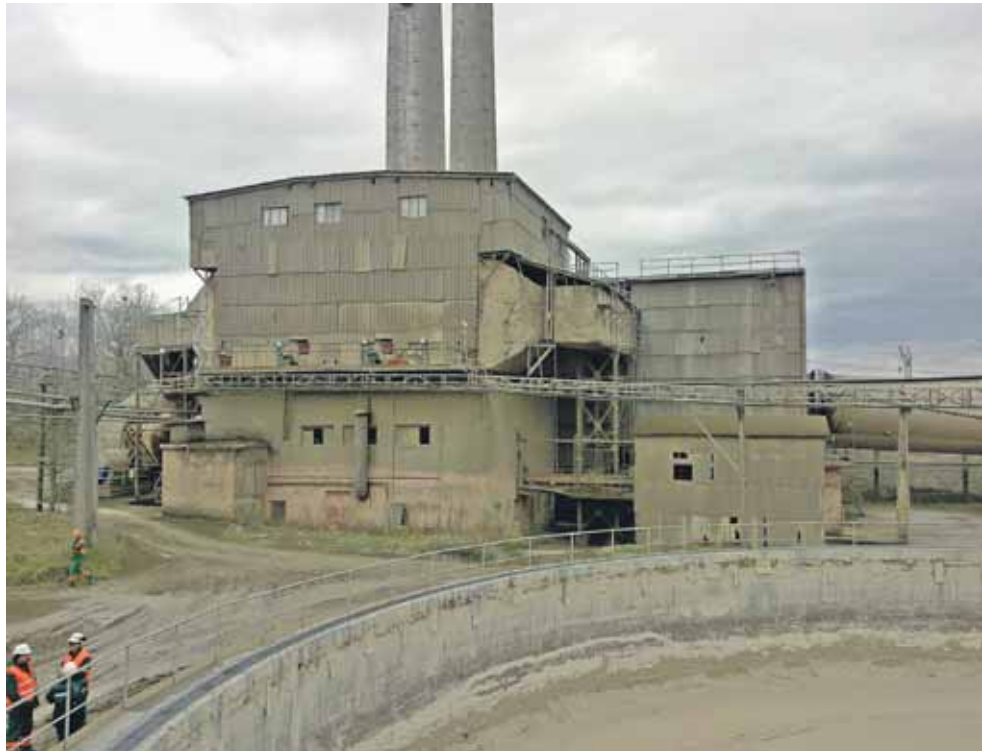
Суміш зі шламового басейну потрапляє до обертових печей, щоб згодом перетворитися на цемент

3. З метою професійного виконання допоміжних робіт, які не пов'язані з основним видом нашої діяльності, а саме, виробництвом цементу, та у відповідності із політикою «Лафарж», підприємство може користуватися послугами підрядних організацій» (Мову і орфографію оригіналу збережено – Ред.).