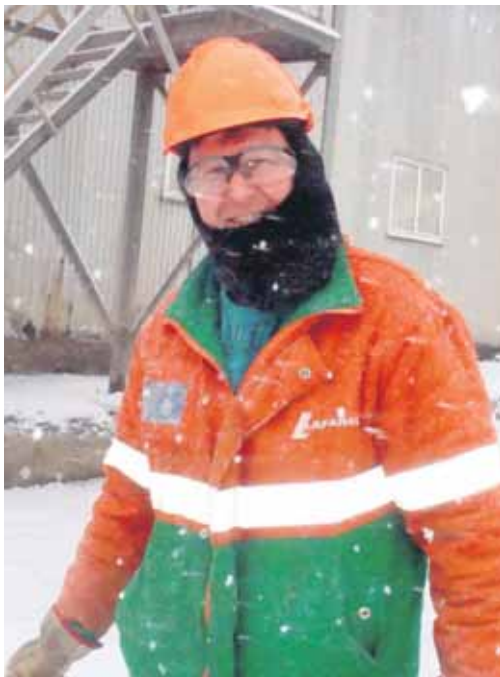
Працівники «Миколаївцементу» зобов'язані носити окуляри за будь-яких обставин