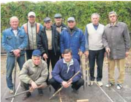
Учасники відкритого чемпіонату Ужгорода з городків