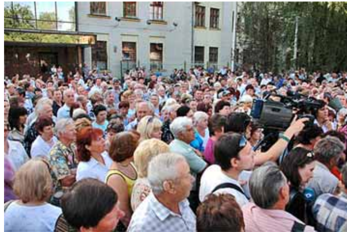
У червні 2010 року робітники ХПЗ на 5 годин перекрили вулицю біля заводу. Доложили небагато – виплати заробітної плати всього за один місяць