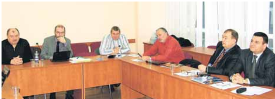
Учасники семінару обговорили пріоритети і стратегію питань охорони праці

Головна причина полягає у відсутності цілісної системи управління охороною праці й самовідстороненні від цієї роботи галузевих міністерств і місцевих органів влади, слабкому контролю за охороною праці на підприємствах, а також недостатньому фінансуванню профілактичних заходів.